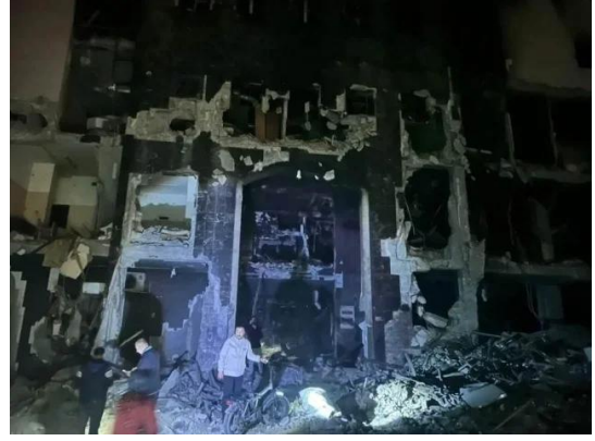
مشفى الشفاء بعد تدميره من قبل قوات الإحتلال الصهيوني