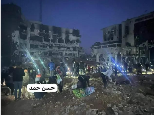
مشفى الشفاء بعد تدميره من قبل قوات الإحتلال الصهيوني