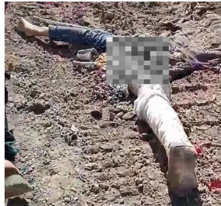
هذه صورة لمريض أجبره الجيش الإسرائيلي على إخلاء مستشفى الشفاء، لتدهسه دبابة إسرائيلية وهو لا يزال على قيد الحياة.