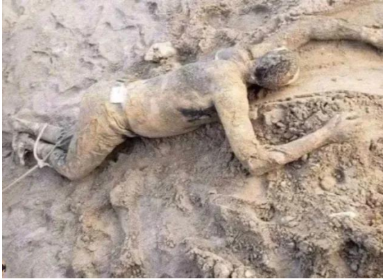
ولا تزال جثث الفلسطينيين المقيدة الأقدام الذين أعدمهم النظام الإسرائيلي، في انتظار انتشارها من ساحات مستشفى الشفاء بغزة بعد انسحاب الاحتلال.