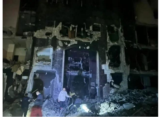
مشفى الشفاء بعد تدميره من قبل قوات الإحتلال الصهيوني