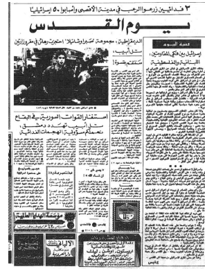
عملية يوم القدس - جريدة القبس