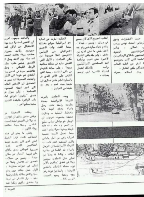
عملية يوم القدس