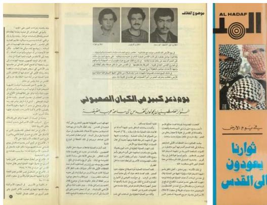
عملية يوم القدس