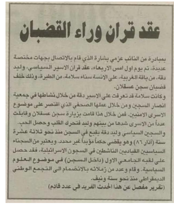
عقد قران الأسير الشهيد وليد دقة