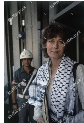
البريطانية فانيسا ريدغريف