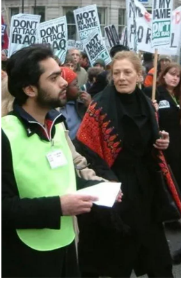
البريطانية فانيسا ريدغريف