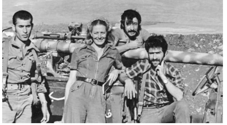
البريطانية فانيسا ريدغريف