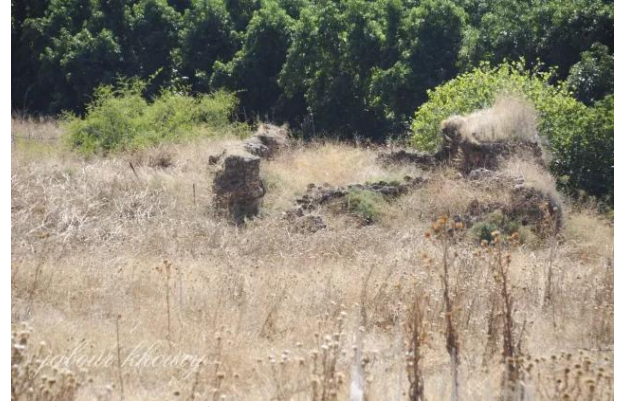
قرية خان الدوير المهجره - خان الدوير: بقايا الخان