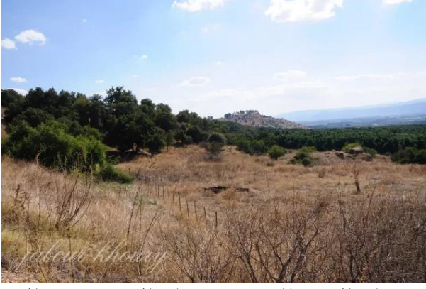
قرية خان الدوير المهجره - خان الدوير: موقع القرية ويظهر بقايا الخان وقرية خربه العزيزات على التل في خلفيه الصورة