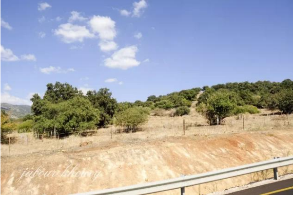
خان الدوير: شمال القرية