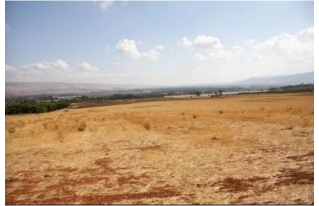
قرية السنبرية: اراضي القرية