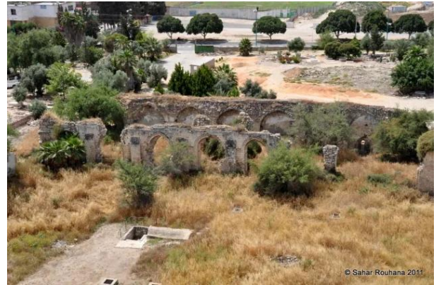
قرية السنبرية الفلسطينية المهجرة