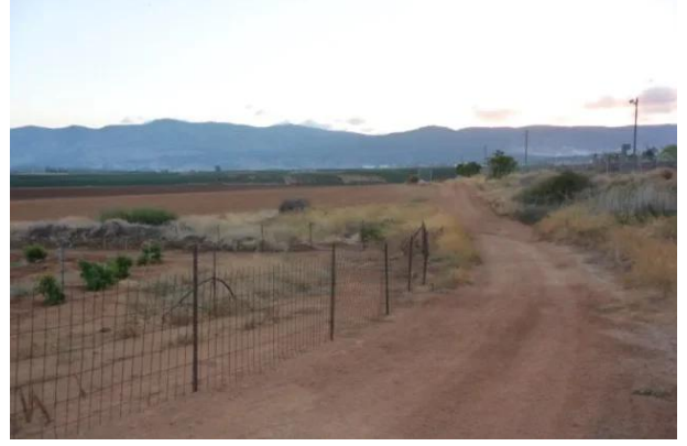
قرية السنبرية: منظر من اراضي السنبريه