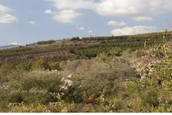
قرية السنبرية: اراضي القرية