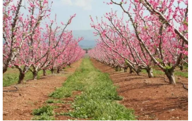
قرية السنبرية: اراضي السنبرية