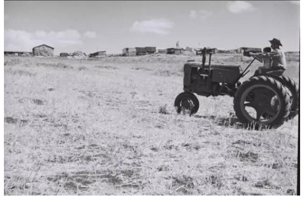
قرية السنبرية: صورته قديمه من السنبرية بعد احتلالها واستغلال المستوطنين اراضيها