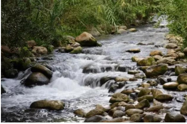
قرية السنبرية: نهر الحاصباني بالقرب من القرية