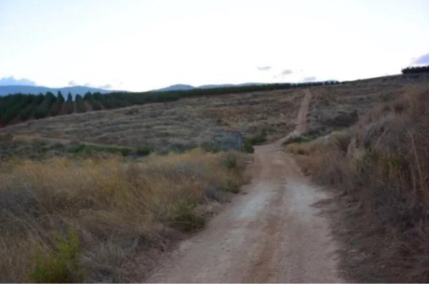
قرية السنبرية: منظر قريب من موقع القرية