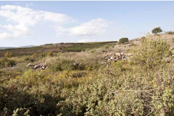
قرية السنبرية: مركز القرية على رأس التل وهناك اثار بعض المنازل المهدمه