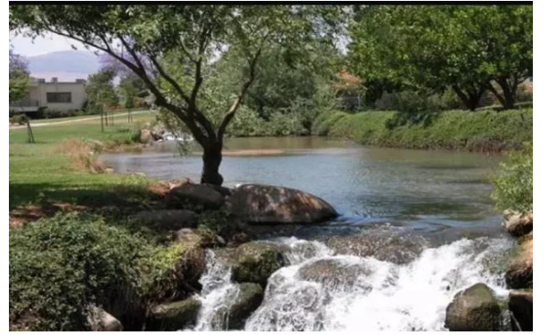
قرية المنصورة: نهر بانياس الى الشرق من القرية