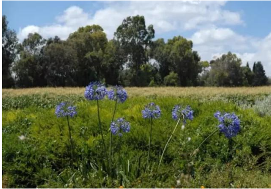
قرية المنصورة: منظر بالقرب من القرية