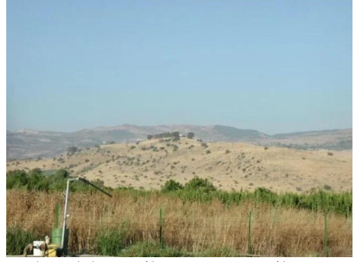
قرية المنصورة: موقع القرية وأراضيها