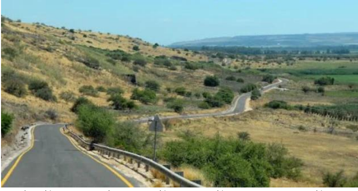
قرية المنصورة: حدود القرية من الشرق وتظهر هضبه الجولان