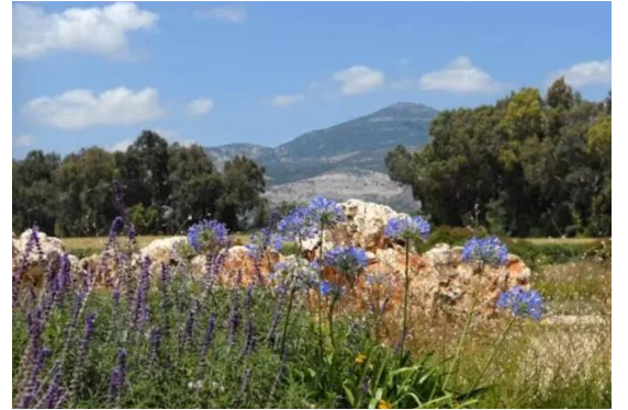
قرية المنصورة: أراضي القرية