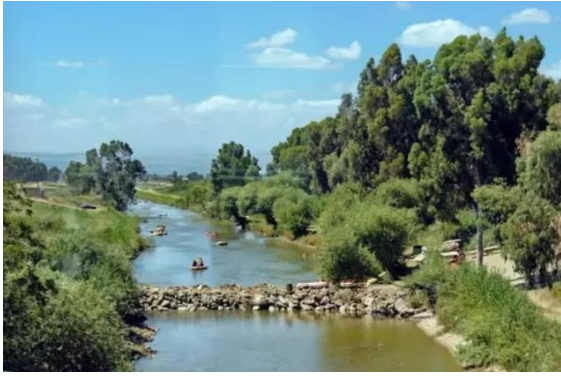
قرية المنصورة: نهر الحاصباني من غرب القرية