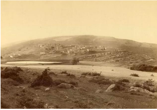
قرية هونين المهجرة