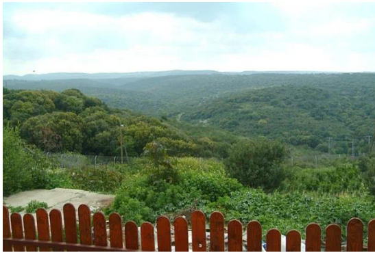
قرية هونين: منظر في اتجاه الأراضي البنانية من القرية المغتصبة