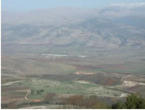
قرية هونين - منظر عام