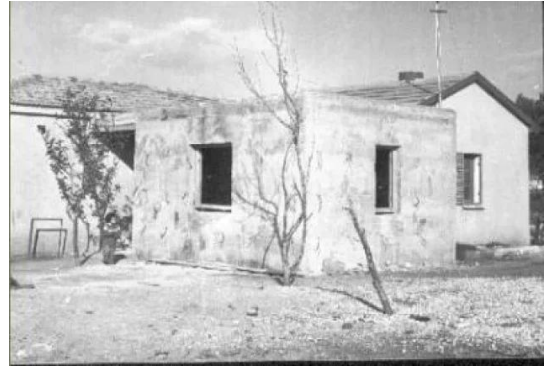
قرية هونين المهجرة