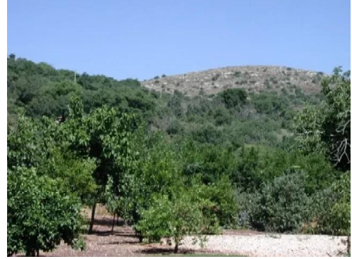
قرية هونين: كروم في أراضي القرية