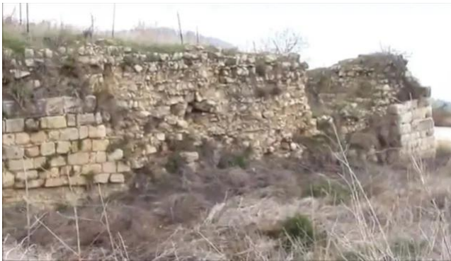
قرية هونين: اثار بيوت هونين