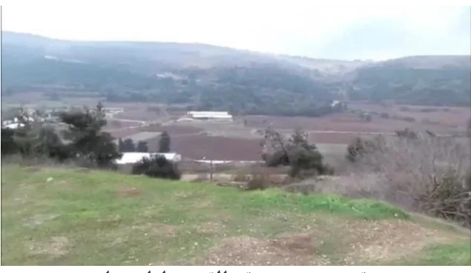
قرية هونين: موقع القرية وارضيتها