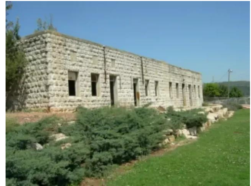
قرية هونين: مدرسة القرية المغتصبة