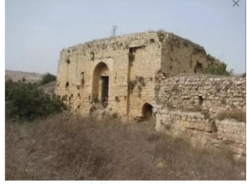
قرية هونين: القلعه