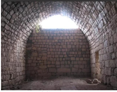
قرية هونين: القلعه