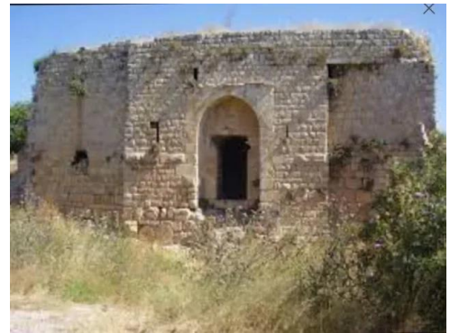
قرية هونين: قلعه هونين