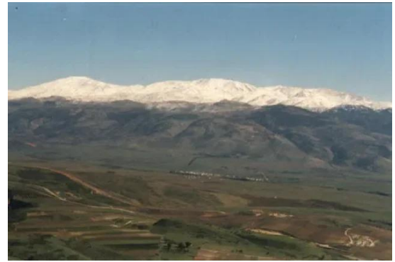
قرية هونين - منظر للأراضي وجبل الشيخ في الخلف