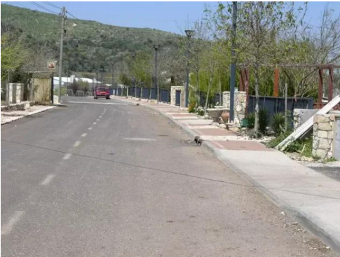
قرية هونين: منظر داخل المغتصبة بعد بنائها على أنقاض القرية