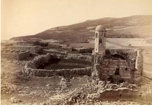
قرية هونين المهجرة