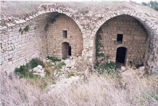
قرية هونين: القلعة الأثرية