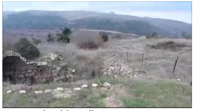
قرية هونين: موقع القرية وارضيتها