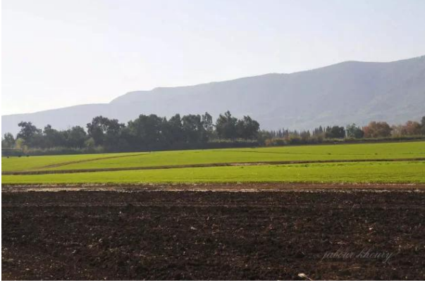
لزازة: اراضي القرية