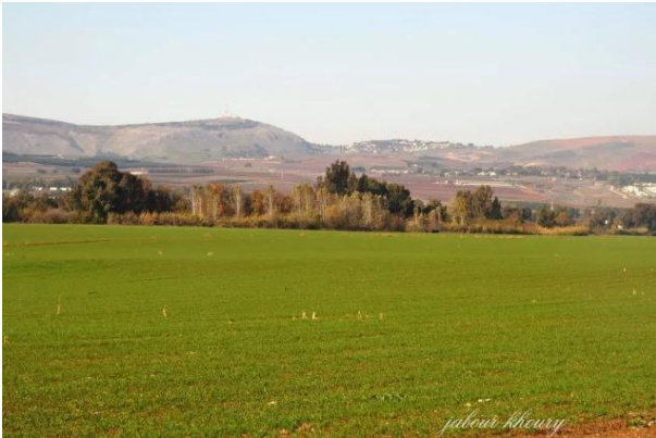
لزازة: اراضي القرية