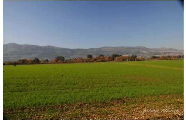
لزازة: اراضي القرية نظره من الشرق الى الغرب الاشجار العاليه تشير الى مجرى نهر الحاصباني