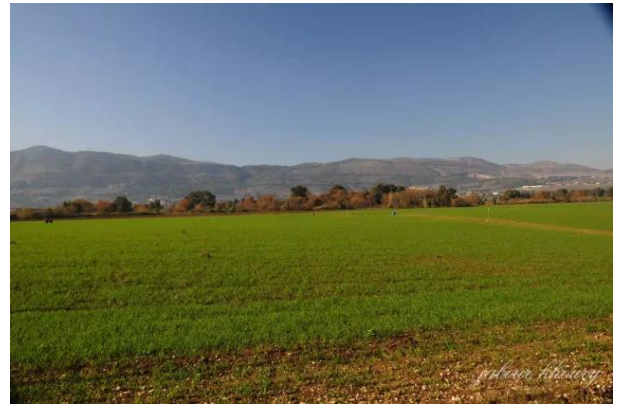
لزازة: اراضي القرية نظره من الشرق الى الغرب الاشجار العائيه تشير الى مجرى نهر الحاصباني