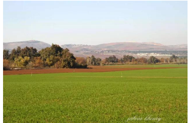
لزازة: موقع القرية