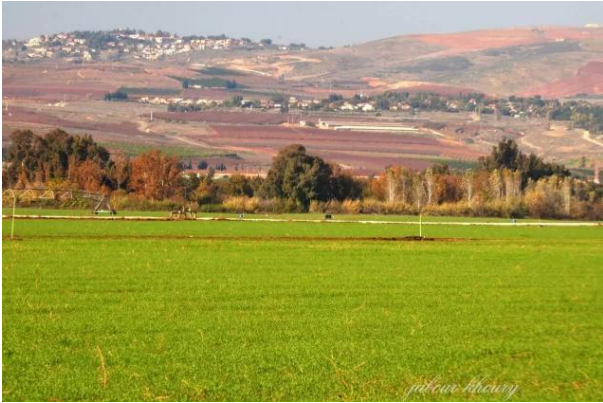
لزازة: موقع القرية