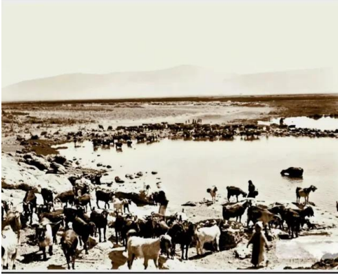
لزازة: صورة نادرة وساحرة لبحيرة الحولة قضاء صفد ثلاثينيات القرن العشرين..