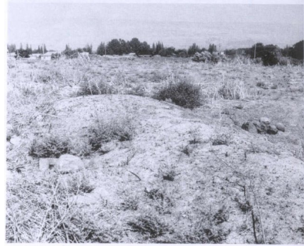
حجارة مبعثرة في موقع القرية. وتبدو مستعمرة بيت هيلل في أقصى الصورة (تموز/ يوليو ١٩٨٧) [لزازة]