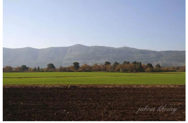
قيطية: اراضي القرية