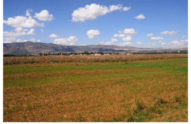
الدوارة: منظر لاراضي القرية من جهة الشمال