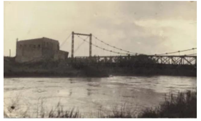
الدوارة: جسر الدواره قبل النكبه