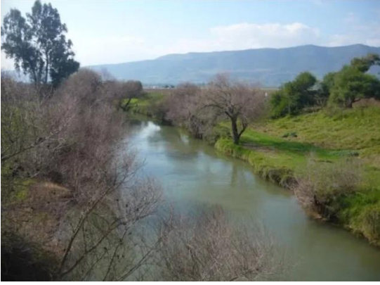
الدوارة: نهر الاردن يتوسط اراضي القرية