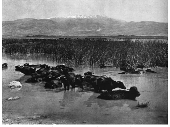
الدوارة: الدواره قبل النكبه