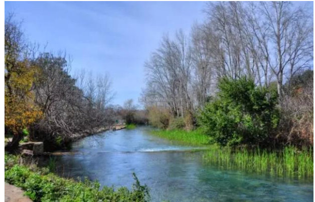
الدوارة: نهر الاردن قريب من القرية