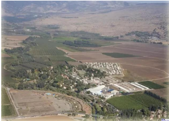
الدوارة: المستوطنه المقامه على اراضي القرية وعلى جهة اليمين مكان موقع القرية