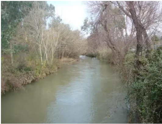
الدوارة: نهر الاردن يتوسط اراضي القرية