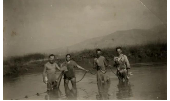
الدوارة: صورته قديمه للمستوطنين يستغلون اراضي القرية لتربيته الاسماك