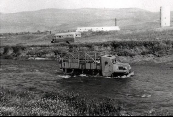
الدوارة: صوره قديمه لنهر الاردن جانب اراضي القرية والمستوطنه المقامه على اراضيها