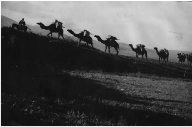
الدوارة: الدواره قبل النكبه