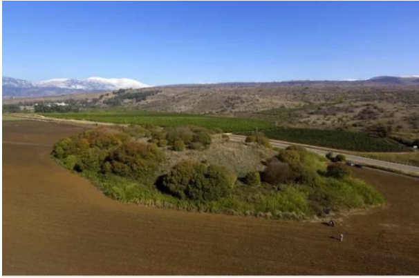
الدوارة: منظر من التله شرق القرية التي كان يستغلها اهل القرية كمراعي لماشيتهم