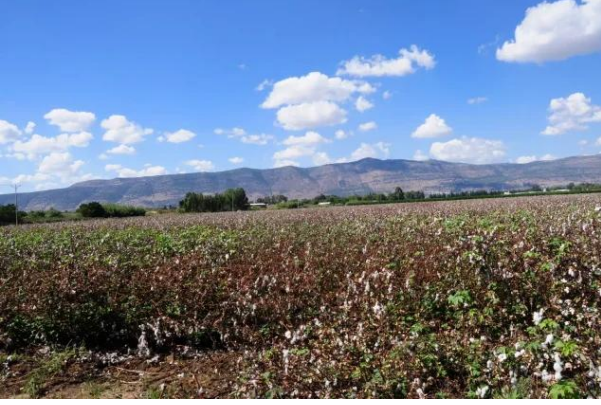
الدوارة: اراضي الدوارة باتجاه الجنوب الغربي وتظهر مستوطنه امير