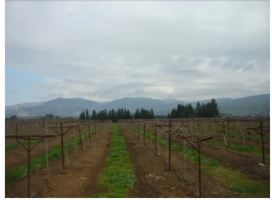
الدوارة: اراضي قريه الدوارة