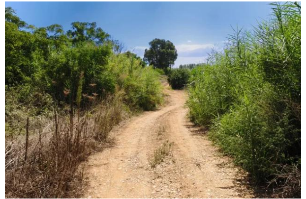
الدوارة: اراضي القرية من الجهة الجنوبيه