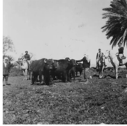
قرية الدوارة قبل النكبة