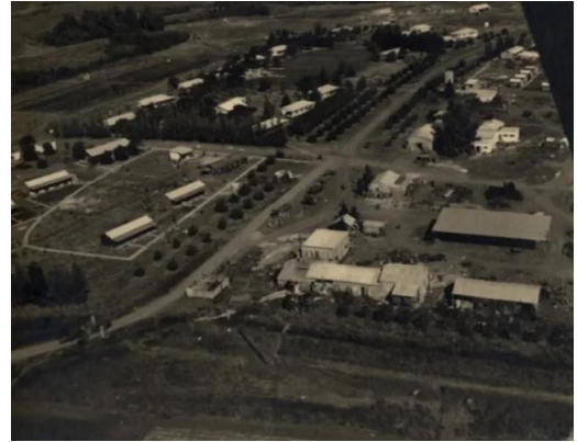
الدوارة: صورته قديمه للمستوطنه المقامه بجانب موقع القرية