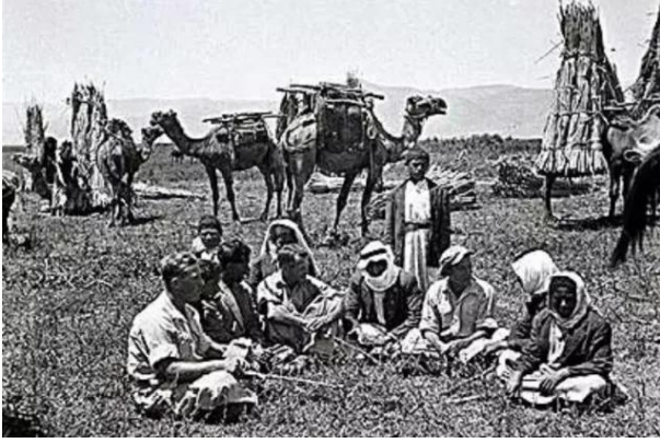
الدوارة: الدوارة قبل النكبة