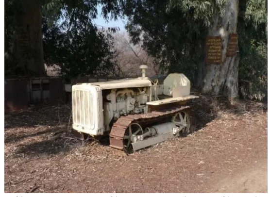
الدوارة: الات زراعيه قديمه بالقرب من موقع القرية