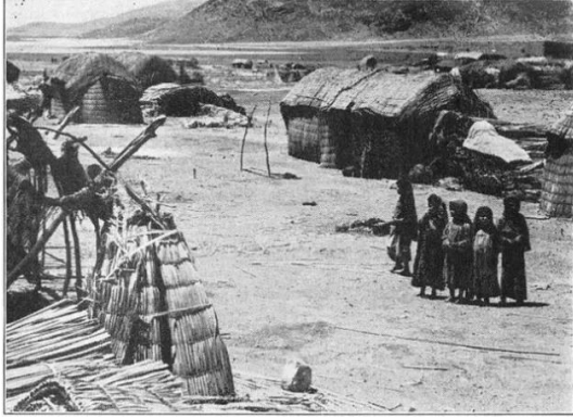
الصالحية: الصالحية قبل النكبة