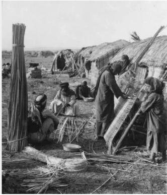
الصالحية: الصالحية قبل النكبة كانت مشهوره ببيوت القصب