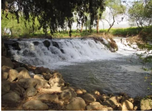
الصالحية: نهر الاردن من جانب القرية