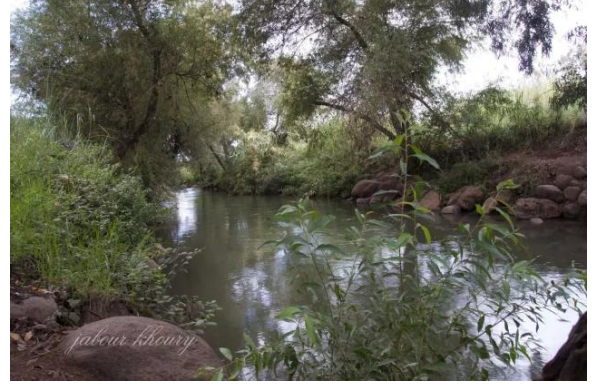
الصالحية: نهر الاردن عند مروره باراضي القرية