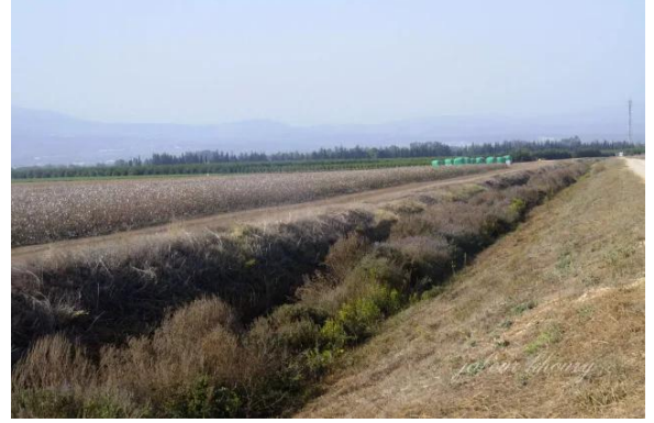
الصالحية: نظره باتجاه الشمال