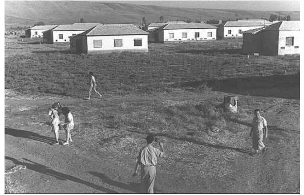
الصالحية: مستعمرة كفار بلوم اوائل انشائها شمال القرية