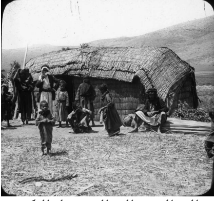
الصالحية: الصالحية قبل النكبة