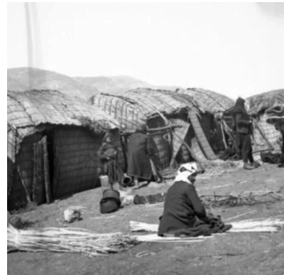
الصالحية: الصالحية قبل النكبة