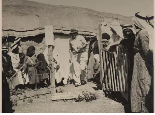
الصالحية: صورته قديمه من القرية قبل النكبة ويظهر بها الدكتور اليهودي الذي كان يزور القرية لمعالجة السكان من الملاريا