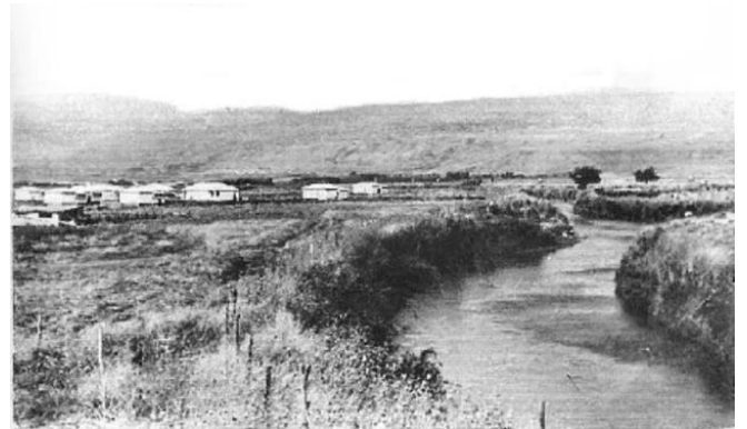
الصالحية: صورته قديمه من شمال القرية وتظهر مستعمرة كفار بلوم عند انشائها على اراضي القرية