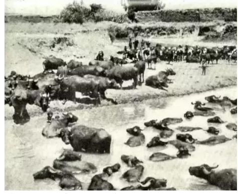
الصالحية: صورته قديمه من القرية وتظهر فيها الجواميس التي كانت مصدر رزق لسكان القرية