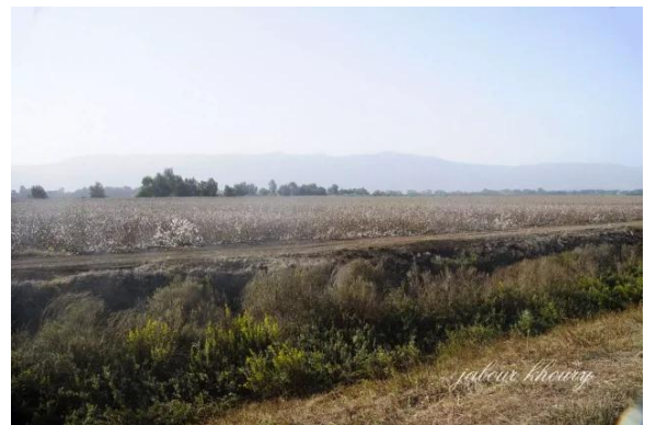
الصالحية: اراضي القرية