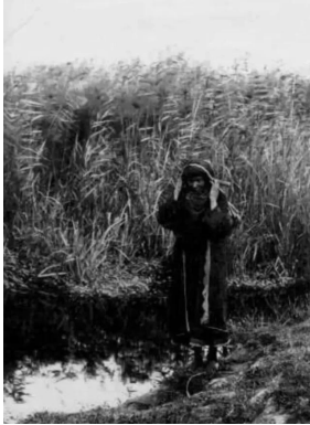
الصالحية: الصالحية قبل النكبة