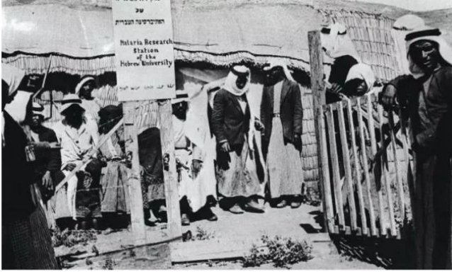
الصالحية: الصالحية قبل النكبة