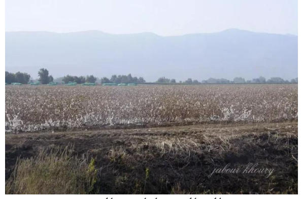
الصالحية: اراضي القرية