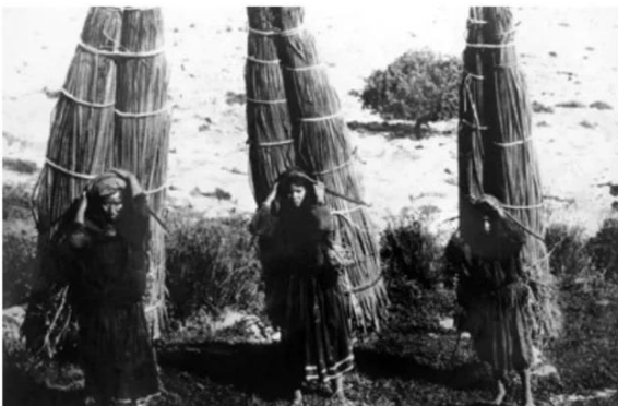
الصالحية: الصالحية قبل النكبة