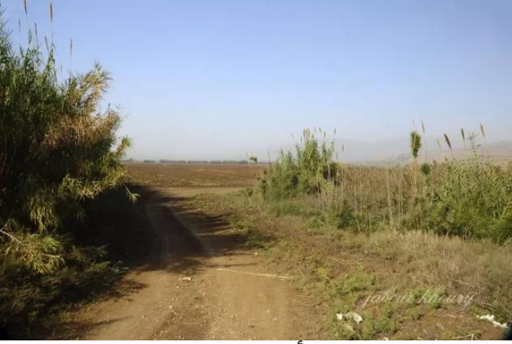
الصالحية: لم يتبقى ايا أثر للقرية وارااضي القرية تستغل من مزارعي مستوطنه كفار بلوم