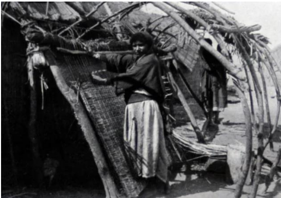
الصالحية: الصالحية قبل النكبة