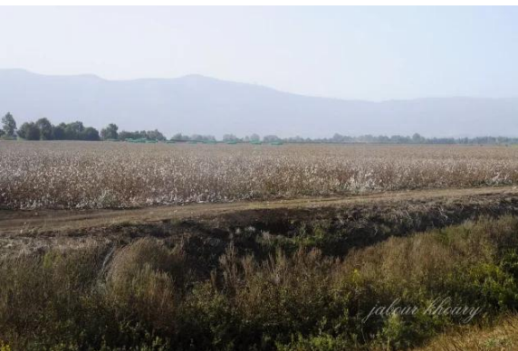
الصالحية: موقع القرية والاراضي المزروعه بالقطن