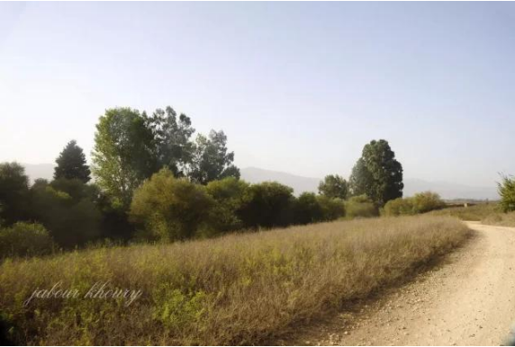
الصالحية: موقع القرية عن قرب