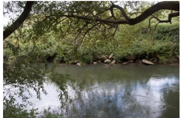
الصالحية: نهر الاردن