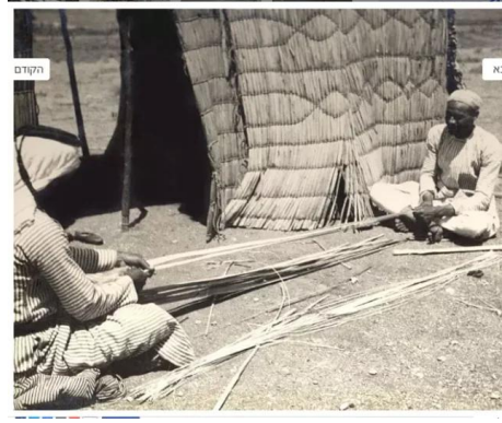
الصالحية: الصالحية قبل النكبة