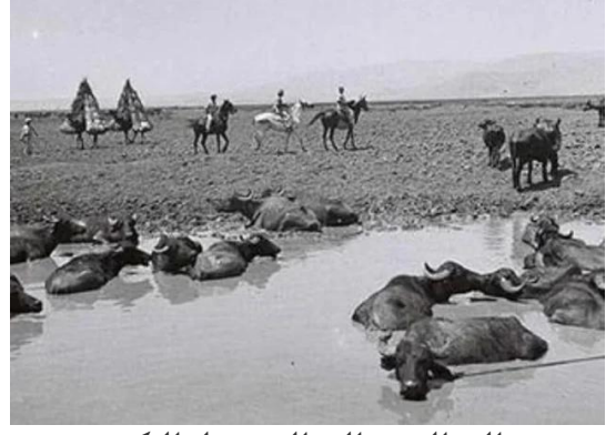
الصالحية: الصالحية قبل النكبة