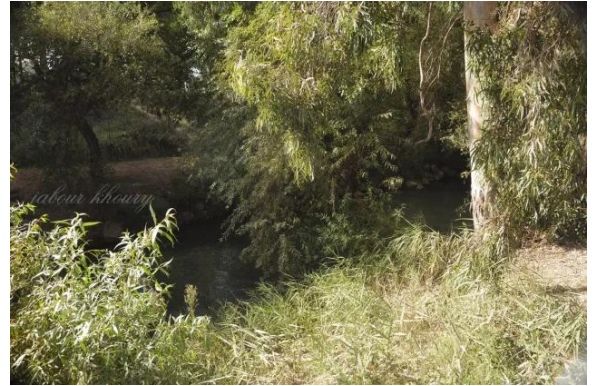
الصالحية: ضفاف نهر الاردن