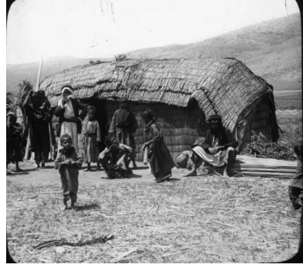
الصالحية: الصالحية قبل النكبة