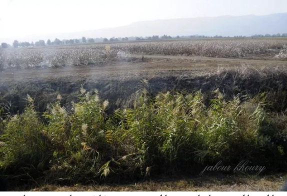
الصالحية: اراضي القرية وضفاف وادي ترعان