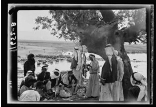
جاحولا: جاحولا قبل النكبه