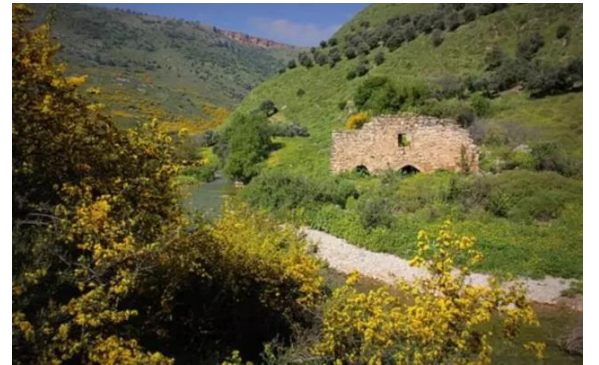
جاحولا: طاحونه على وادي الخنداج جنوب القرية