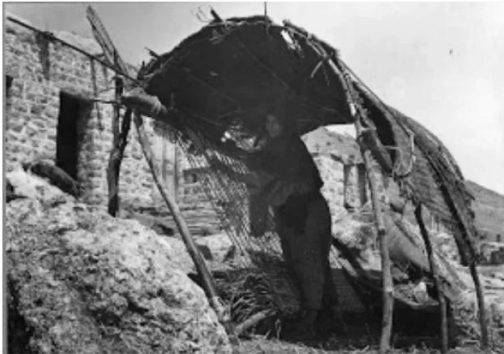
جاحولا: جاحولا قبل النكبه