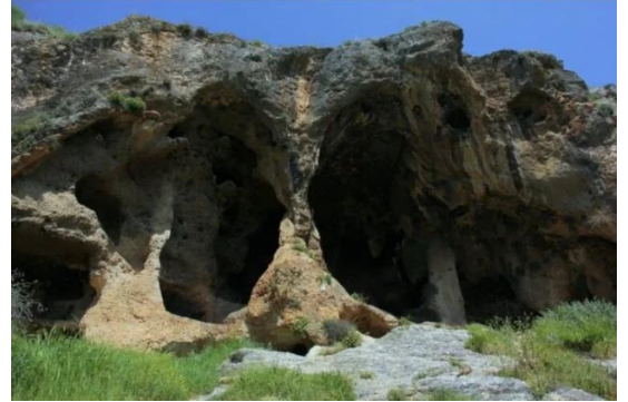
جاحولا: مغر قريبه من موقع القريه