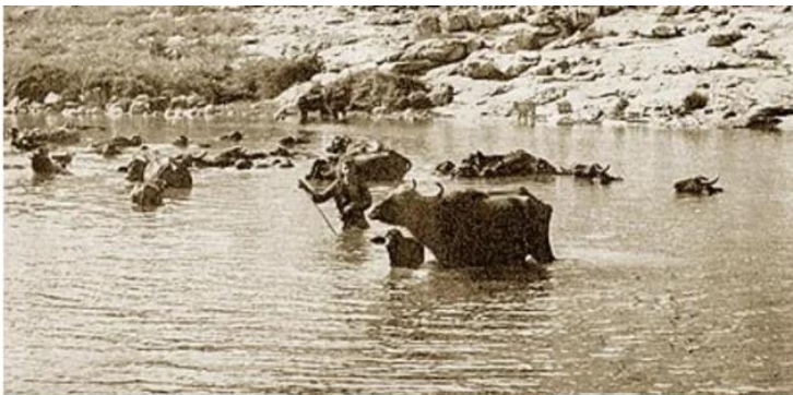
جاحولا: عين بلاطه سنه 1935