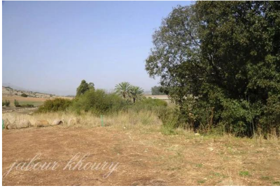
جاحولا: الجاحولا- منطقه العين