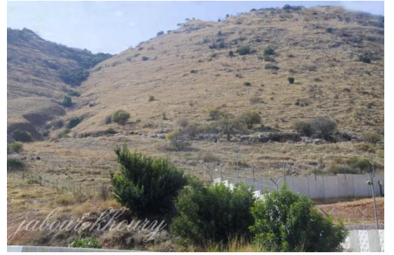
جاحولا: الجاحولا- التلال والوادي المحيط بالقرية من جهة الجنوب عرب