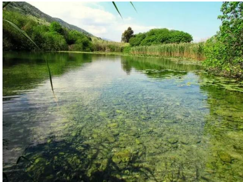
جاحولا: عين بلاطه