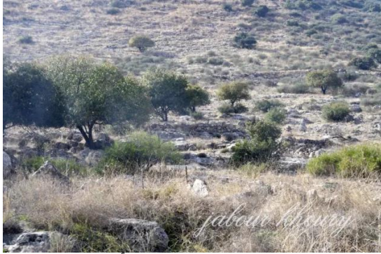
جاحولا: الجاحولا- غرب القرية وأثار ردم البيوت