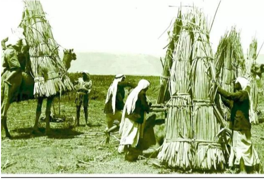
جاحولا: حزم القصب في محيط بحيرة الحولة عام 1946..