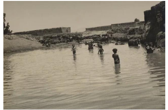
جاحولا: اطفال جاحولا يستحمون في عين بلاطه قبل النكبه