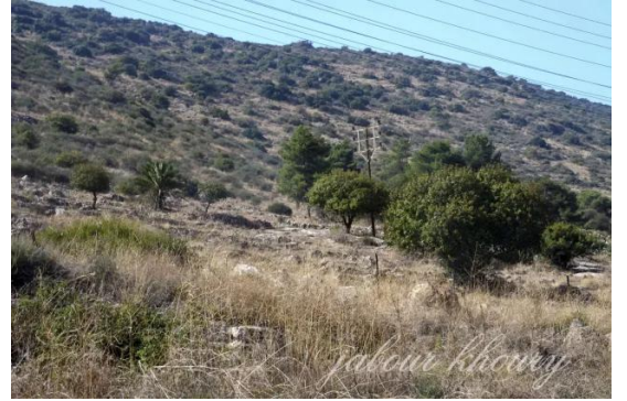
جاحولا: الجاحولا- بقايا بعض المنازل في غرب القرية