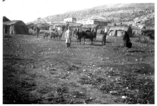
جاحولا: جاحولا قبل النكبه