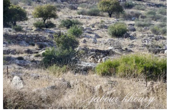
جاحولا: الجاحولا- شمال غرب القرية