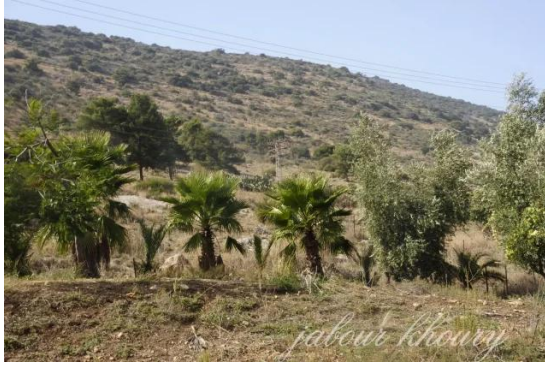
جاحولا: الجاحولا- اشجار الصبار والنخيل في شمال غرب القرية