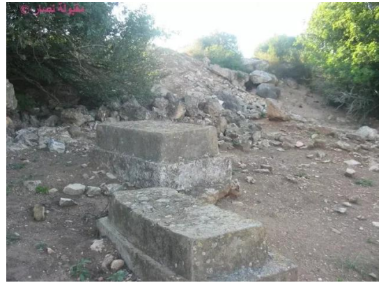
النبي يوشع: مقبرة القرية , 7.5.2005- تصوير: مقبولة نصار