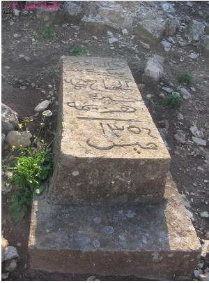
النبي يوشع: مقبرة القرية , 7.5.2005