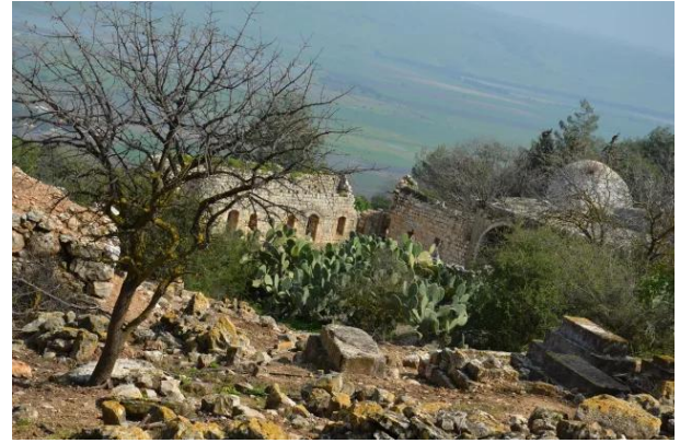
النبي يوشع: قبور مندثرة في بقعة مقام النبي يوشع