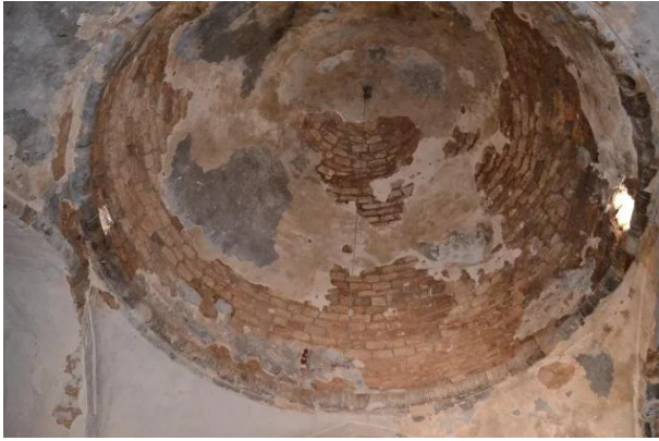
النبي يوشع: القبة التي تعلو ضريح مقام النبي يوشع !..