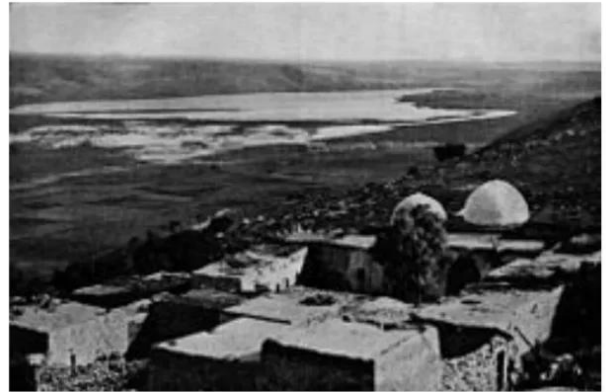
النبي يوشع: النبي يوشع قبل النكبة