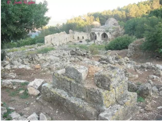
النبي يوشع: مقام النبي يوشع والمقبرة, آخر ما بقي في القرية, 7.5.2005