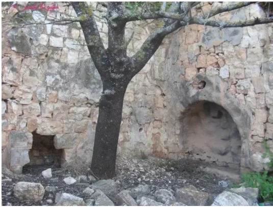
النبي يوشع: غرف المقام من الداخل , 7.5.2005