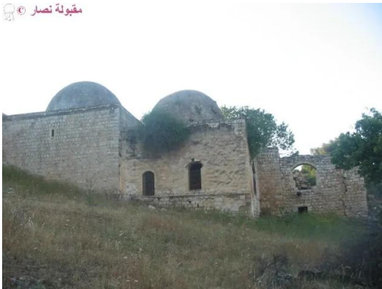
النبي يوشع: الناحية الخلفية, 7.5.2005