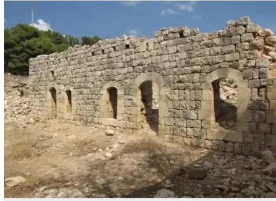
النبي يوشع: بقايا بيوت القرية