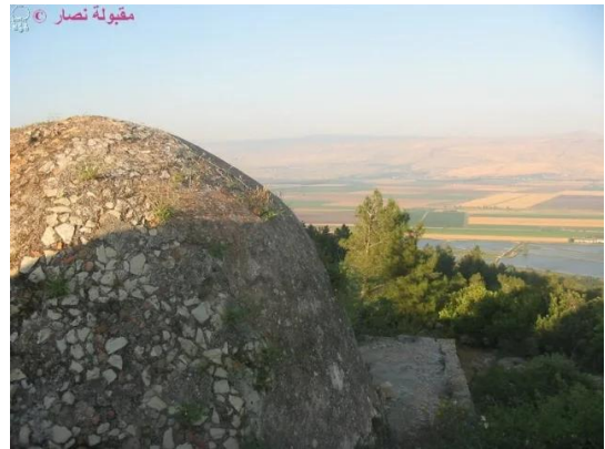
النبي يوشع: سطح المقام يظهر في الافق سهل الحولة, 7.5.2005- تصوير: مقبولة نصار