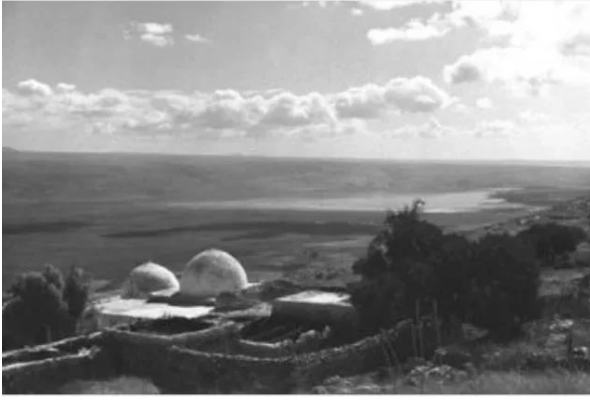
النبي يوشع: النبي يوشع قبل النكبة