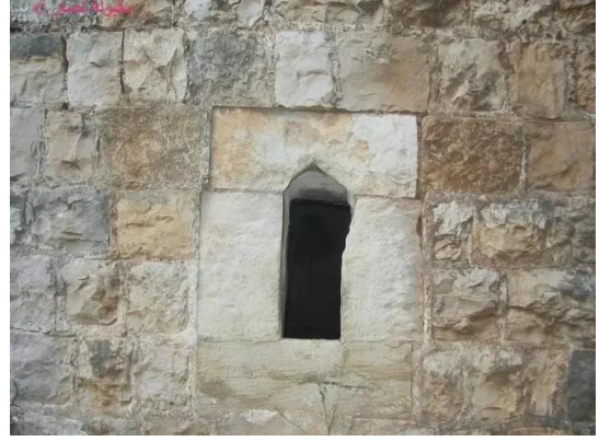
النبي يوشع: احدى نوافذ المقام , 7.5.2005