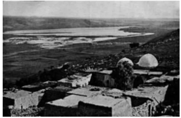
النبي يوشع: النبي يوشع قبل النكبه