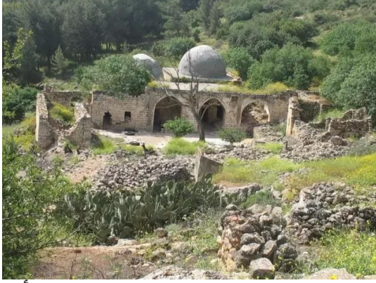
النبي يوشع: منظر عام لمنطقة المقام وتظهر أطلال القرية المدمرة في المقدمة