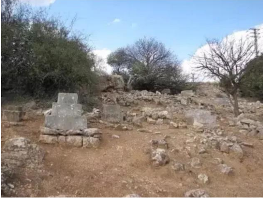
النبي يوشع: مقبره النبي يوشع