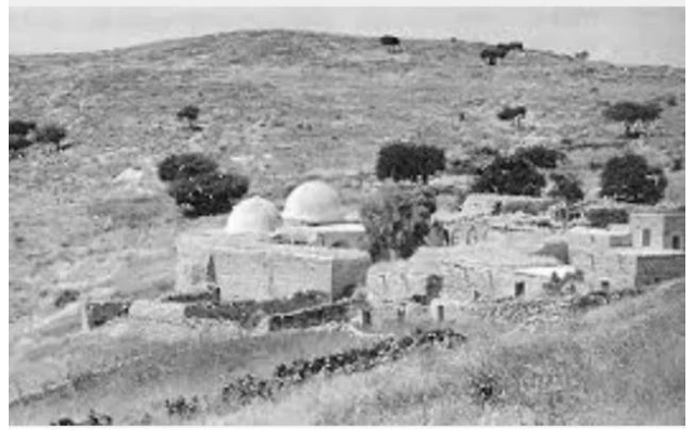
النبي يوشع: قرية النبي يوشع قبل النكبة