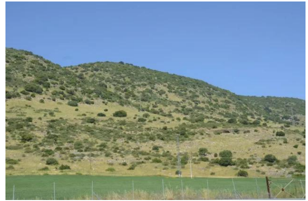
النبي يوشع: موقع القرية