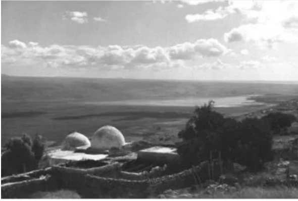
النبي يوشع: النبي يوشع قبل النكبه