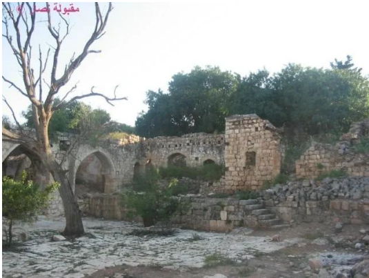
النبي يوشع: مقام النبي يوشع والمقبرة, والغرف المحيطة بالمقام, 7.5.2005