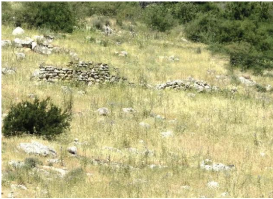
النبي يوشع: موقع القرية