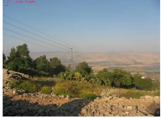
النبي يوشع: سهل الحولة كما نراه من موقع القرية , 7.5.2005