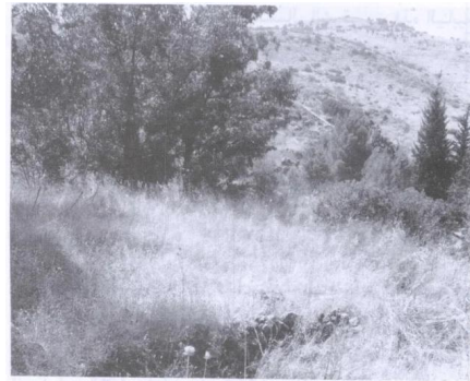
أراضي القرية كما تبدو للناظر من الجهة الغربية لسهل الحولة (تموز/ يوليو ١٩٨٧) [عرب الزبيد]