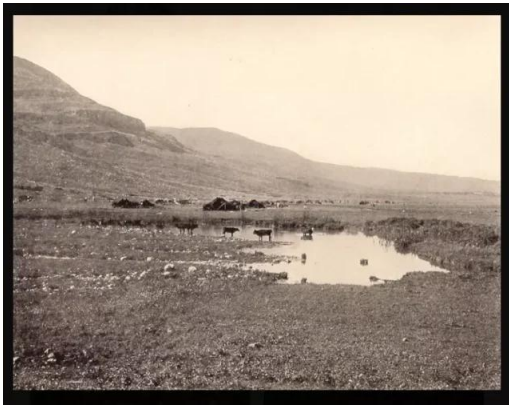
عرب الزبيد: من نواحي عرب الزبيد قبل النكبة