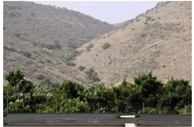
عرب الزبيد: موقع القرية كما يظهر من اراضي العلمانيه