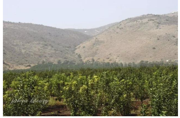
عرب الزبيد: موقع القرية كما يظهر من اراضي العلمانيه