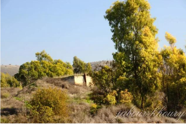
تليل: مركز القرية والخان