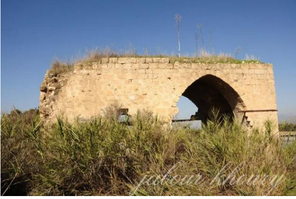
تلليل: مبنى الخان