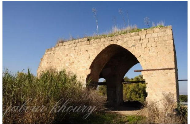
تلليل: مبنى الخان