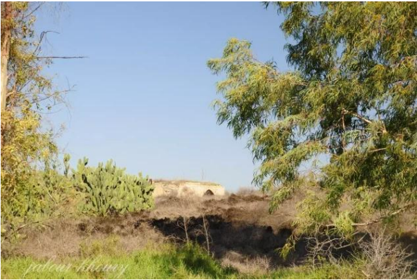
تلليل: غرب القرية