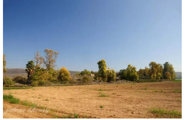
تليل: يظهر في الصورة جزء من سهل الحوله التي تقع عند اطرافه الشرقيه قريه تليل وعندها يلتقي واديا الحنداج ووقاص