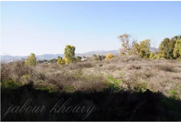
تلليل: موقع القرية المغطى بالاعشاب والاشجار وتظهر مستوطنه حولتا التي اقيمت على اراضي القرية