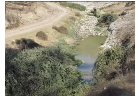
الرأس الأحمر: من وديان القرية