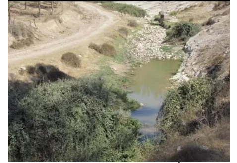
الرأس الأحمر: من وديان القرية