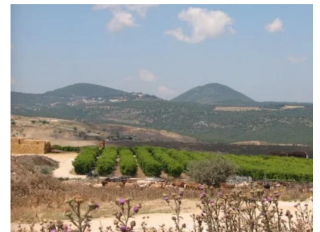
الرأس الأحمر: اراضي القرية