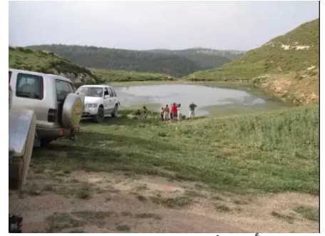
الرأس الأحمر: منظر لبركه القرية