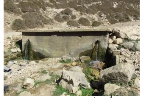
الرأس الأحمر: مصادر مياه القرية