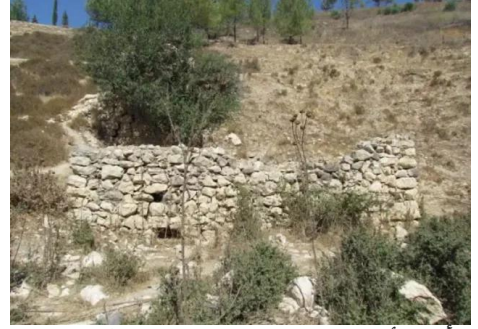
الرأس الأحمر: بقايا لمبنى قديم على اطراف القرية