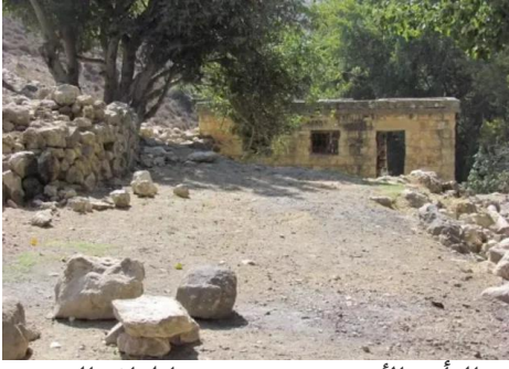
الرأس الأحمر: بيت قديم من اطراف القرية