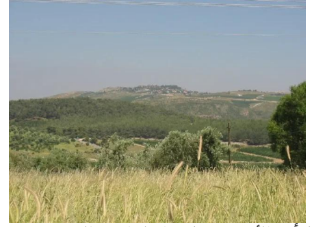
الرأس الأحمر: منظر عام لاراضي القرية من جهة قرية كفر برعم المدمرة المجاورة