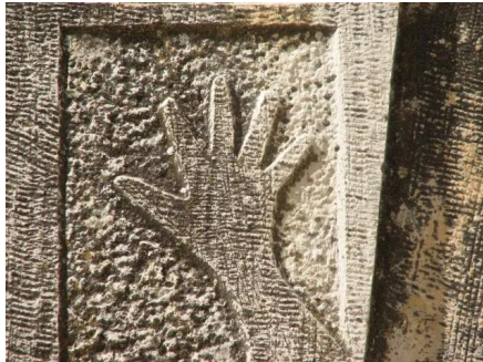
الرأس الأحمر: صورته يد على أحد جدران المدرسة