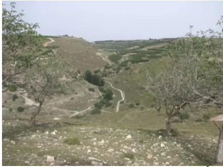
الرأس الأحمر: اشجار التين من نواحي القرية