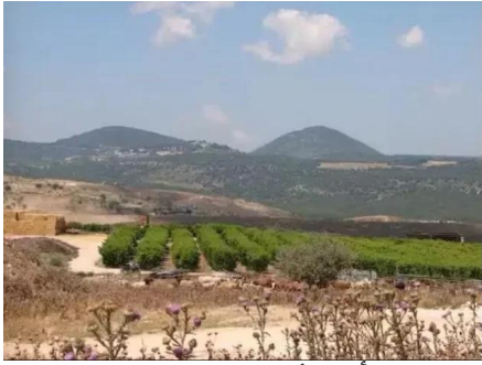
الرأس الأحمر: اراضي القرية