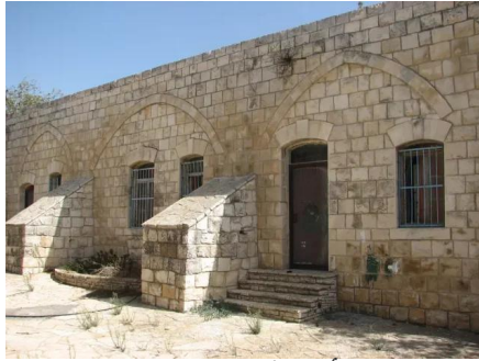
الرأس الأحمر: المدرسة