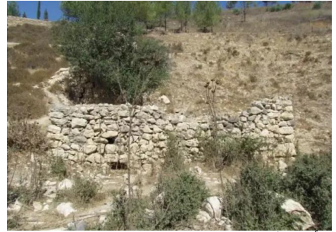
الرأس الأحمر: بقايا لمبنى قديم على اطراف القرية