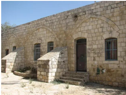
الرأس الأحمر: المدرسة