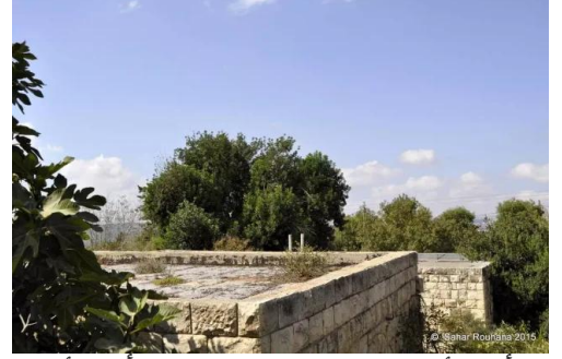
الرأس الأحمر: جولة بين بيوت قرية الرأس الأحمر المهجرة