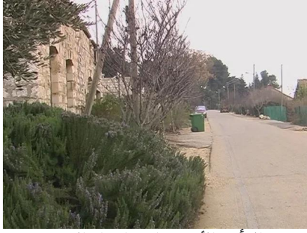
الرأس الأحمر: احد احياء القرية