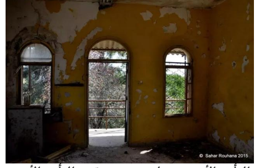
الرأس الأحمر: جولة بين بيوت قرية الرأس الأحمر المهجرة - تصوير سحر روحانا