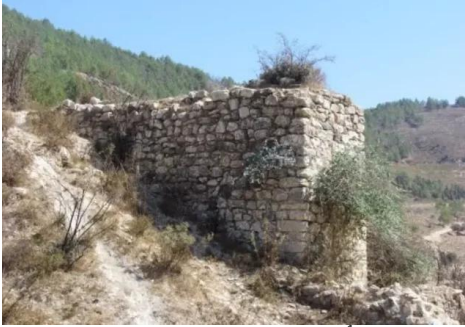
الرأس الأحمر: طواحين القرية