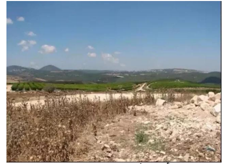
الرأس الأحمر: اراضي القرية