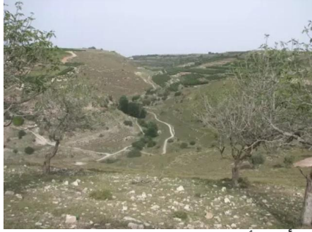
الرأس الأحمر: اشجار التين من نواحي القرية