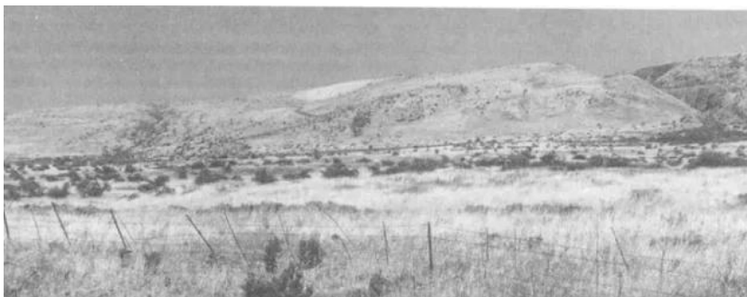
الرأس الأحمر: منظر عام لموقع القرية التي دمرها الصهاينة وطهروا سكانها عرقياً، 1990.