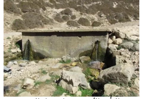
الرأس الأحمر: مصادر مياه القرية