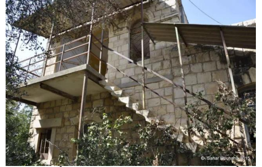
الرأس الأحمر: جولة بين بيوت قرية الرأس الأحمر المهجرة