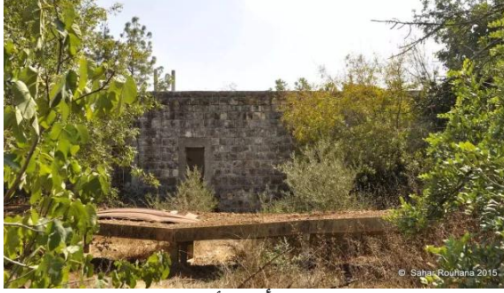
الرأس الأحمر: جولة بين بيوت قرية الرأس الأحمر المهجرة - تصوير سحر روحانا