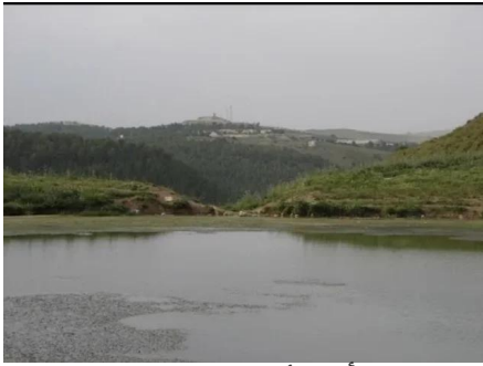
الرأس الأحمر: بركه القرية