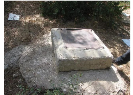
الرأس الأحمر: بئر في القرية