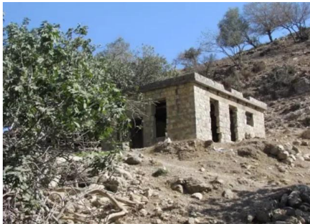
الرأس الأحمر: بقايا بيت قديم على اطراف القرية