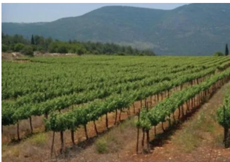
الرأس الأحمر: اراضي القرية