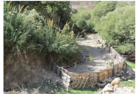
الرأس الأحمر: وديان القرية