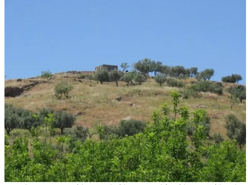
دلاته: مقام الشيخ البطاح من الناحية الجنوبية , اخر ما بقي من مباني القرية