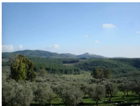
دلاتة: زيتون قرية دلاته