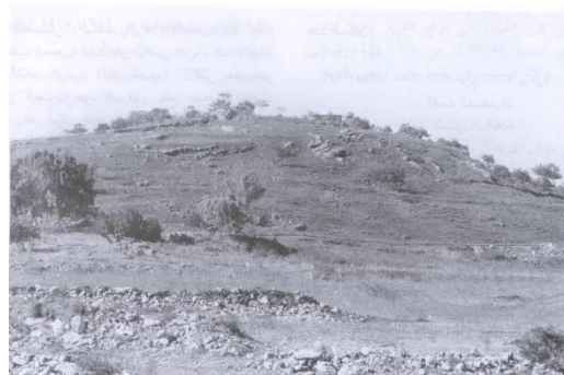
موقع القرية (آب/أغسطس ١٩٨٧) [دلاتة]