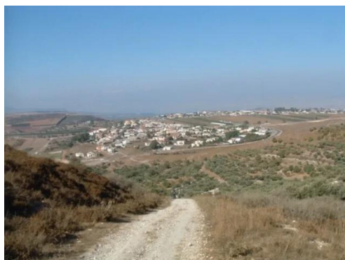
دلاتة: منظر من شرق القرية وتظهر المستوطنة المقامه على اراضيها