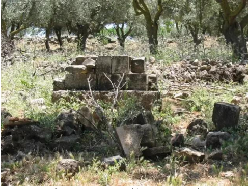
دلاته: مقبرة القرية - 6/2003