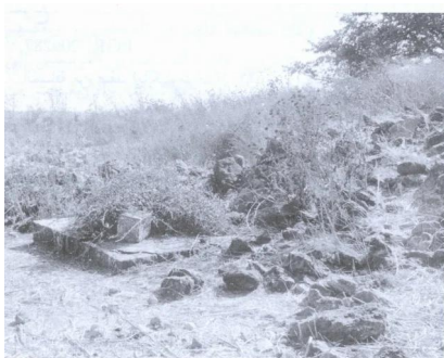
بقايا أحد أبنية القرية (آب/أغسطس ١٩٨٧) [دلاتة]