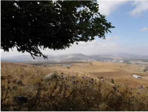
دلاته: موقع من جنوب القرية