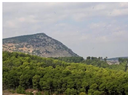
دلاتة: منظر من شرق القرية