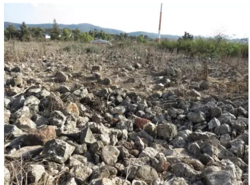
دلاته: انقاض القرية المدمرة