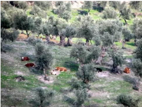
دلاته: اشجار الزيتون والتين الباقية في القرية - 6/2003