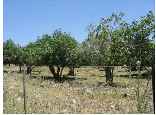
دلاته: اشجار الزيتون والتين الباقية في القرية - 6/2003