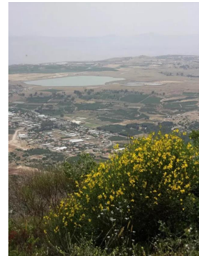
قرية دلاته المهجرة