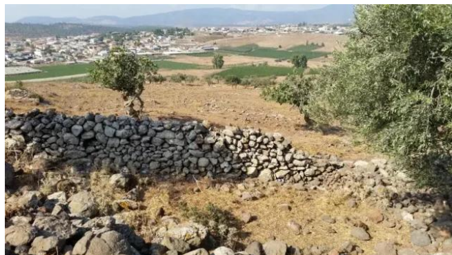
دلاتة: انقاض القرية المدمرة