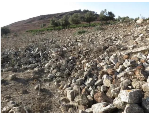
دلاته: انقاض القرية المدمرة