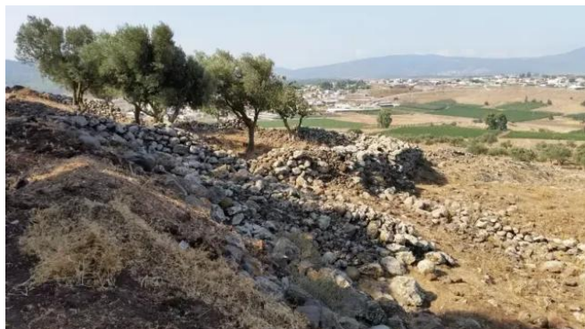
قرية دلاته المهجرة