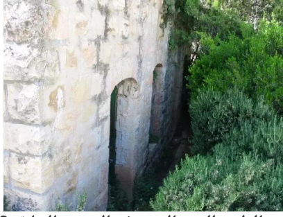
سعسع: الجزء العلوي للبيت المبين في الصورة السابقة 14/5/2003