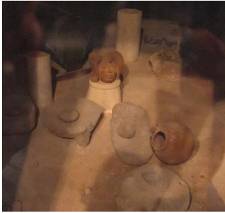
سعسع: مجموعة اثريات وجدت سعسع عام تعود للعصر البرونزي, معروضة في بيت من بيوت سعسع تم تحويله الى متحف - 1/6/2003