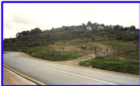
سعسع: منظر عام. 2000