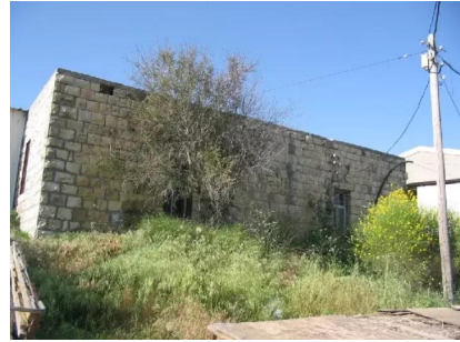
سعسع: احد بيوت القرية الموجود في الناحية الجنوبية قرب مدخل القرية