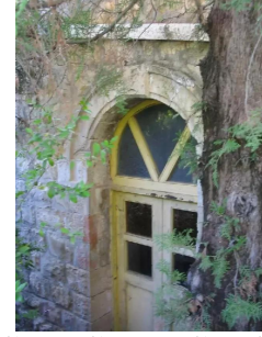
سعسع: الجزء العلوي للبيت المبين في الصورة السابقة - مدخل مخفي وغير مستعمل 14/5/2003