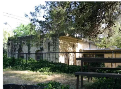
سعسع: احد بيوت القرية الذي تم تحويله الى مقصف للمستوطنة المقامة على اراضي القرية 14/5/2003