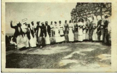
سعسع: صور للسامر في القرية قبل النكبة #2