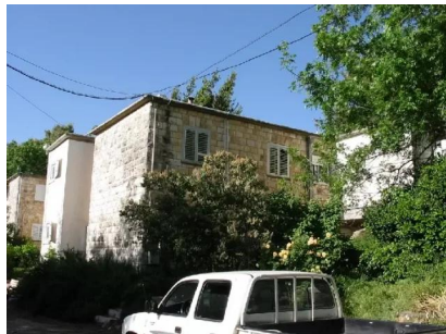
سعسع: احد بيوت القرية والمستعمل من قبل المستوطنين في سعسع 14/5/2003