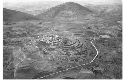
قرية سعسع المهجرة قضاء صفد