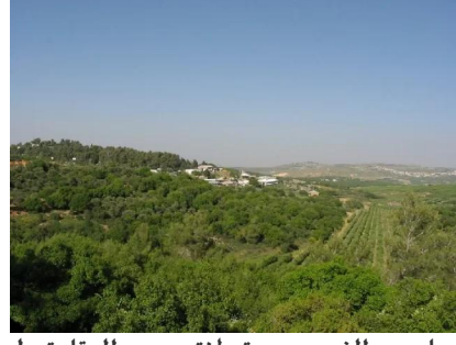
سعسع: منظر عام من الغرب , مستوطنة سعسع المقامة على موقع القرية 14/5/2003