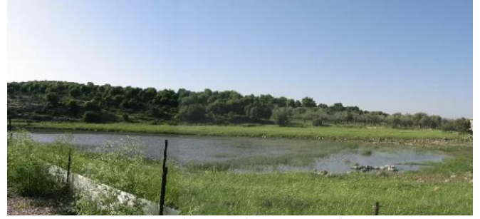
سعسع: بركة سعسع شمالي موقع القرية 14/5/2003