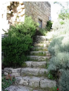
سعسع: مطع سلالم الى جانب البيت المبين في الصورة السابقة 14/5/2003