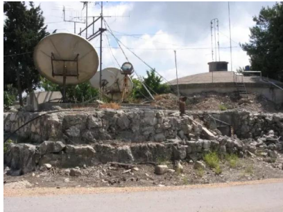
سعسع: موقع الجامع في قمة التلة المقامة عليها القرية , تحول اليوم الى خزان للماء بعد هدم الجامع - 1/6/2003