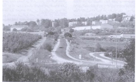
سبعسع (إسرائيلية) في موقع القرية (سنة ١٩٩٠) [سعسع]

سعسع: إحدى البيوت المقتنصة في الطرف الغربي من القرية. 1991