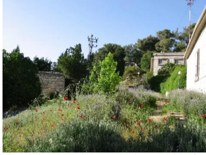
سعسع: المستوطنة المقامة على اراضي القرية, منظر داخلي 14/5/2003