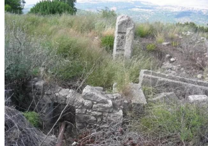
سعسع: أثار بيوت هدمت في القرية في الجهة العليا الى جانب الجامع - 1