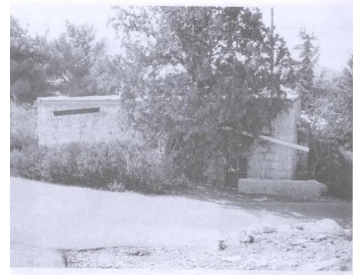
مزل من منازل القرية (سنة ١٩٩٠) [سعسع]

سعسع: صورة نادرة في القرية بعد إحتلالها ويبدو بعض الدمار. 1949