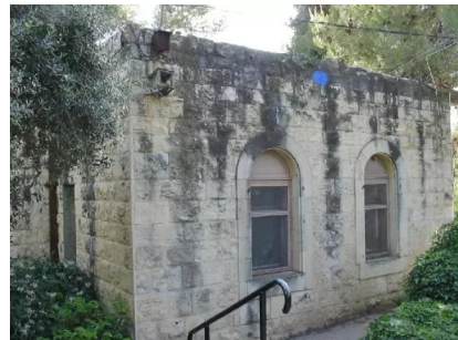
سعسع: احد بيوت القرية الذي تم تحويله الى مقصف للمستوطنة المقامة على اراضي القرية 14/5/2003