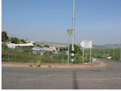
سعسع: مدخل القرية , من الجهة الغربية 14/5/2003