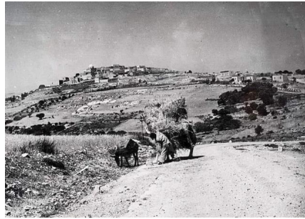
سعسع: قرية سعسع عام 1935