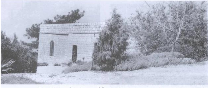
مزل قديم من منازل القرية في الطرف الغربي من الموقع، وتقيم فيه حالياً أسرة يهودية (تيسان/أبريل ١٩٩١) [سعسع]

سعسع: إحدى البيوت المقتنصة في الطرف الغربي من القرية. 1991