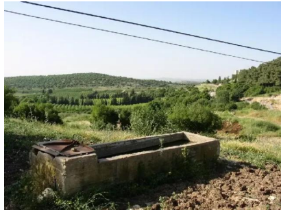
سعسع: اراضي القرية من الناحية الغربية بالقرب من مدخل المستوطنة المقامة على اراضي القرية 14/5/2003