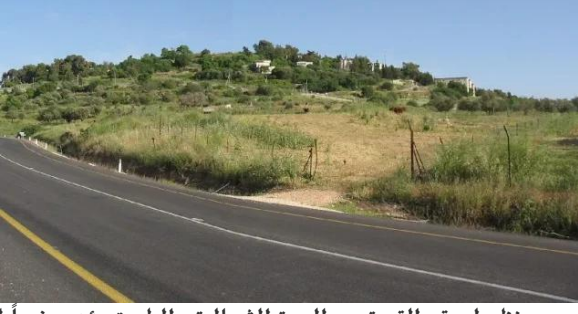
سعسع: منظر لموقع القرية من الجهة الشمالية , الطريق يؤدي غرباً إلى البصة, يظهر موقع القرية على تلة 14/5/2003