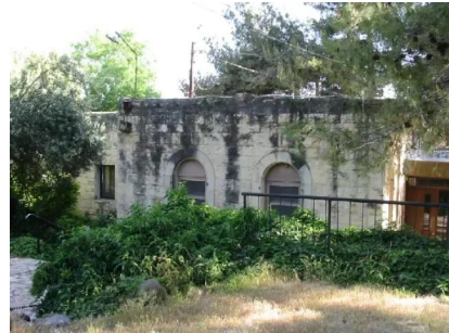
سعسع: احد بيوت القرية الذي تم تحويله الى مقصف للمستوطنة المقامة على اراضي القرية 14/5/2003