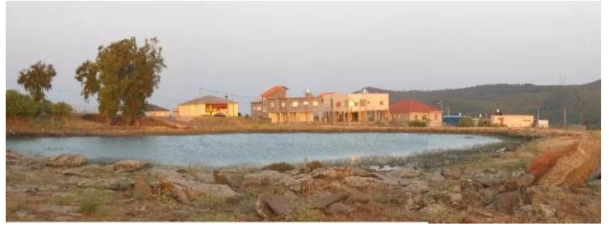
ركة طيطبا الى الشمال من موقع القرية, على الطريق المؤدي الى دلانة