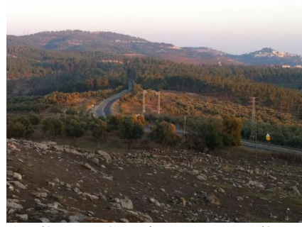
لطريق العام 886 المؤدي الى صغد و مستوطنة بجانب عين الزيتون في الجنوب الشرقي يمر من وسط القرية