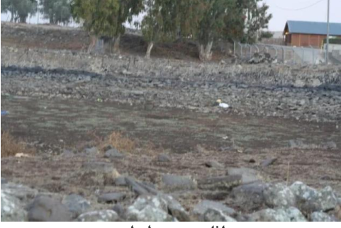
أثار بيوت طيطبه