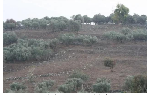
طيطبا: موقع قرية طيطبا