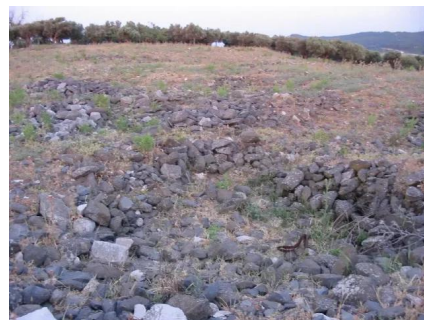
طيطبا: احجار من بيوت القرية في الجهة الشمالية