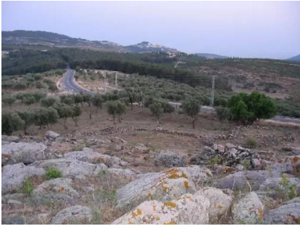
طيطبا: الطريق العام المؤدي الى صغد من الناحية الجنوبية