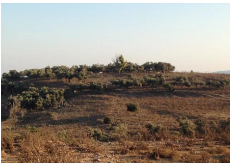
قرية طيطبا المهجرة