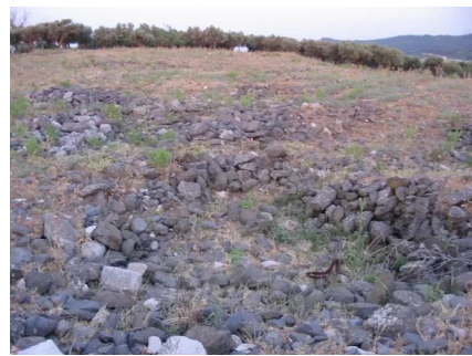
طيطبا: احجار من بيوت القرية في الجهة الشمالية