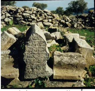
أحد القبور في قرية طيطبة