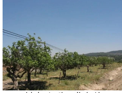
أشجار التين باقية في طيطبا