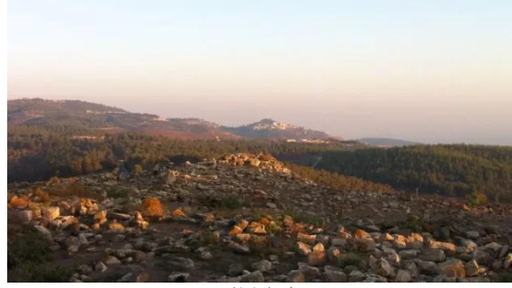
قرية طيطبا المهجرة