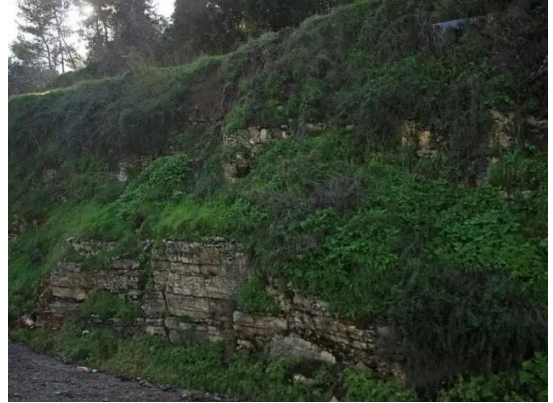
غباطية: آثار بيوت القرية