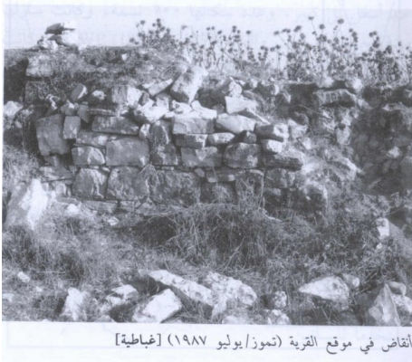
أنقاض في موقع القرية (تموز/ يوليو ١٩٨٧) [غباطية]