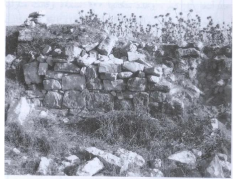
أنقاض في موقع القرية (تموز/ يوليو ١٩٨٧) [غباطية]