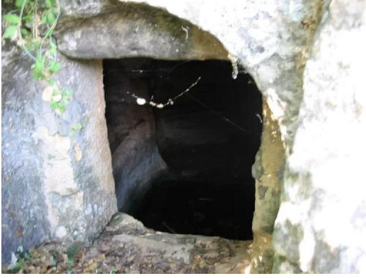
غباطية: مدخل لقبور قديمة محفورة في الصخر غربي القرية#2 - 1/6/2003