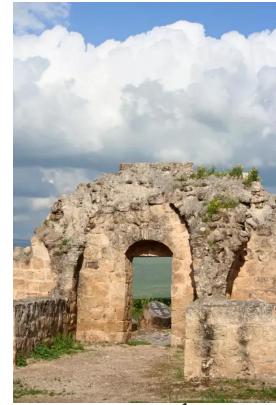
ياردا: أنقاض الخان