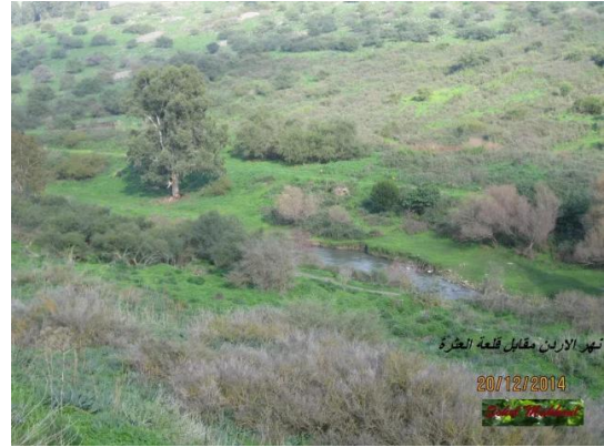
نهر الاردن مقابل قلعة العثرة