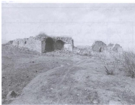
بقايا الخان الذي كان في القرية (آب/أغسطس ١٩٨٧) [يردا]