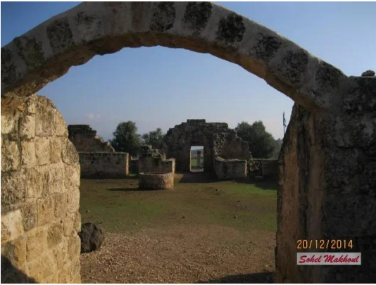
ياردا: مدخل الخان الذي أصبح موقع سياحي