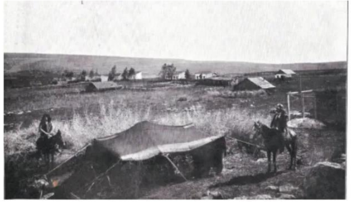
يارداء: قرية يارداء قبل النكبة