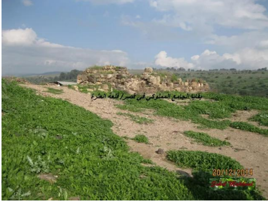
بقايا الجامع المملوكي في قصر / قلعة العثرة