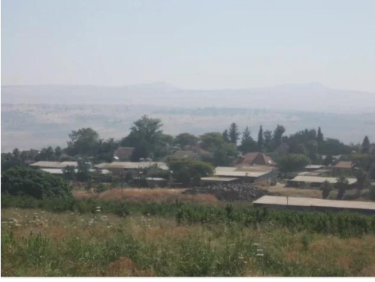
يارداء: من موقع القرية باتجاه المستوطنه المقامه على اراضيها