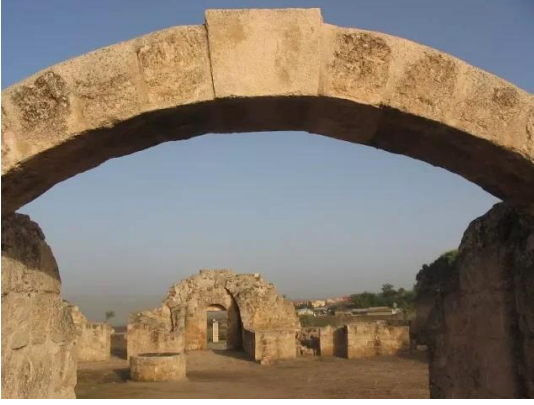
ياردا: مدخل الخان الذي أصبح موقع سياحي