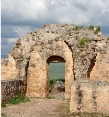
ياردا: خان ياردا ياردا: مدخل الخان الذي اصبح موقع سياحي