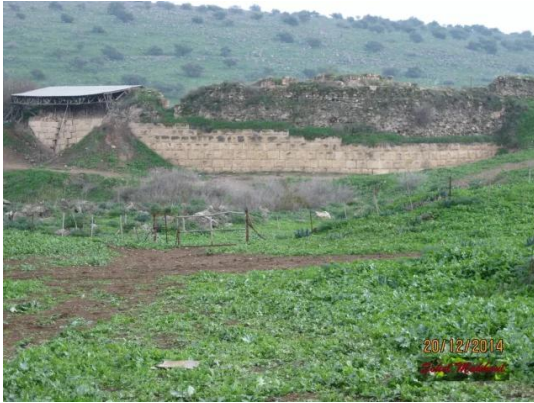
قرية ياردا المهجرة