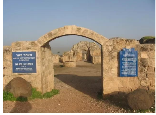
ياردا: مدخل الخان الذي أصبح موقع سياحي