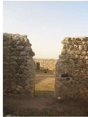
ياردا: خان يردا مناظر داخلية