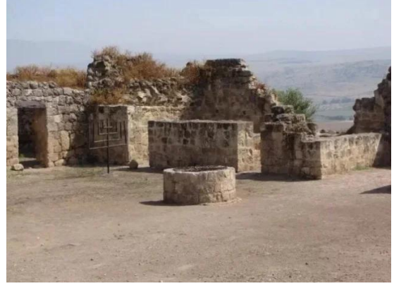
يارداء: اثار القرية