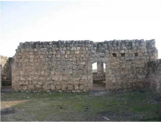
قرية ياردا المهجرة