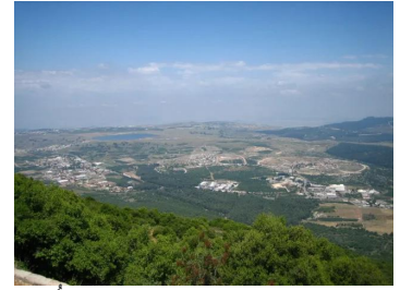
صفصاف: منظر عام جميل لموقع القرية أخذ من قاعدة جيش الإحتلال الاسرائيلي الموجودة على قمة جبل ميرون وتظهر قرية الجش وبركتها.