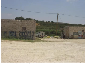
صفصاف: بيوت باقية من بيوت قرية الصفصاف - 2003 ربيع