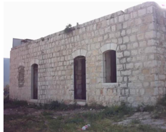
صفصاف: مبنى قديم في مدخل القرية , موجود الى يمين شارع صفا المتوجه الى قرية الجش