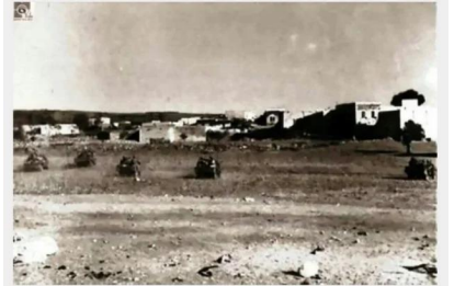
صفصاف: صورته قديمه ليوم احتلال قريه الصفصاف