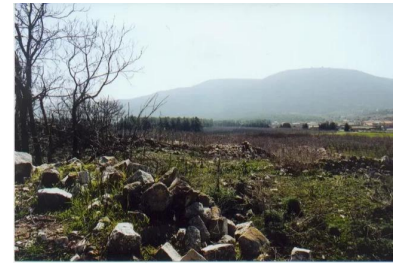
صفصاف: منظر عام لاراضي القرية ويظهر بعض بيوت القرية