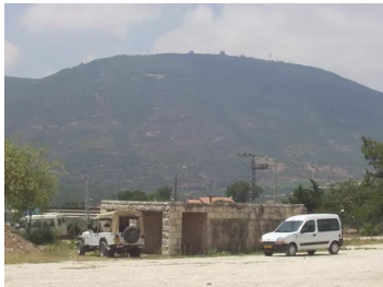
صفصاف: منظر لجبل ميرون وتظهر قاعدة جيش الإحتلال الاسرائيلي على قمة الجبل.