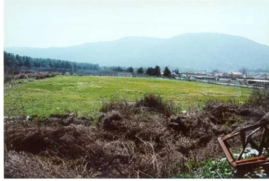
صفصاف: منظر عام لاراضي القرية ويظهر جبل الجرمق