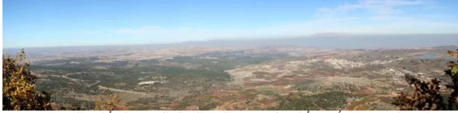
صفصاف: منظر عريض رائع أخذ من أعلى جبل ميرون في الإتجاه الشمالي الشرقي وتظهر أراضي الصفصاف، جيش، وبركة الجش لليسان، أنقر الصورة لتكبيرها