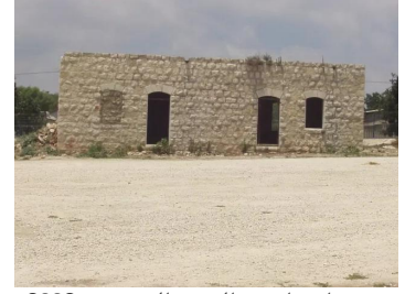
صفصاف: احدى البيوت المقتصة. 2002