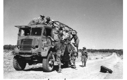
صفصاف: صورة نادرة أخذت أثناء الهجوم الاخير. 1948