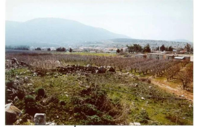
صفصاف: منظر لجبل الجرمق أخذ من فوق اطلال الصفصاف. 1999