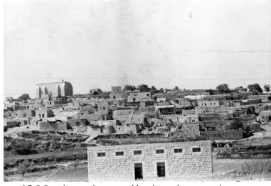
صفصاف: منظر عام للصفصاف عام 1938