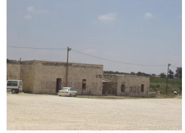
قرية صفصاف المهجرة