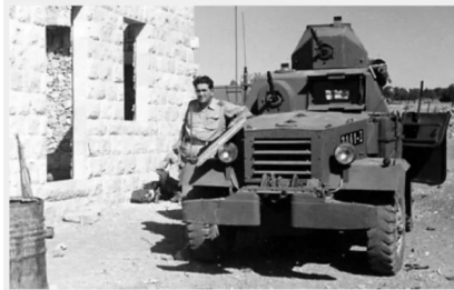
صفصاف: العصابات الصهيونية في الصفصاف