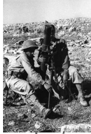
صفصاف: صورة نادرة أخذت أثناء الهجوم الاخير. 1948