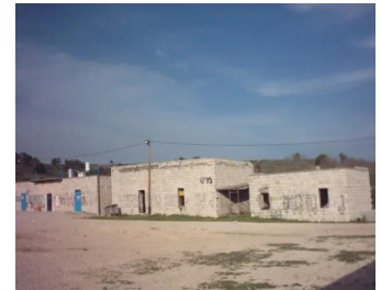
صفصاف: بيوت مقتصة. 2002