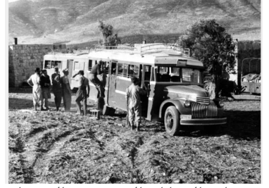
صفصاف: العصابات الصهيونية في الصفصاف