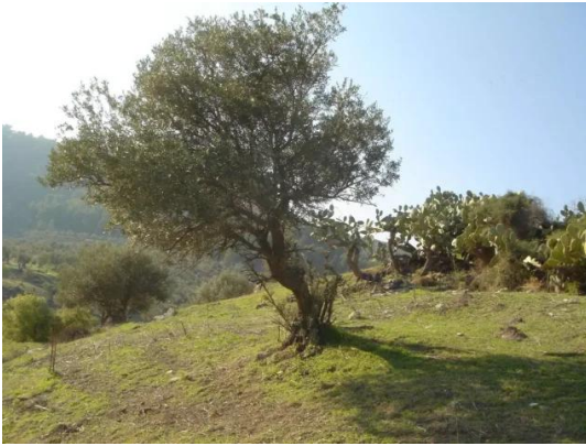
قباعة: شجرة الزيتون الصامدة.