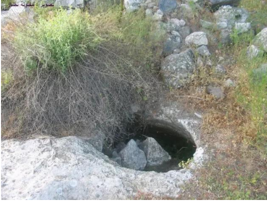
قباعة: مغر و ابار بجانب موقع القرية - 16.4.2005