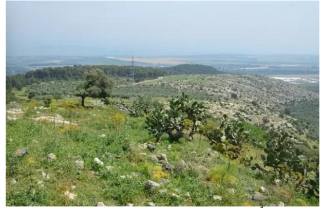
قباة: أطلال بيوت القرية المدمرة وتظهر كروم الزيتون.