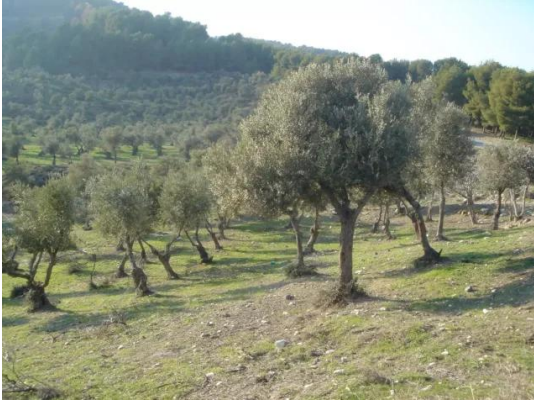
قباة: منظر عام لاراضي القرية المغتصبة وتظهر كروم الزيتون