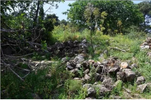
قباة: اثار بيوت القرية