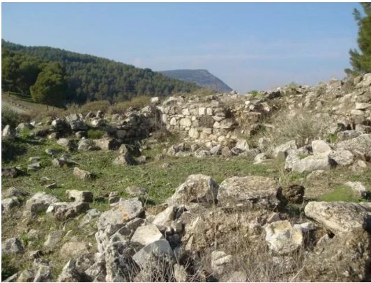
قباعة: اثار بيوت القرية