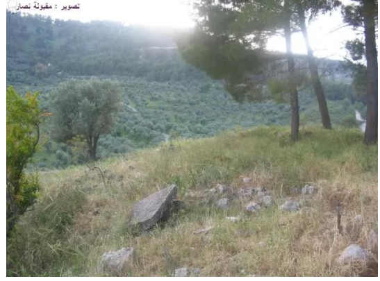
قباعة: الاثار الباقية من بيوت القرية - 16.4.2005