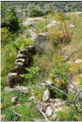
قباة: اثار لبيت مهدم في القباة