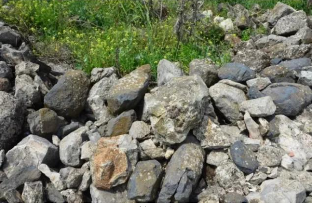
قرية قباة المهجرة