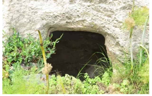
قباة: مغر القريه