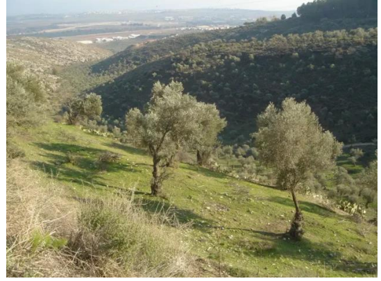
قرية قباة المهجرة