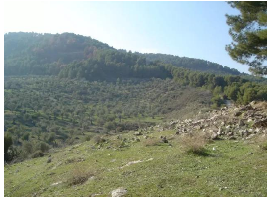
قرية قباعة المهجرة