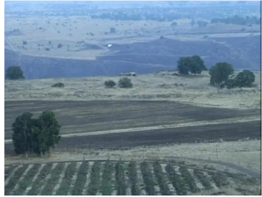
منصورة الخيط: موقع القرية