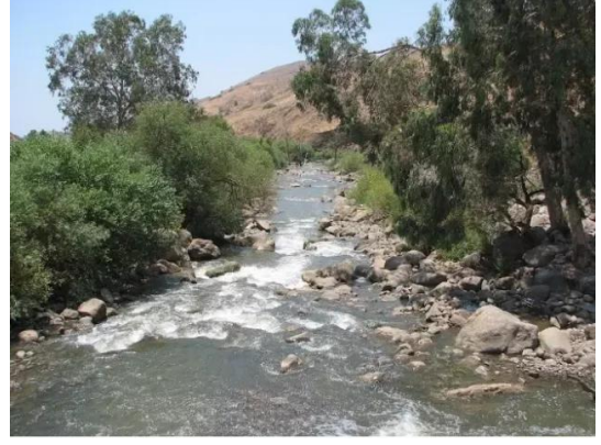
منصورة الخيط: نهر الاردن من الشرق للقرية