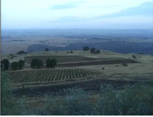
منصورة الخيط: موقع القرية بين الاشجار ومن الشرق هضبه الجولان