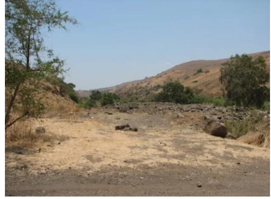
منصورة الخيط: موقع من شرق القرية