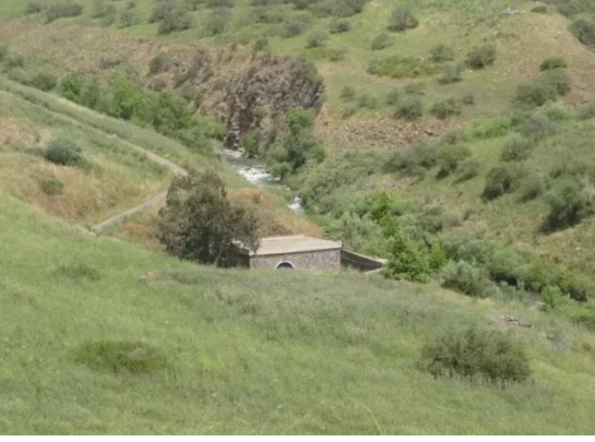
منصورة الخيط: نهر الاردن بالقرب من القرية