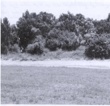
منظر لموقع القرية كما يبدو للناظر إليه من جهة الجنوب الشرقي (تموز) يوليو 1987 [منصورة الخيط]