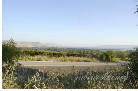
البطيحه: اطلاله على بحيره طبريا والجولان من موقع القرية