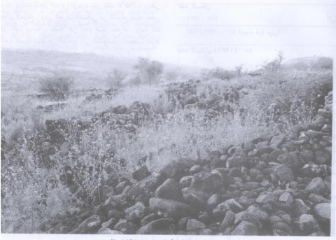
منظر إلى الشمال الغربي من الطرف الجنوبي للوحد القوية (أيار/مايو ١٩٩٠) [البطيحة]

البطيحة: منظر لموقع القرية التي دمرها الصهاينة وطهروا سكانها عراقي