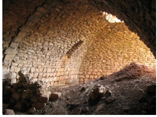
جب يوسف: غرف داخلية