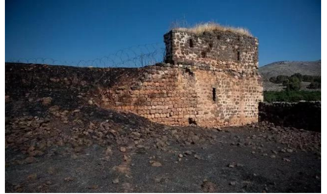
جب يوسف: خان القرية