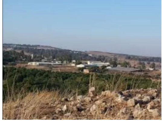
جب يوسف: موقع القرية