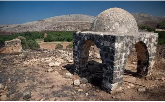
جب يوسف: بئر يوسف