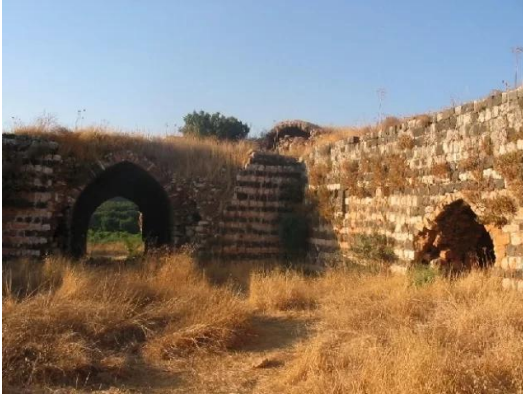
جب يوسف: الساحة الداخلية للخان