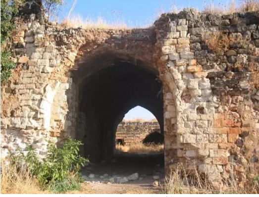
جب يوسف: الخان في قرية الجب يوسف