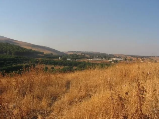
جب يوسف: أراضي القرية . من الجهة الشمالية والتي أقيم عليها مستوطنة عميعاد