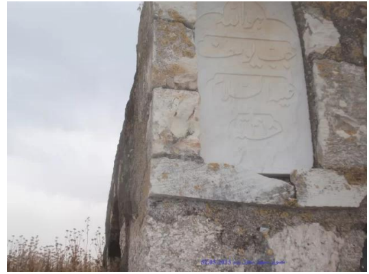
جب يوسف: لوحة الرخام على جب يوسف