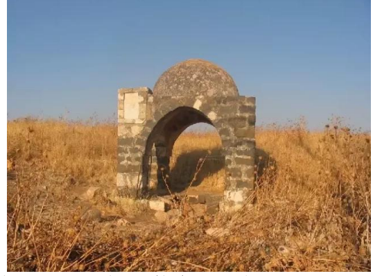
جب يوسف: بئر ماء , تحمل القرية اسمه ويعتقد انه البئر الذي القي به النبي يوسف