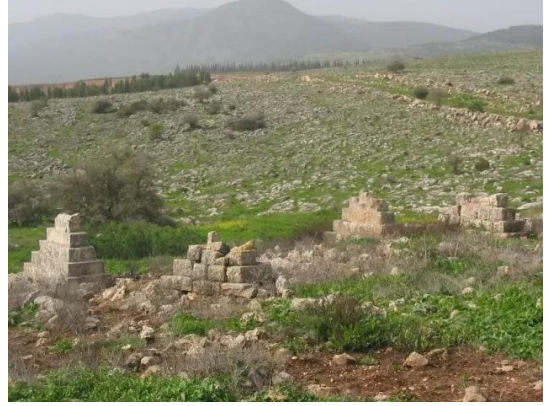
القديرية: 18.2.2005 مقبرة القرية ،