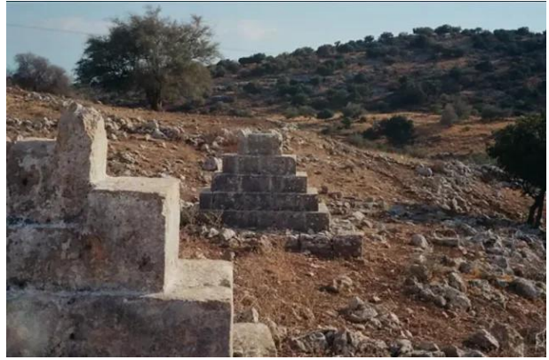
القديرية: مقبره القرية