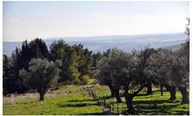
القديرية: مقبرة القرية من الناحية الغربية - تصوير مقبولة نصار - 5.4.08