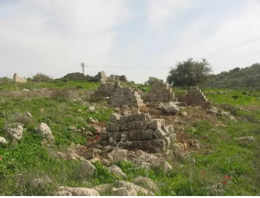
القديرية: 18.2.2005 مقبرة القرية, يظهر بيت المختار شرقي المقبرة