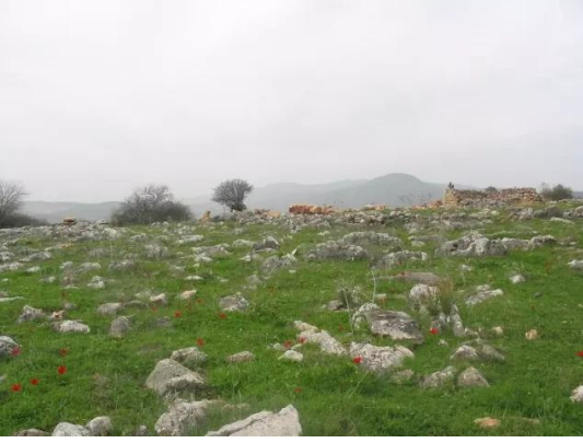
القديرية: 18.2.2005 منظر عام للقرية والاثار الباقية ،