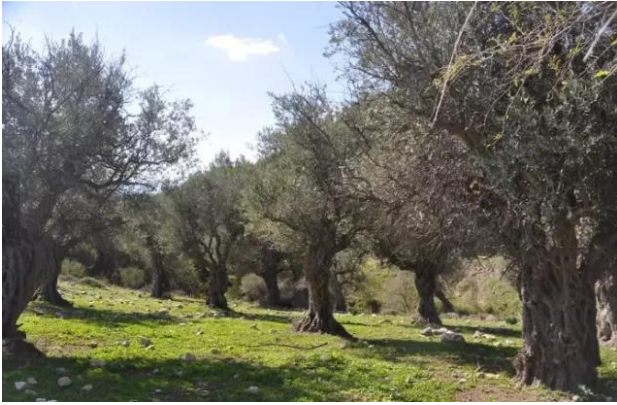
القديرية: زيتون القرية من الغرب