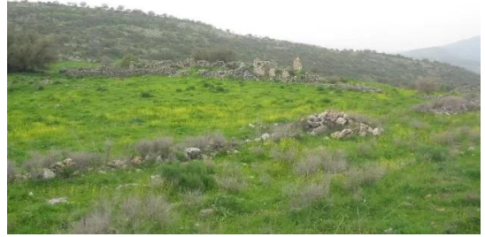
القديرية: 18.2.2005 منظر عام للقرية والآثار الباقية