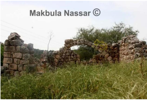
القديرية: آثار بيت المختار - 5.4.08