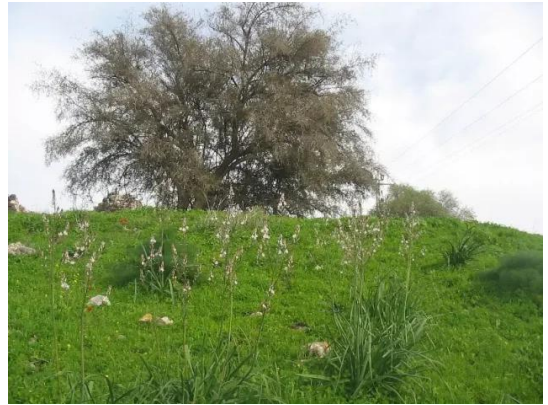
القديرية: 18.2.2005 الطبيعة الفلسطينية, نباتات من القرية ،