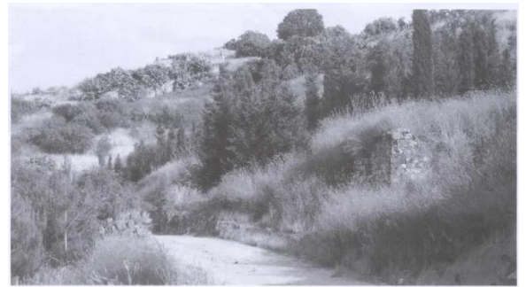
موقع القرية المتفرد كما يبدو للناظر إليه من جهة الشمال الغربي. وقد غلبت عليه أشجار السرو والزيتون ونبات الصبار التي تنتشر بينها بقايا حيطان المنازل (أيار/ مايو ١٩٨٧) (يعقوب)