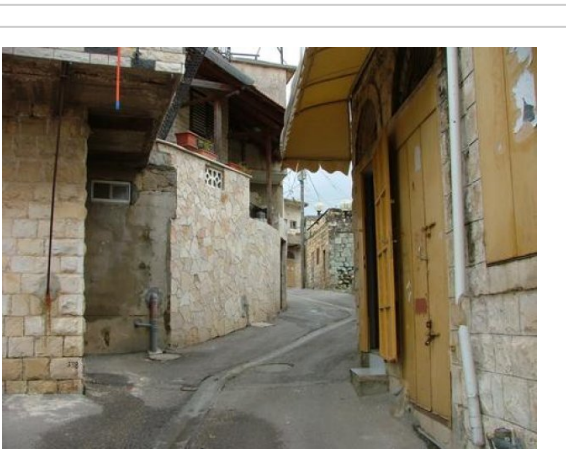
شوارع ترشيحا وأزقتها