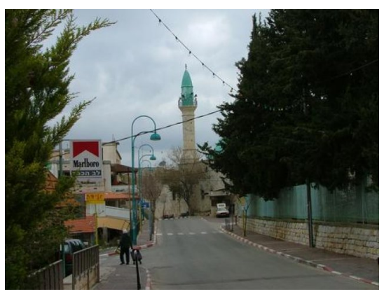
ترشيحا: المسجد الجديد