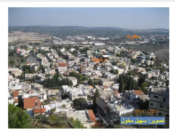
ترشيحا: ترشيحا ومعلوت _ منظر عام