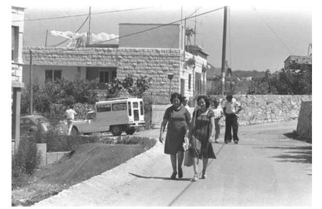
ترشيحا: منظر لشارع في ترشيحا عام 1978