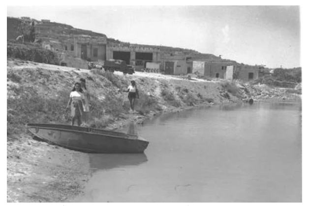
ترشيحا: صورة نادة لمغتصبين صهاينة يسكنون بيوت اللاجئين الفلسطنين بعد تطهيرهم عرقياً