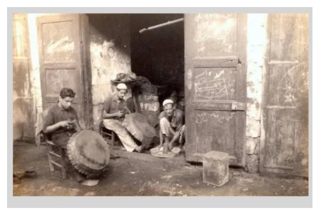
ترشيحا: صوره من ترشيحا سنه 1938