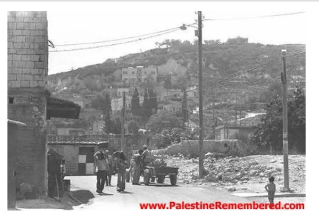
ترشيحا: منظر عام 1976