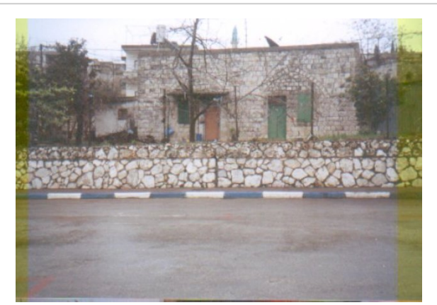
قرية ترشيحا المهجرة