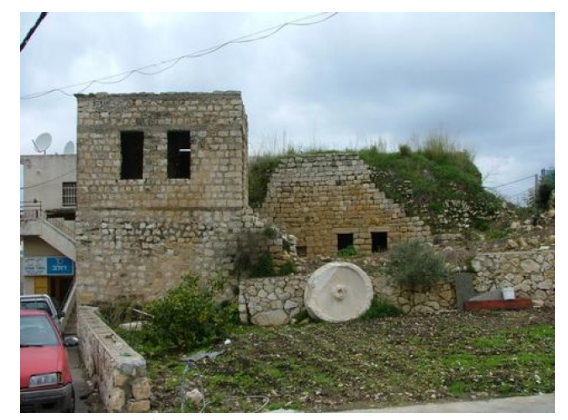
بيوت فديمة في قرية ترشيحا المهجرة