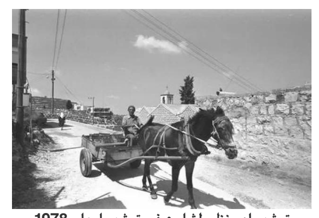
ترشيحا: منظر لشارع في ترشيحا عام 1978