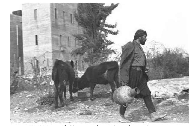
ترشيحا: مركز الشرطة بعد النكبة-1949