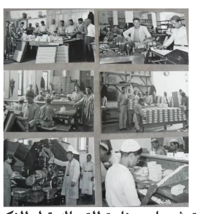
ترشيحا: صناعة التمباك قبل النكبة