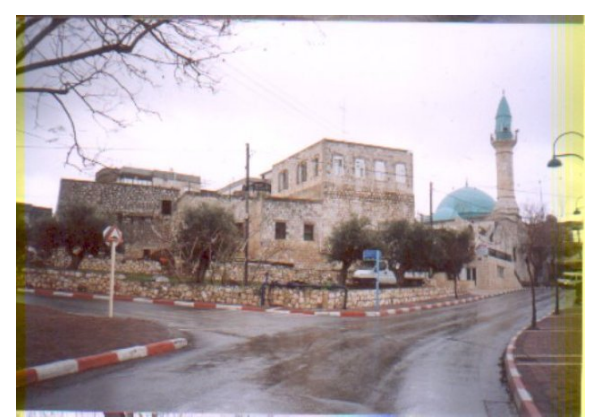
قرية ترشيحا المهجرة