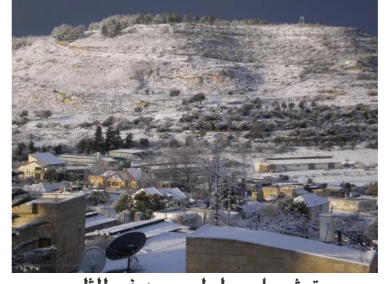
ترشيحا: جبل ابو سعد في الثلج