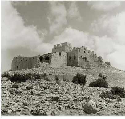
خربة جدين: صورة ساحرة لقلعة جدين بالقرب من عكا عام 1933.. هذه القلعة بناها ظاهر العمر عام 1750 على أنقاض قلعة صليبية..