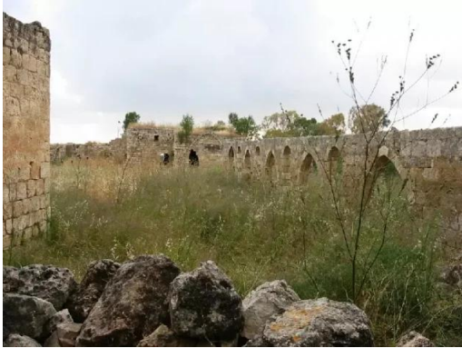
خربة جدين: قناطر السور الشمالي, 30/5/2003