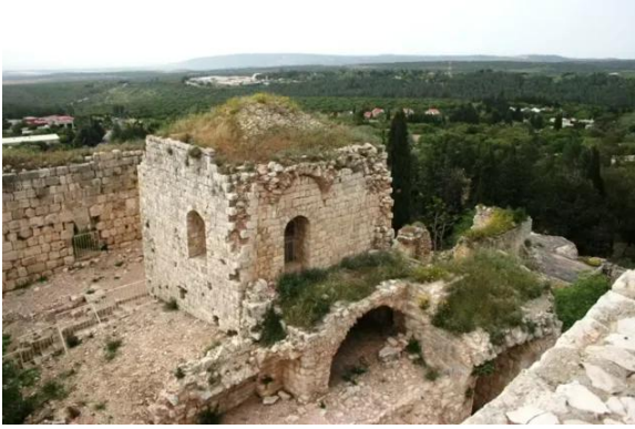
خربة جدين: قلعة جدين - 22/4/2006