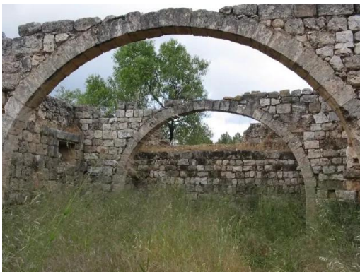
خربة جدين: غرف وقناطر في الناحية الشمالية للقلعة, 30/5/2003