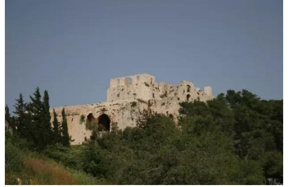
خربة جدين: قلعة جدين - 22/4/2006