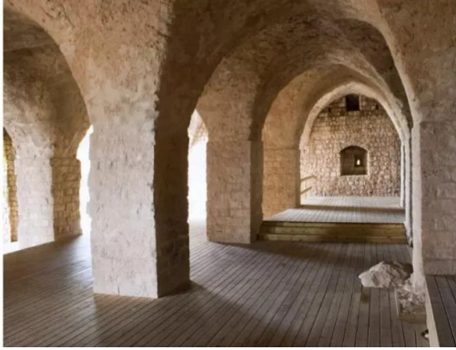
خربة جدين: المبنى السابق من الداخل , 30/5/2003