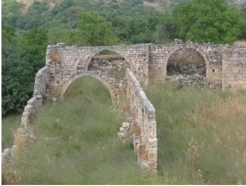
خربة جدين: قناطر رائعة على السور الشمالي للقلعة#2, 30/5/2003