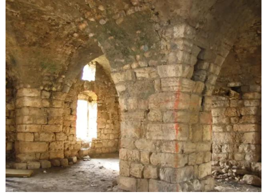
خربة جدين: خربه جدين