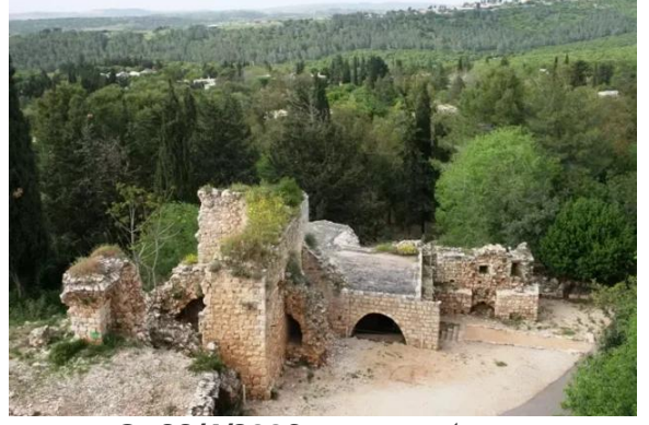
خربة جدين: قلعة جدين - 22/4/2006