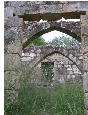
خربة جدين: غرف وقناطر في الناحية الشمالية للقلعة, 30/5/2003