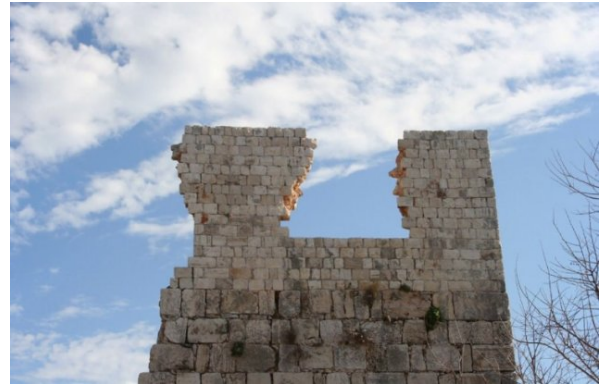
خربة جدين: خربه جدين