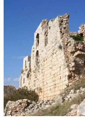
خربة جدين: خربه جدين