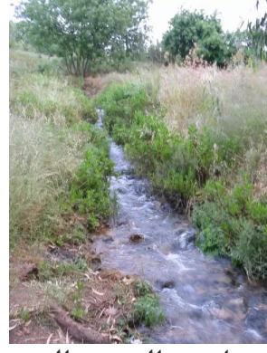
خربة جدين: مياه نهر الجعتون التي تجري بجانب القلعة