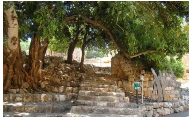
خربة جدين: خربه جدين