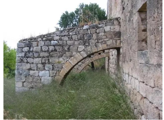
خربة جدين: السور الجنوبي للقلعة , 30/5/2003