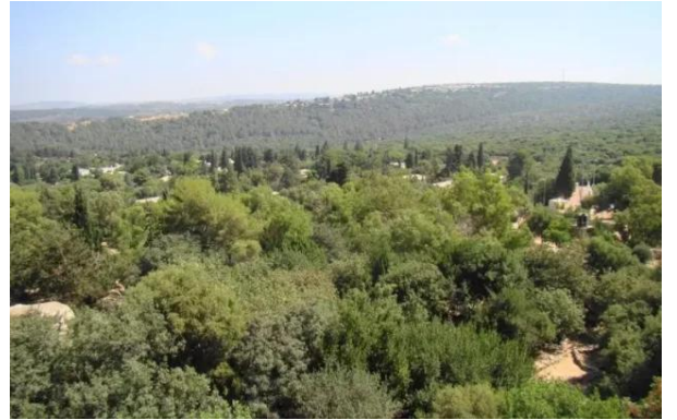
خربة جدين: خربه جدين