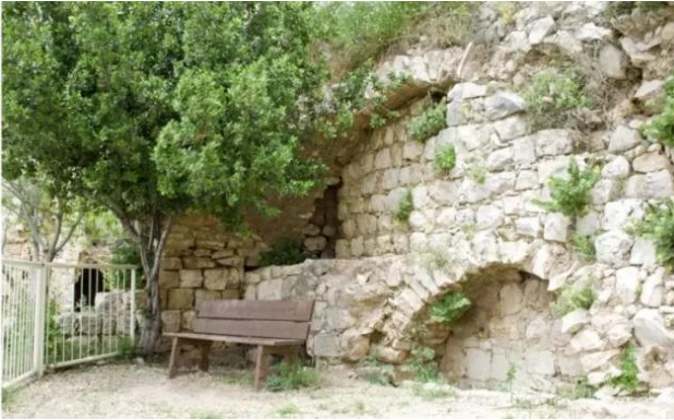
خربة جدين: خربه جدين