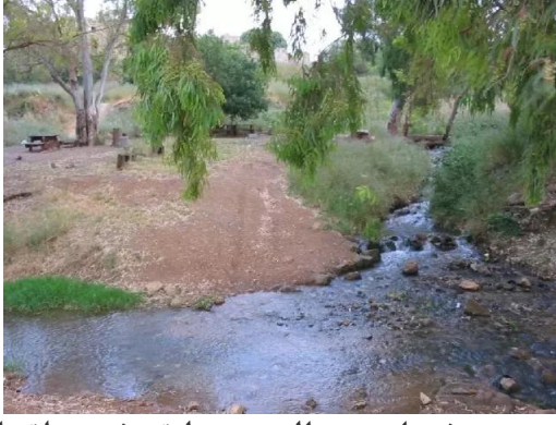
خربة جدين: تفرعات نهر الجعتون تلتقي في منطقة القلعة , تجري باتجاه الغرب الى البحر الابيض المتوسط , 30/5/2003