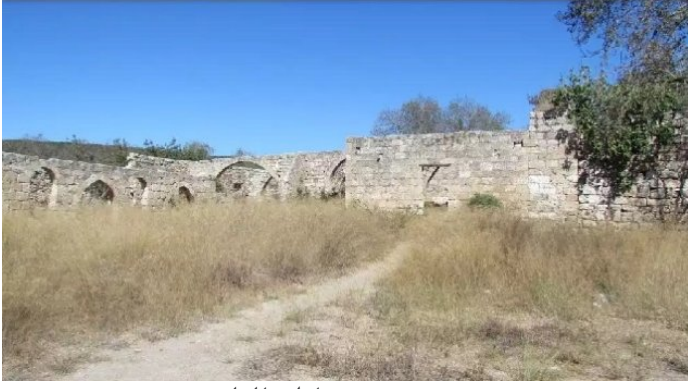
خربة جدين: قناطر القلعه