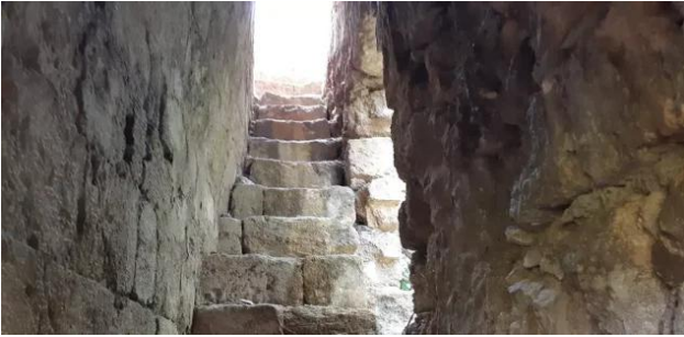
عمقا: زيارة بين انقاض قرية عمقا المهجرة