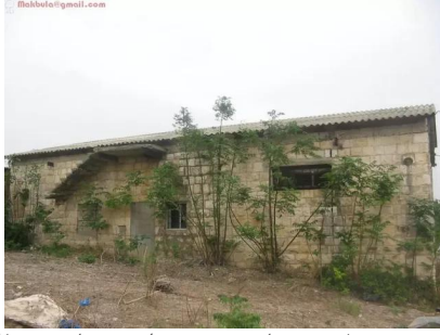
عمقا: بيوت قديمة في عمقا مستعملة في مستوطنة تحمل نفس الاسم