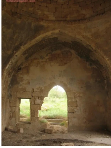
عمقا: مسجد عمقا