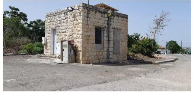
عمقا: زيارة بين انقاض قرية عمقا المهجرة