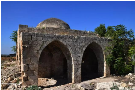
عمقا: جولة حديثه في قرية عمقا