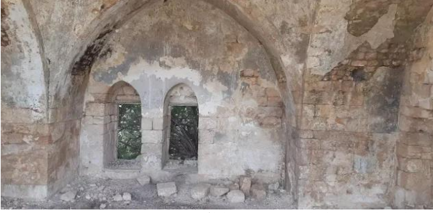
عمقا: زيارة بين انقاض قرية عمقا المهجرة