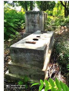
عمقا: جولة حديثه في قرية عمقا