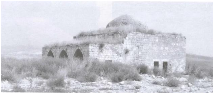
عمقا: مسجد القرية الحزين