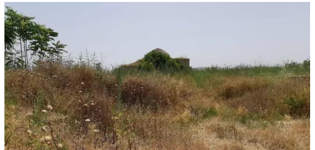
عمقا: زيارة بين انقاض قرية عمقا المهجرة