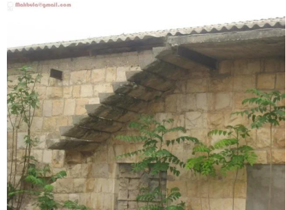
عمقا: بيوت قديمة في عمقا مستعملة في مستوطنة تحمل نفس الاسم