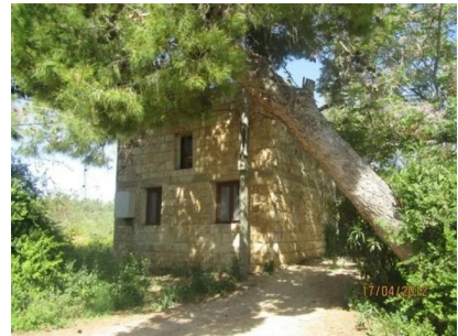
عمقا: أحد بيوت القرية المنهوبة