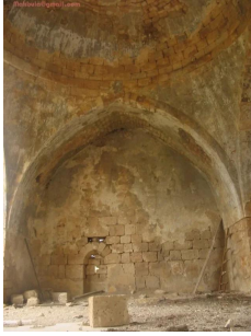
عمقا: مسجد عمقا من الداخل