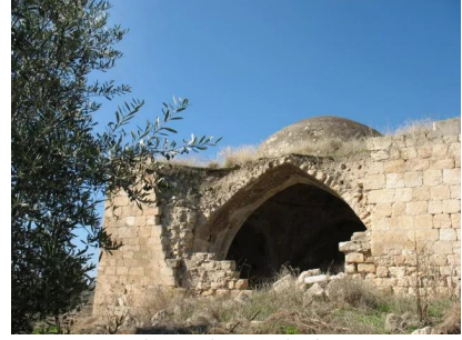
عمقا: منظر لجامع القرية المغتصب