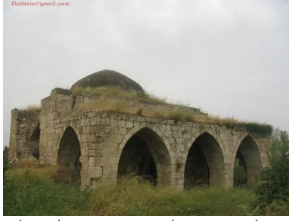
عمقا: مسجد عمقا - تصوير : مقبولة نصار