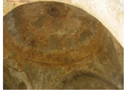
عمقا: مسجد عمقا من الداخل