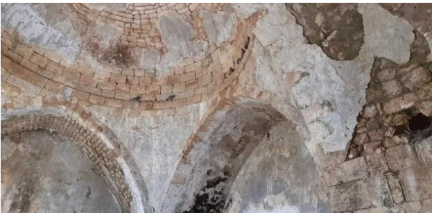
عمقا: زيارة بين انقاض قرية عمقا المهجرة