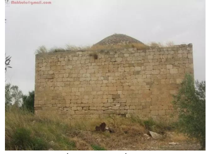
عمقا: مسجد عمقا