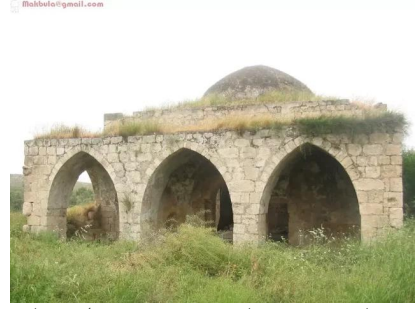
عمقا: مسجد عمقا