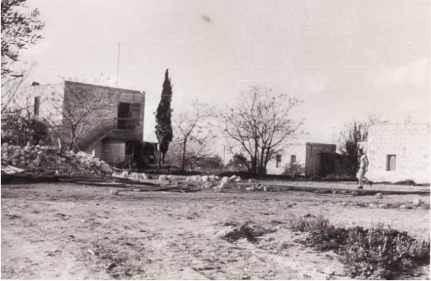
كويكات: كويكات سنوات ال 50