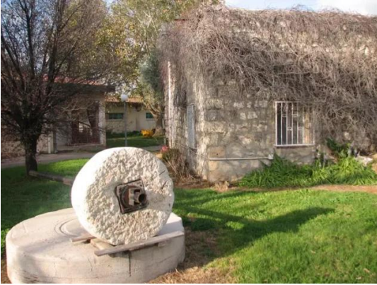
كويكات: احد البيوت القرية استعمل كمدرسة