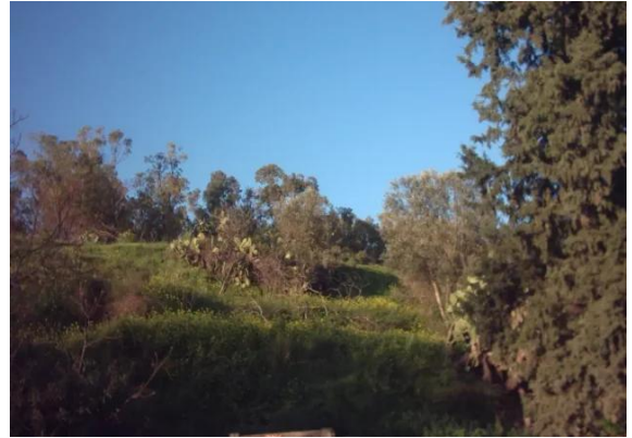
كويكات: اراضي القرية - 2003