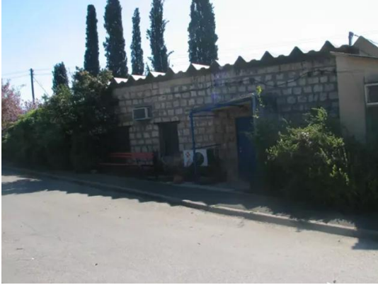
كويكات: احد بيوت القرية 3 2008