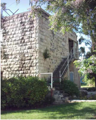
كويكات: البيت في الصورة السابقة , من جهة مختلفة