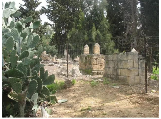
كويكات: مقبرة القرية #2