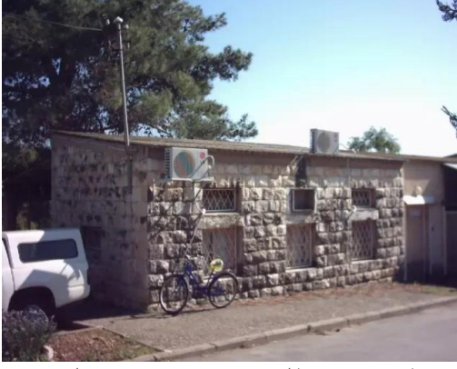
كويكات: احد بيوت القرية , من جهة مختلفة , مبين في صورة سابقة ومستعمل حالياً كدكان