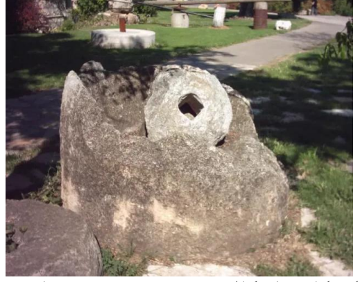
كويكات: اشكال حجرية , موجودة في احدى الساحات