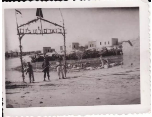
كويكات: كويكات 1949