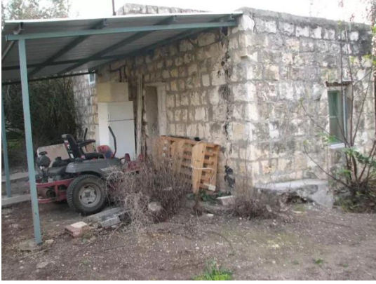
كويكات: احد بيوت القرية