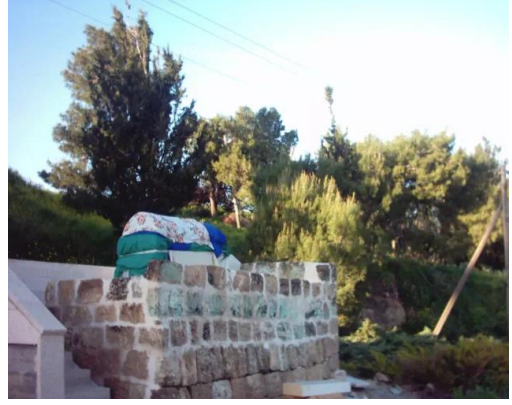
كويكات: مقام الشيخ محمد الكويكاني