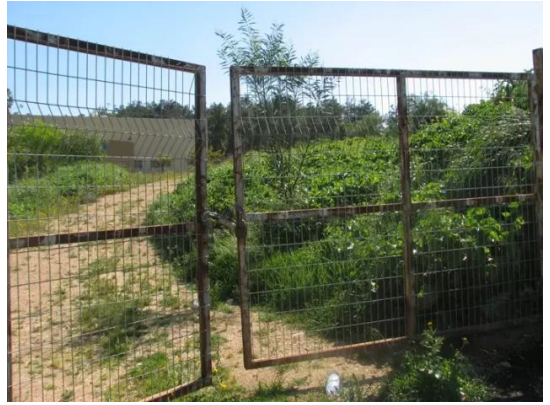
كويكات: طريق توصل الى الكويكات القديمة باتجاه القبرة