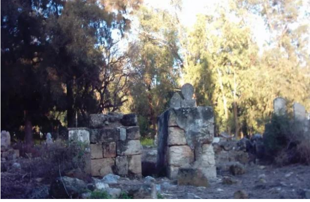
كويكات: مقبره القرية