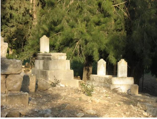
كويكات: مقبرة القرية