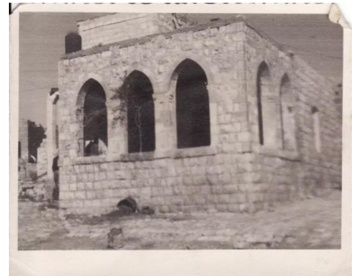
كويكات: كويكات سنوات ال 50