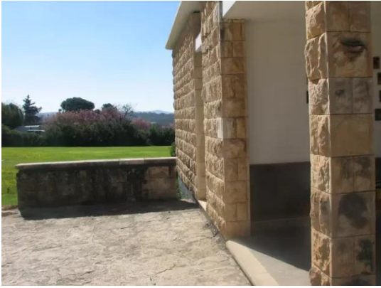
كويكات: بيت جديد بني من حجاره بيوت القرية