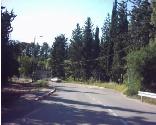
كويكات: عين ميماس تحولت الى محطة للموقود 3 2008