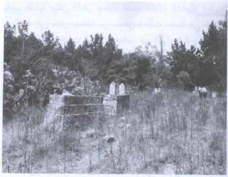
مقبرة القرية (حزيران/ يونيو ١٩٨٧) [كويكات]