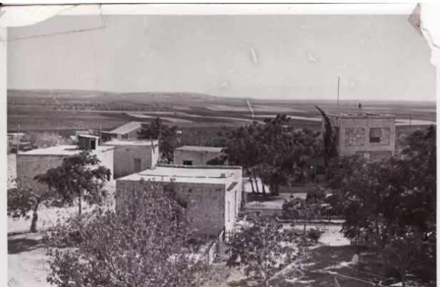
كويكات: كويكات سنوات ال 50