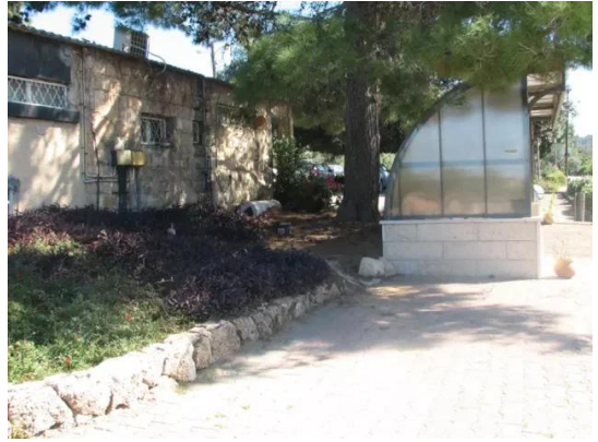
كويكات: احد بيوت القرية