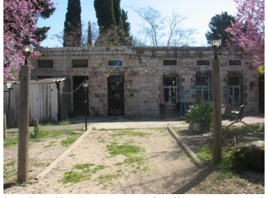
كويكات: مدرسة الكويكات تم تحويلها الى ملهى ليلي 2008 3