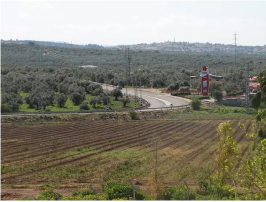
قرية كويكات المهجرة