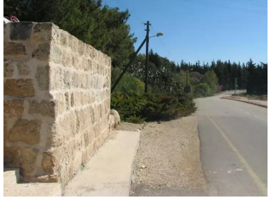
كويكات: ضريح الشيخ محمد الكويكاني