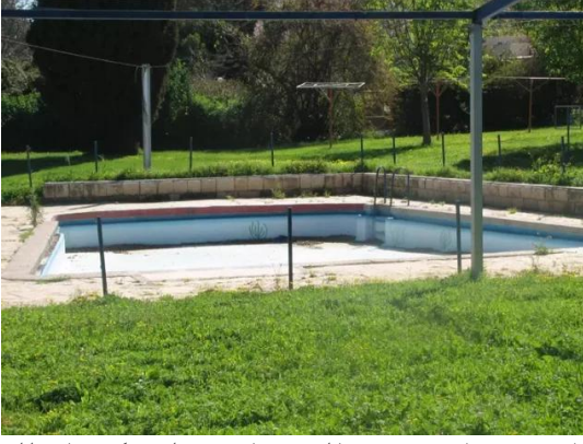
كويكات: حجارة بيوت القرية استعملت كجدار للمسبح القائم خلف المدرسة