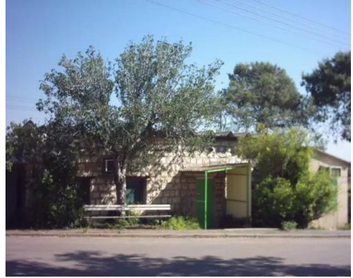
كويكات: احد بيوت القرية