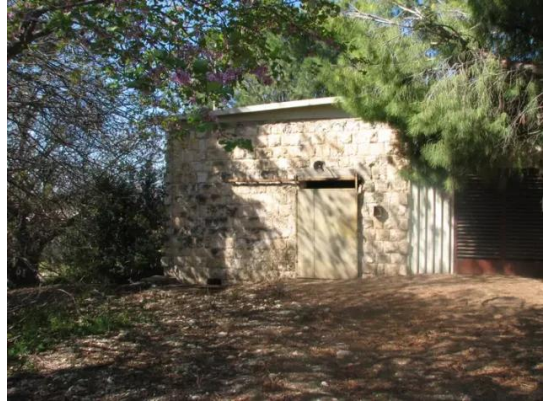
كويكات: احد البيوت غرب القرية (على اطراف القرية)