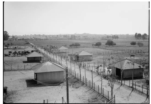
المنشيه: صورة من الدابويما في منشية عكا في 1940-4-23 تظهر عكا وعين المنشية في الخلفية