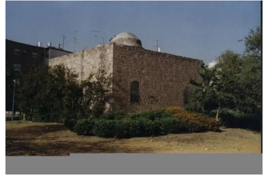
المنشيه: مسجد المنشية - 2002