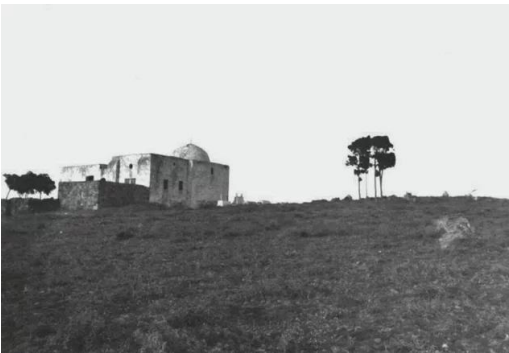
المنشيه: اقدم صورة لمصلى ومقام اوعتبه في منشية عكا كما تظهر ارض وقبور في المقبرة سنة 1928