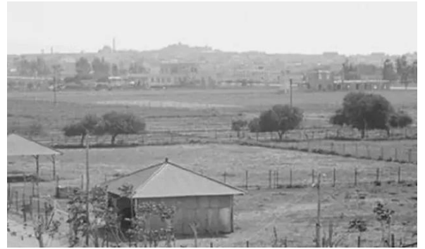
المنشيه: صورة للمنشية في عكا ويظهر معمل الكازوز سبينيس وارااضي ومنشآت الدابويما