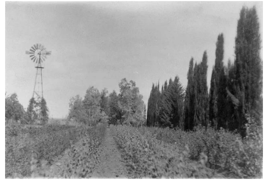
المنشيه: ارض الدبويما في منشية عكا سنة 1929