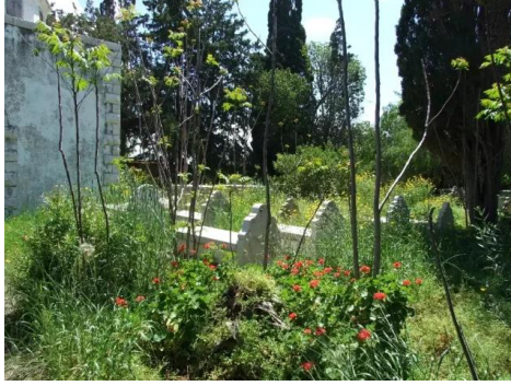
المنشيه: المقبرة البهائية في القرية