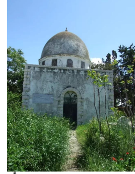
المنشيه: مقام محمد علي بهائي غصني أكبر ابن بهاء الله