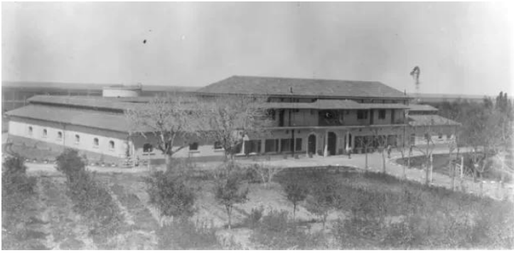
المنشيه: صورة لمركز الابحاث الزراعي دبويما في منشية عكا سنة 1932