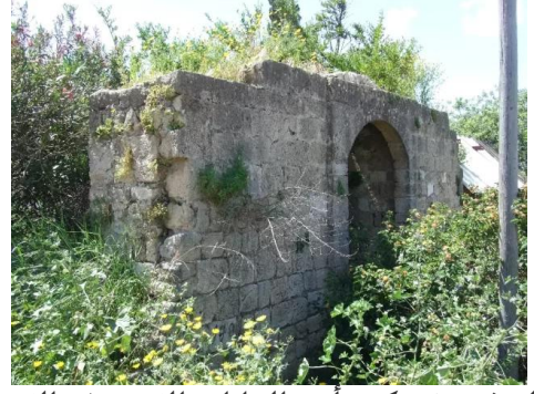
المنشيه: قد يكون أحد الخانات القديمة في القرية