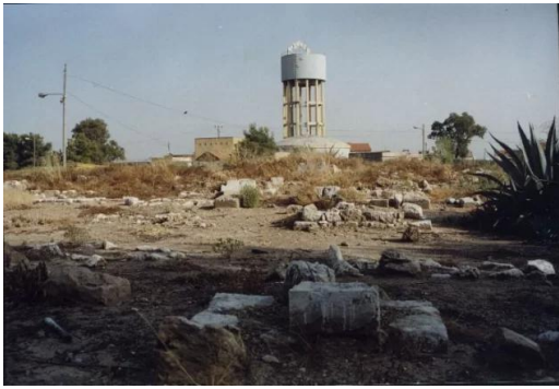
المنشيه: ما تبقى من مقبرة القرية - 2002