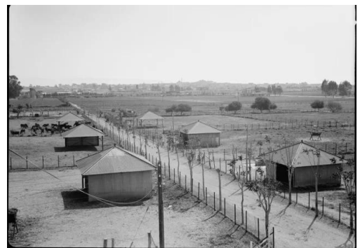
المنشيه: صورة من الدابويما في منشية عكا في 1940-4-23 تظهر عكا وعين المنشية في الخلفية