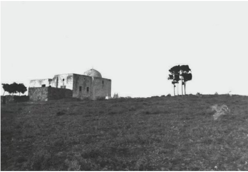
المنشيه: اقدم صورة لمصلى ومقام اوعتبه في منشية عكا كما تظهر ارض وقبور في المقبرة سنة 1928