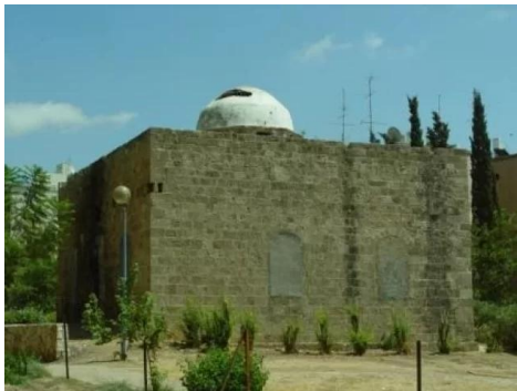
المنشيه: مسجد منشية عكا بعد تعرضه للتخريب