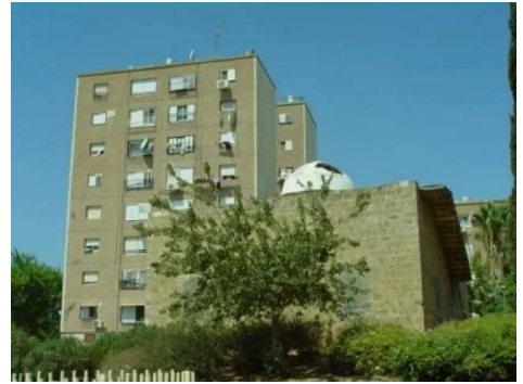
المنشيه: مسجد منشية عكا بعد تعرضه للتخريب