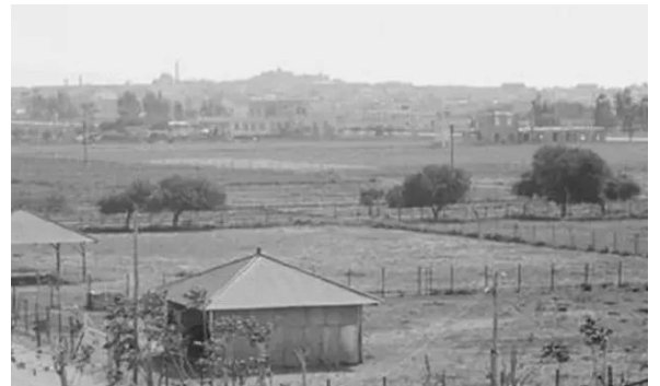
المنشيه: صورة للمنشية في عكا ويظهر معمل الكازوز سبينيس وارااضي ومنشآت الدابويما