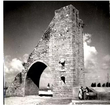
المنشيه: عين مياه قناة الكابري الشهيرة قرب منشية عكا سنة 1928 وبعض النسوة يملئن الماء من العين التي تبعد عن بيوت القرية حوالي 500 متر