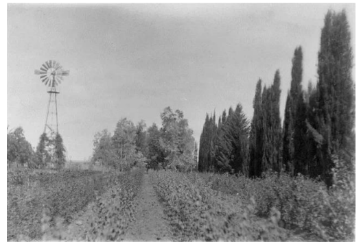
المنشيه: ارض الدبويما في منشية عكا سنة 1929