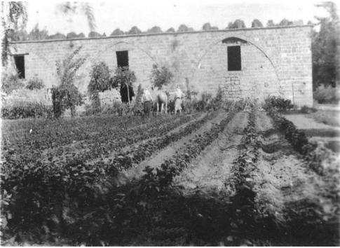
المنشيه: المبنى العثماني القديم الذي يعتقد كان مشفى ومخزن للقوات العثمانية على اراضي المنشية ومن هناك اشتقت اسم دبويما أي مخزن سنة 1929