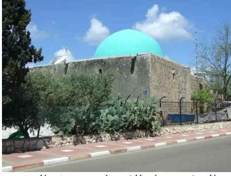
المنشيه: مقام للشيخ ابو عتبة في القرية