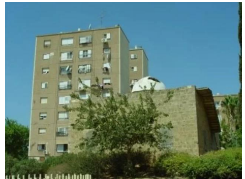
المنشيه: مسجد منشية عكا بعد تعرضه للتخريب