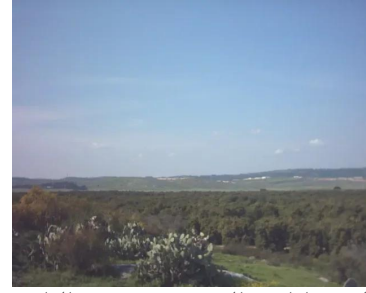
البروه: أراضي القرية من جهة قرية الدامون