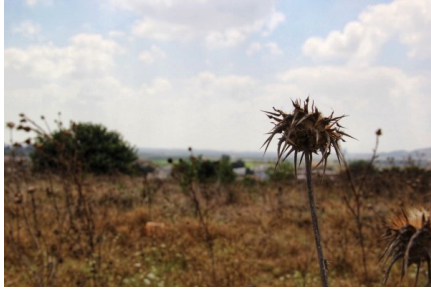
مطل من قرية البروة