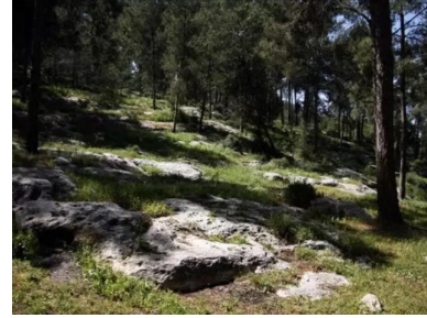
البروه: القسم الشمالي من القرية مغطى بالاحراش