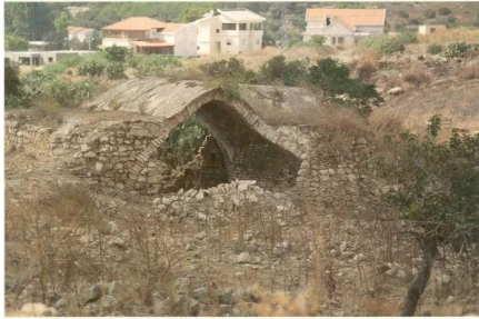
البروة: آثار معصرة الزيتون المدمرة