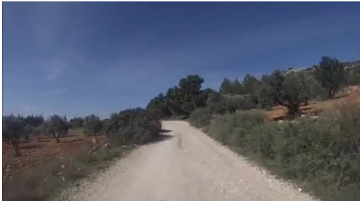
البروة: الطريق الى القرية