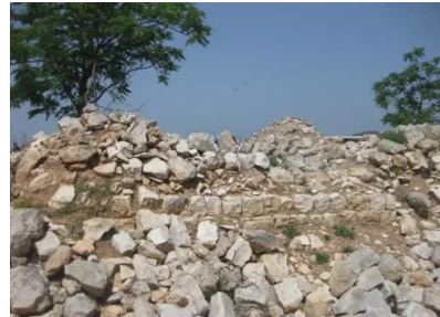
البروه: مقبره القرية