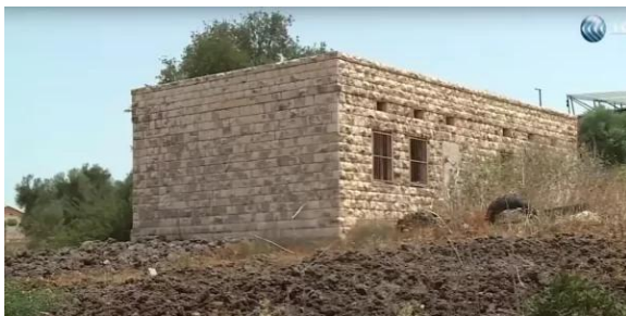
البروة: مدرسة البروة