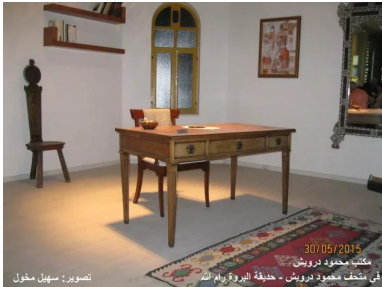
البروه: مكتب محمود درويش - حديقة البروة 30/05/2015 مكتب محمود درويش - حديقة البروة - رام الله في مكتب محمود درويش - حديقة البروة - رام الله