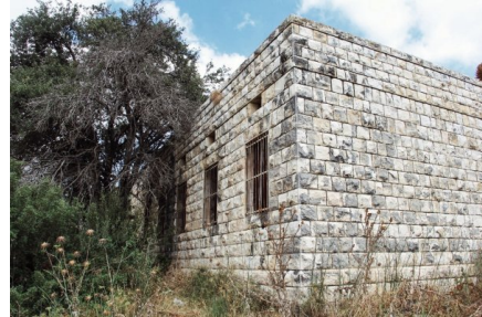
مدرسة البروة من الخارج