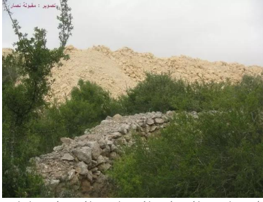
البروه: تظهر ناحية المنطقة الصناعية التي تلتهم أراضي القرية : 21.4.2005