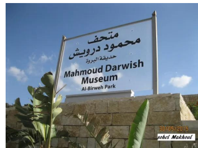
البروة: حديقة البروة - متحف محمود درويش