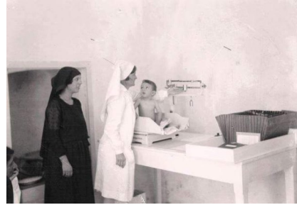
البروة: محمود درويش الطفل مع امه في احد مستشفيات حيفا عام 1942