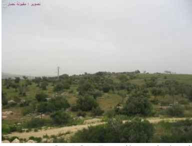
البروه: منظر عام لموقع القرية 21.4.2005