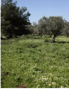
البروه: امن أراضي وزيتون القرية