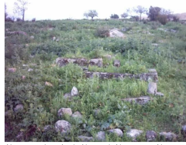
البروه: جانب من المقبرة , الناحية الداخلية ( شرقي القرية ) 2003