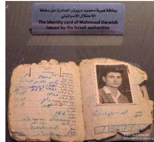
البروة: هوية محمود درويش الصادرة من الإحتلال