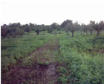
البروه: طريق تمر من أراضي القرية , من الناحية الشرقية تصل الى المقبرة 2003