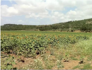
البروه: من أراضي القرية