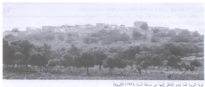
البروه: منظر عام للبروة، أنقر الصورة لتكبيرها. 1928 قرية البروة كما تبدو للناظر إليها من مسافة (سنة ١٩٢٨) [البروة]