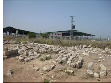
البروه: مقبره القرية