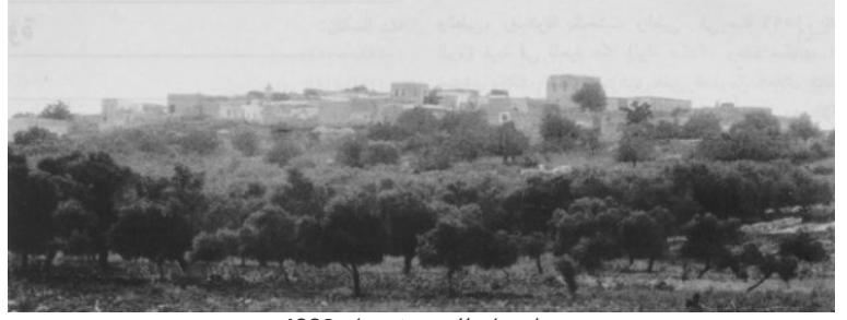
منظر عام للبروة في عام 1928 .