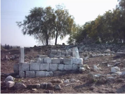
الدامون: أحد القبور الواضحة , من مقبرة الدامون 30/3/2003 الصورة ملتقطة من الجانب الداخلي للمقبرة, التي يقوم أهل القرية بتنظيفها بشكل مستمر , المقبرة واقعة الى يمين الشارع المؤدي الى قرية كابول