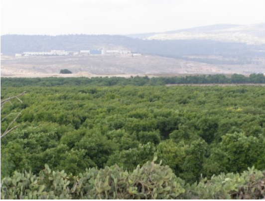
الدامون: اراضي القرية 8 2009