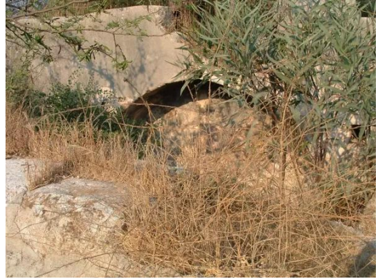
الدامون: إحدى عيون الماء في القرية