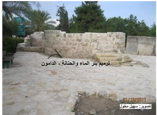
الدامون: ترميم بئر الماء والحنانة - الدامون