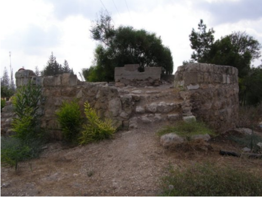
الدامون: عين الدامون 8 2009