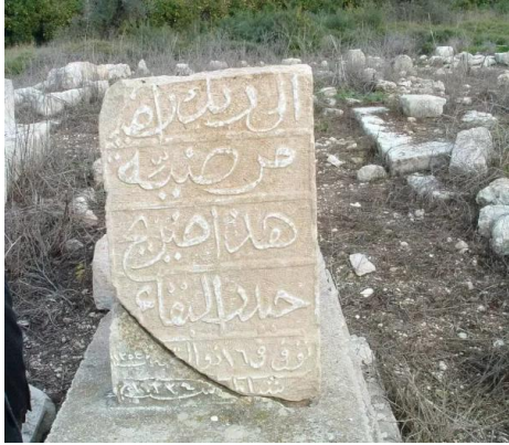
الدامون: شاهد قبر السيد حيدر البقاعي