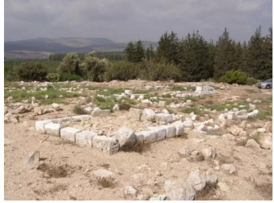
الدامون: مقبرة القرية 8 2009