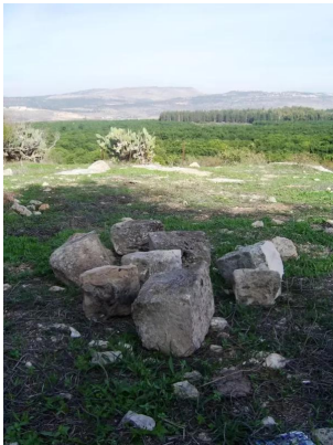
الدامون: حجارة مقبرة الدامون المتبقية بعد افشال محاولة السرقة 3 كانون اول 2005 ... تصوير سلام ذياب