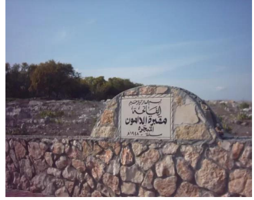
الدامون: مقبرة الدامون بعد ترميم السور المقابل لشارع الدامون كابول