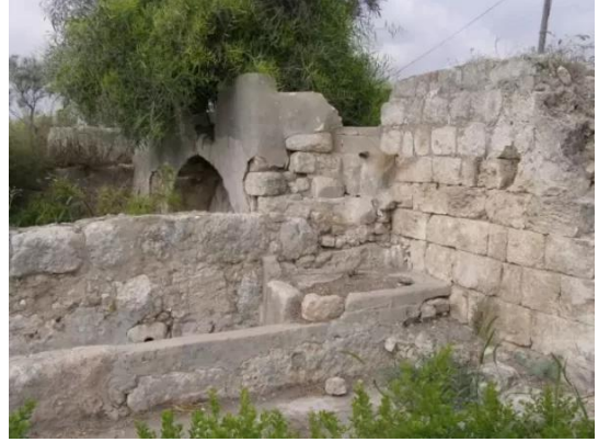
الدامون: عين الدامون 8 2009