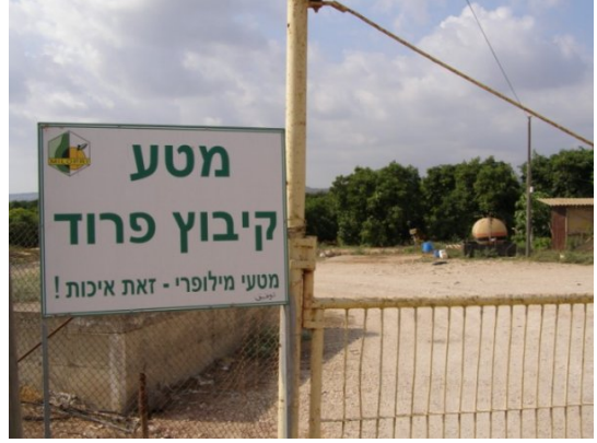
الدامون: كيبوتس فرود المبني على اراضي الدامون 8 2009