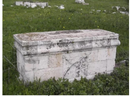
مجدل يابا (الصادق): أحد القبور