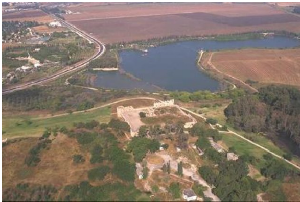
مجدل يابا (الصادق) - نهر العوجا