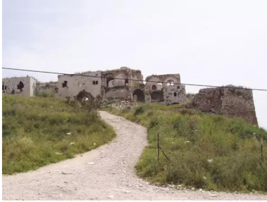
مجدل يابا (الصادق): منظر عام من للقلعة