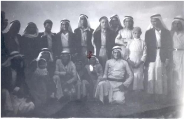
مجدل يابا (الصادق): صورة لبعض أهل مجدل يابا 1946