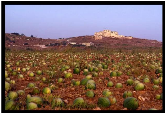
مجدل يابا (الصادق): مزارع البطيخ