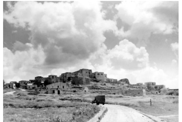
مجدل يابا (الصادق): مجدل الصادق 1948 احتلال القرية