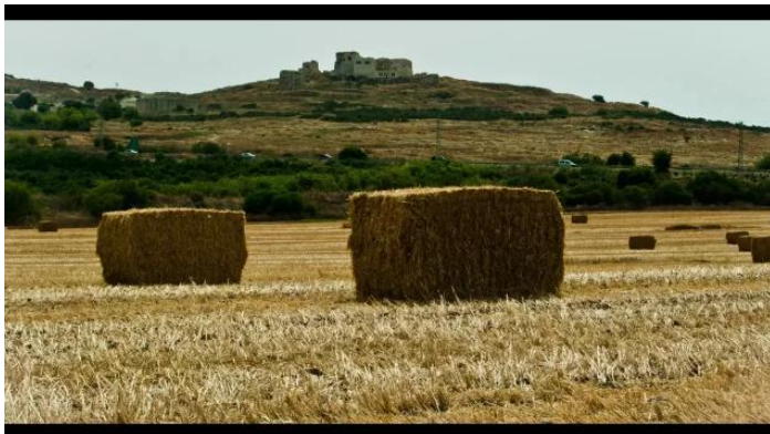
مجدل يابا (الصادق): صور حديثة لقلعة الريان