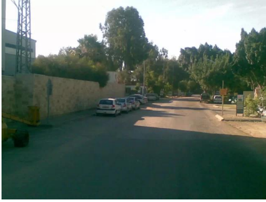
مجدل يابا (الصادق): صورة لكيبوتس عينات الصهيوني الواقع على اراضي القرية