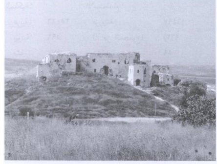
حصن آل الريان كما يبدو للناظر إليه من جهة الشمال (حزيران/يونيو ١٩٨٧) [مجدل يابا]