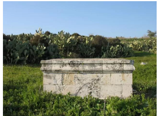
مجدل يابا (الصادق): أحد القبور