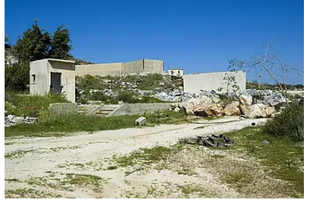
مجدل يابا (الصادق): محجر قديم مهجور