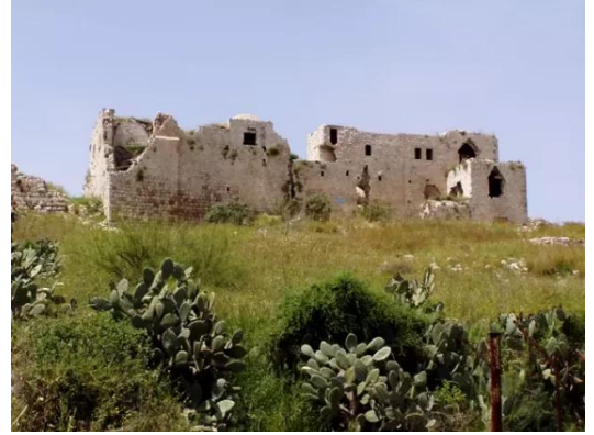
مجدل يابا (الصادق): مجدل يابا