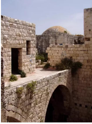
مجدل يابا (الصادق): منظر عام من داخل القلعة