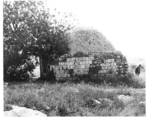
مجدل يابا صورة قديمه لمقام برز الدين