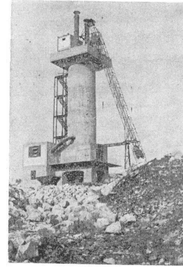
فابريكة مجدل يابا 1