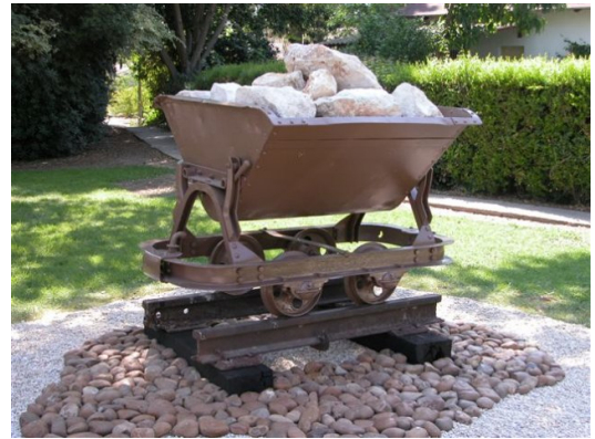
لعربة التي كانت تستخدم في نقل الحمص والحجارة من كسارات مجدل يابا