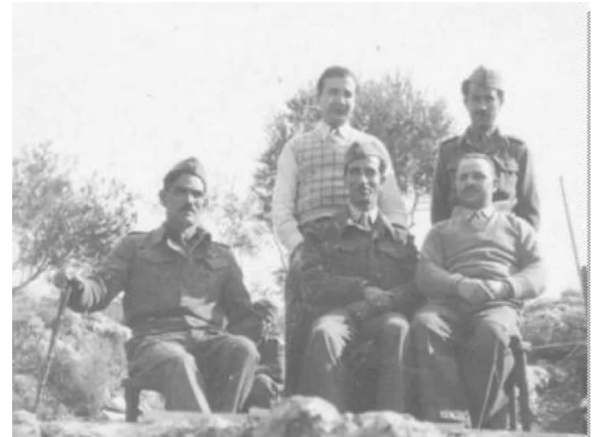
مجدل يابا (الصادق): القائد العراقي عبدالكريم قاسم في مجدل يابا