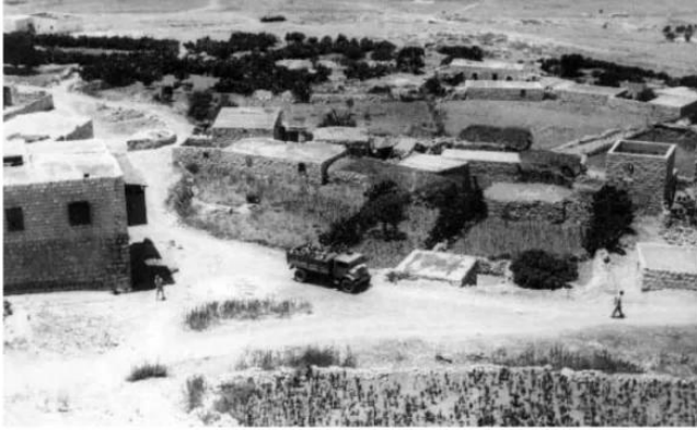
مجدل يابا (الصادق): العصابات الصهيونية في مجدل يابا