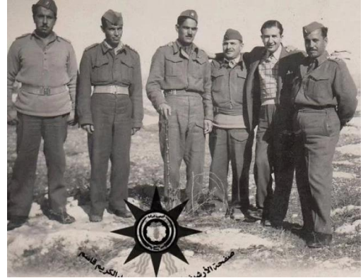
مجدل يابا (الصادق): : القائد العراقي عبدالكريم قاسم في شمال مجدل يابا