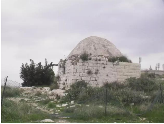
مجدل يابا (الصادق): مقام ليس معرف موجود من الناحية الشمالية من قلعة الريان