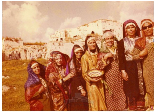
مجدل يابا (الصادق): فرقة الفنون الشعبية اليمنية مقابل قلعة مجدل يابا