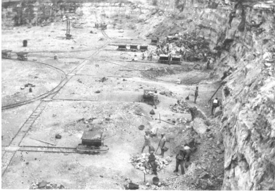
مجدل يابا (الصادق): عمال في كسارات مجدل يابا 1936