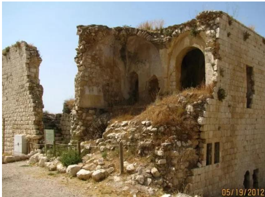
مجدل يابا (الصادق): مناظر حديثة للقلعة