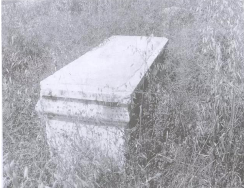
مجدل يابا (الصادق): ضريح في مقبرة القرية