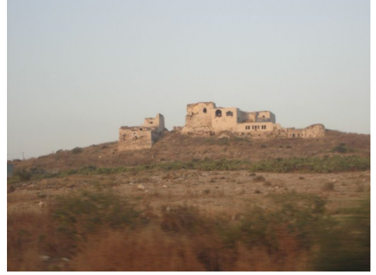
مجدل يابا (الصادق): منظر عام لقلعة الريان-الصادق