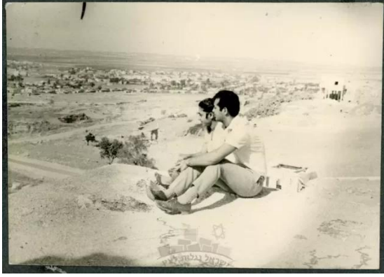
مجدل يابا (الصادق): مجدل يابا باتجاه الغرب وتظهر بالصورة بعض البيوت المتبقية 1965