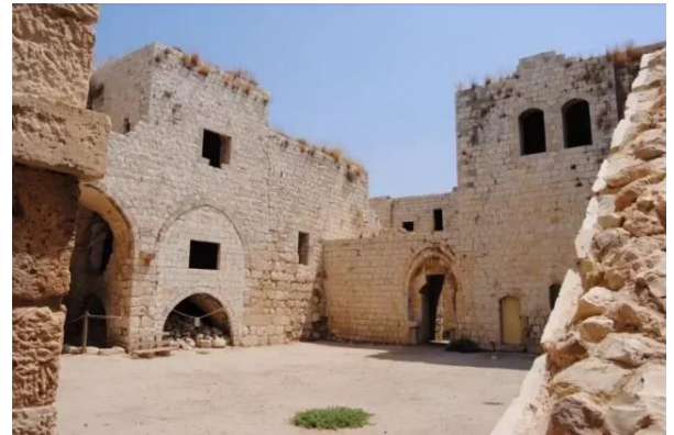
مجدل يابا (الصادق): القلعة من الداخل