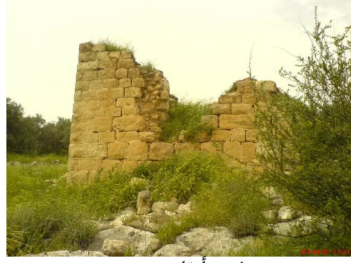
بيت شنة: أنقاض بيت مدمر