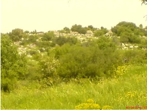
بيت شنة: أطلال بيوت القرية المدمره