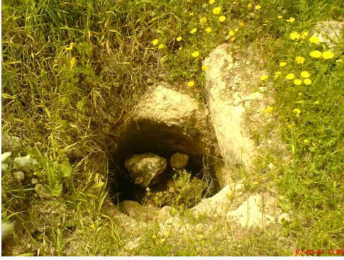
بيت شنة: بئر ماء في أرض القرية