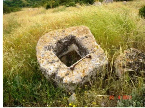
بيت شنة: اغطية احد الابار في القرية