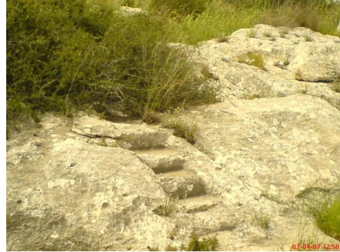
بيت شنة: آثار جوار القرية