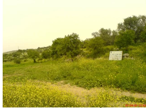
بيت شنة: أطلال بيوت القرية المدمره