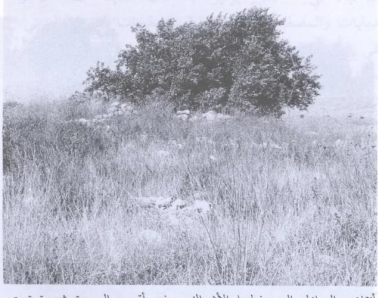
أبقاض المنازل التي غطتها الأشواك، وفي أقصى الصورة شجرة توت. المشهد إلى الشمال الشرقي من وسط الموقع (حزيران/يونيو ١٩٩٠) [بيت شنة]