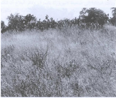
الأشواك ونبات الصبّار في موقع القرية (حزيران/يونيو ١٩٩٠) [بيت شنة]