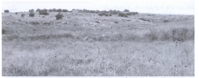
منظر عام لموقع بيت شنة، وفي منزل ما زال قائماً في الجهة الجنوبية الشرقية من موقع القرية. المشهد كما يبدو للناظر إليه من جهة الجنوب الشرقي (حزيران/يونيو ١٩٩٠) [بيت شنة]