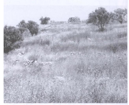
انقاض في موقع القرية (حزيران/يونيو ١٩٩٠) [خربة البويرة]

خربة البويرة: منظر لموقع القرية التي دمرها الصهاينة وطهروا سكانها عرقيا، 1990. أطلال دمار بيوت القرية واضحة.