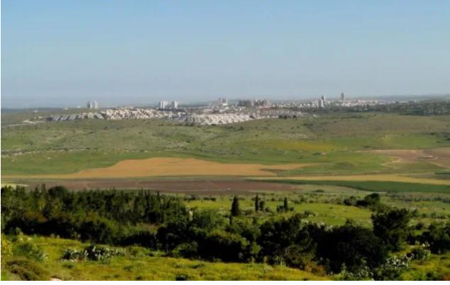
خربة البويرة: منظر عام لموقع القرية