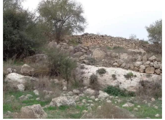
خربة البويرة: انقاض