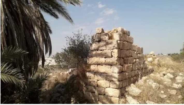
خربة البويرة: انقاض احد البيوت المدمرة

خربة البويرة: منظر لموقع القرية التي دمرها الصهاينة وطهروا سكانها عرقيا، 1990. أطلال دمار بيوت القرية واضحة.