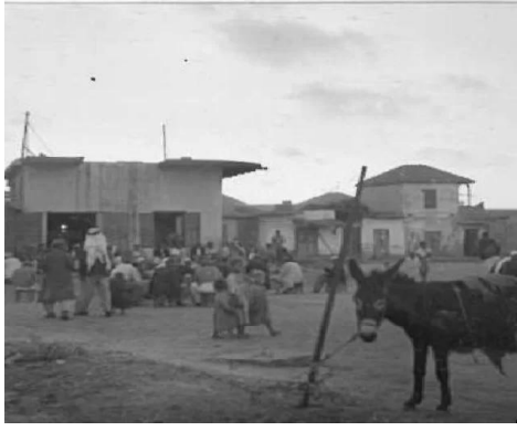
زرنوقة: زرنوقة 1946