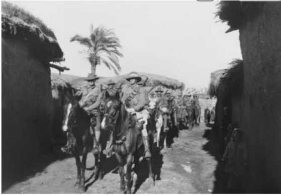
زرنوقة: الجيش البريطاني في الزرنوقه سنه 1918