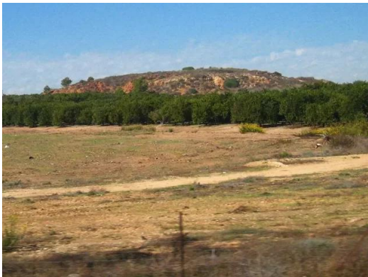
زرنوقة: صور حديثة تظهر هضاب قرية زرنوقة وطبيعتها.