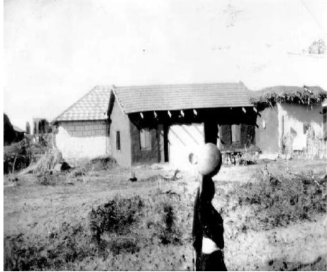
زرنوقة: زرنوقة 1946