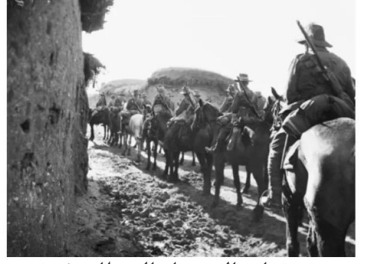
زرنوقة: قوات الاستعمار البريطاني في قريه الزرنوقه سنه 1918