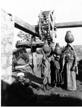
زرنوقة: صوره لنساء الزرنوقه سنه 1918