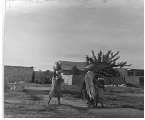
زرنوقة: زرنوقة 1946