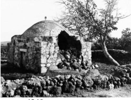
زرنوقة: زرنوقه سنه 1918