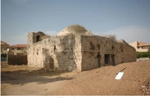
زرنوقة: جامع القرية