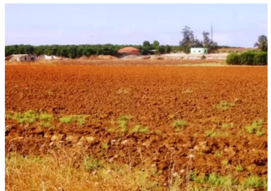
زرنوقة: اراضي القرية