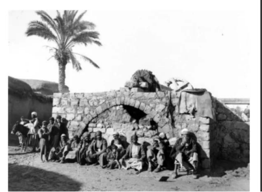
زرنوقة: صوره لبئر الماء في قريه الزرنوقه سنه 1918