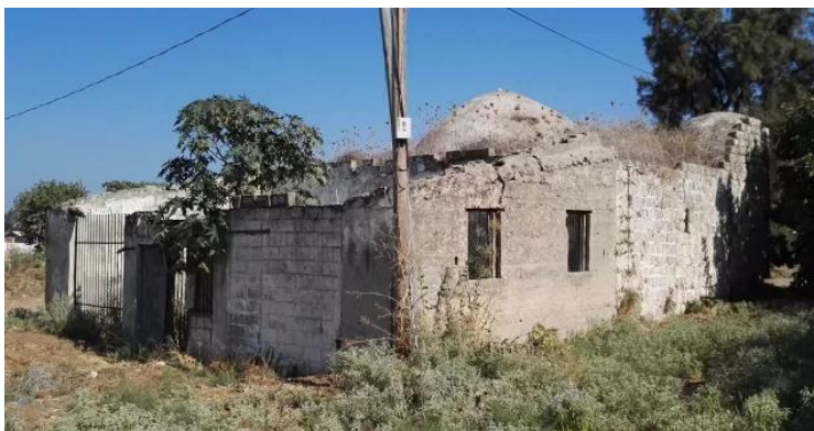
زرنوقة: جامع القرية المغتصب