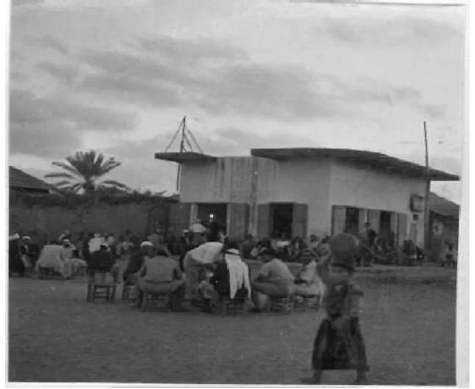
زرنوقة: زرنوقة 1946