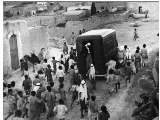
زرنوقة: سيارة مصلحة الاذاعة والسينما الفلسطينية تجوب شوارع قرية زرنوقة والاطفال يركضون ورائها لمشاهدة لقطات من السينما الصامتة .. - 1938