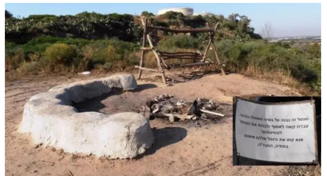
المغار: موقع القرية