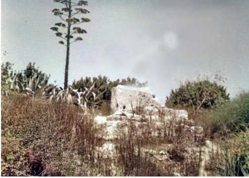
المغار: صورة لقرية المغار عام 1980