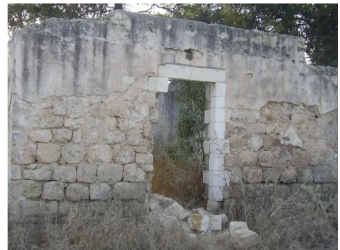
المغار: ما تبقى من أحد البيوت