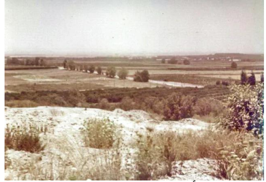
المغار: صورة أحد القبور في مقبرة القرية عام 1980