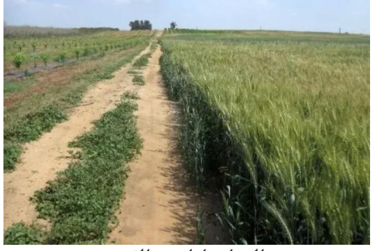
المغار: أراضي القرية