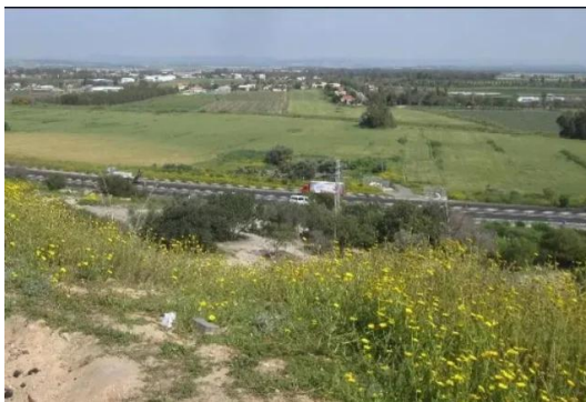
المغار: أراضي القرية