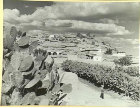
المغار: منظر عام لقرية المغار سنة 1940