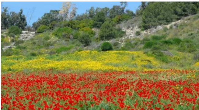
المغار: الربيع في المغار