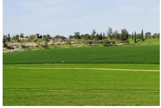
خلدة: اراضي القرية وموقعها بين الشجر