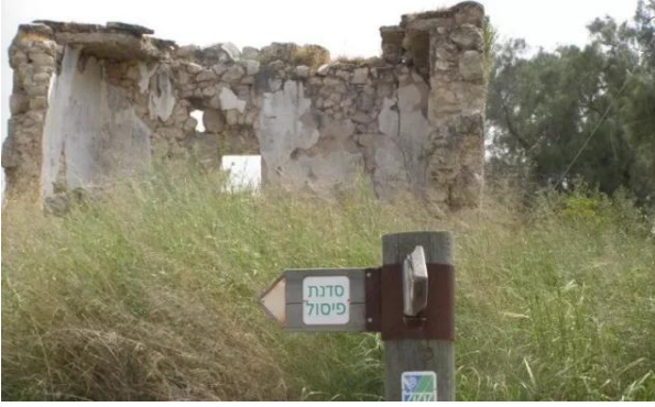
خلدة: اثار بيوت القرية