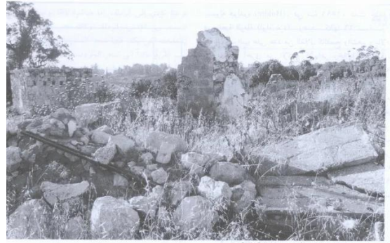
بنايا بعض منازل القرية (حزيران/يونيو ١٩٩٠) [خلدة]

خلدة: أطلال بيوت القرية المدمرة، أنقر الصورة لتكبيرها. 1990