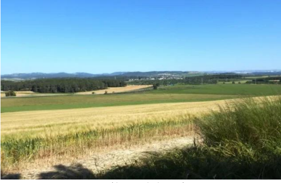
خلدة: اراضي القرية