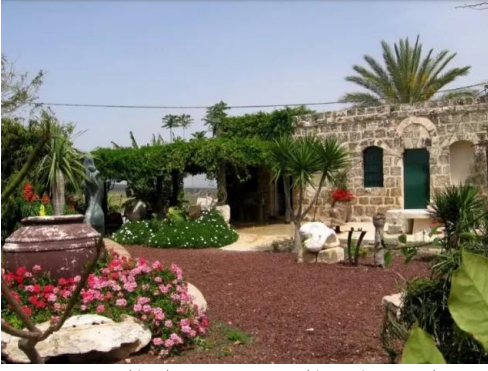
خلدة: جامع القرية تم تحويله الى متحف