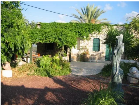
خلدة: إحدى بيوت القرية المغتصبة والإن حول لمتحف. 2002