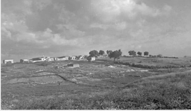
خلدة: منظر عام لقرية خلده قبل النكبة