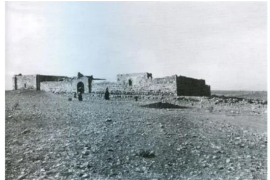
خلدة: قرية خلده قبل النكبة