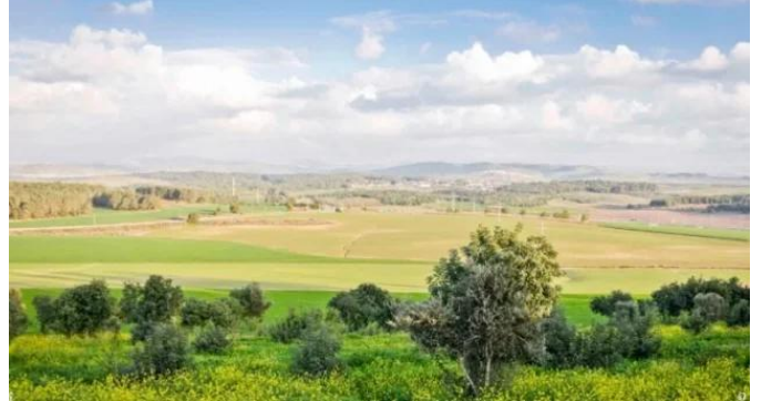
خلدة: من موقع القرية