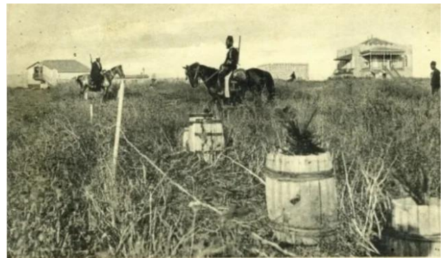
خلدة: قرية خلده قبل النكبة