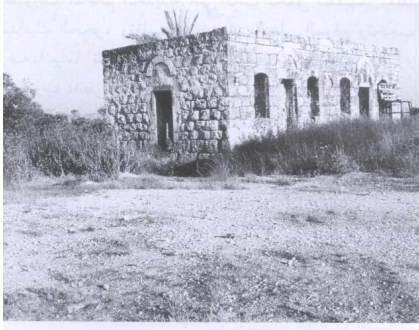
منزل مهجور من منازل القرية (حزيران/يونيو ١٩٩٠) [خلدة]