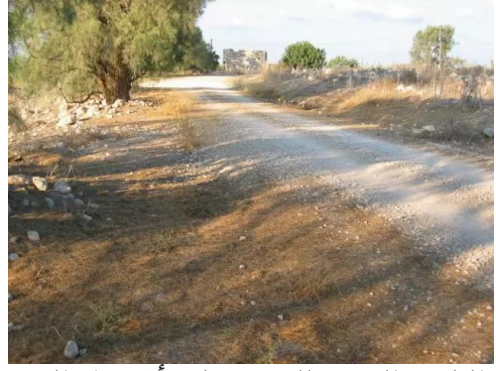
خلدة: الطريق المؤدي للقرية ويظهر أثر دمار البيوت على جانبي الطريق وفي نهايته بيت هدم جزئياً. 2006