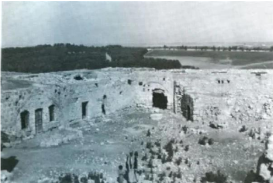
خلدة: قرية خلده قبل النكبة