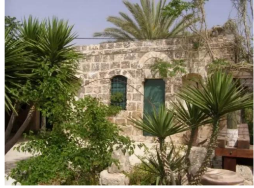
خلدة: جامع القرية