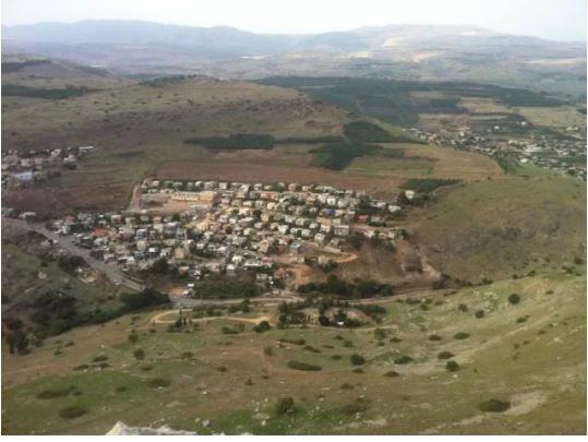
وادي الحمام: منظر عام