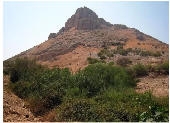
وادي الحمام: موقع القرية