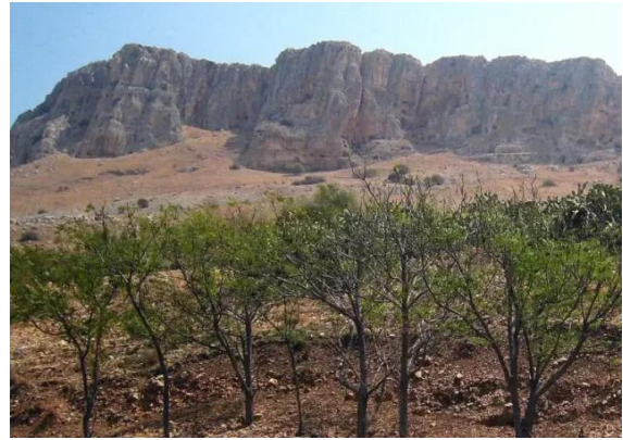
وادي الحمام: موقع قرية وادي الحمام