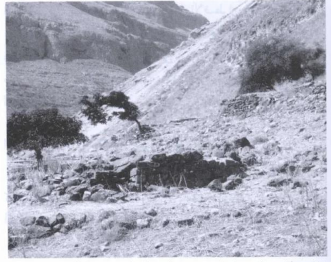
بقايا حيطان منزل وسياجات حجرية (تموز/ يوليو ١٩٨٧) [وادي الحمام]