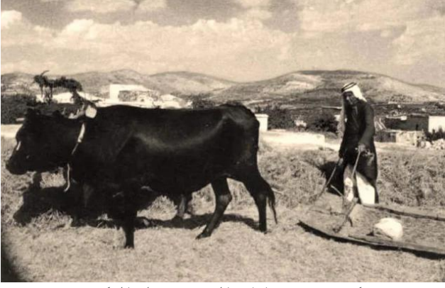
كفر سبت: ايام الحرث قبل النكبة