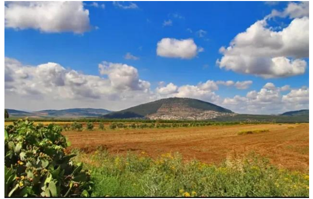
كفر سبت: أراضي قرية كفر سبت