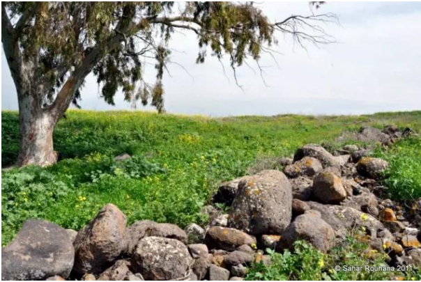
كفر سبت: الاطلال