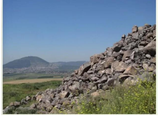
كفر سبت: ردم بيوت القرية