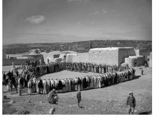
كفر سبت: صلح عشائري .. يوم الجمعة.. 30 مارس 1948