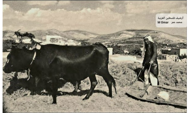
الفلاح والأرض في قرية كفر سبت قضاء طبريا قبل النكبة..