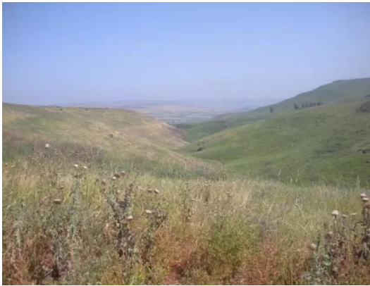
كفر سبت: منظر من شرق القرية