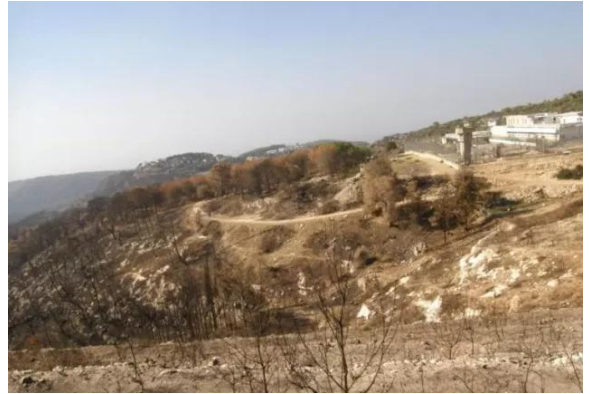
خربة الدامون: موقع القرية