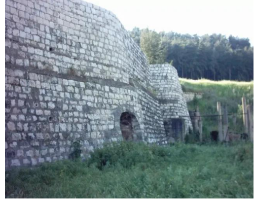
خربة الدامون: مبنى ضخم قديم يتواجد على بعد 2 كيلومتر من موقع القرية الى يمين الشارع المتجه جنوباً والذي يتفرع فيما بعد الى وادي الملح غرباً ووادي عارة جنوباً