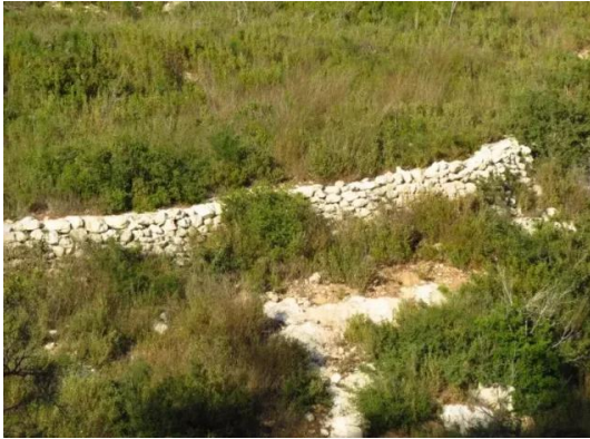
خربة الدامون: من آثار القرية