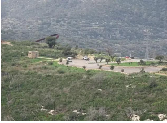
خربة الدامون: موقع القرية