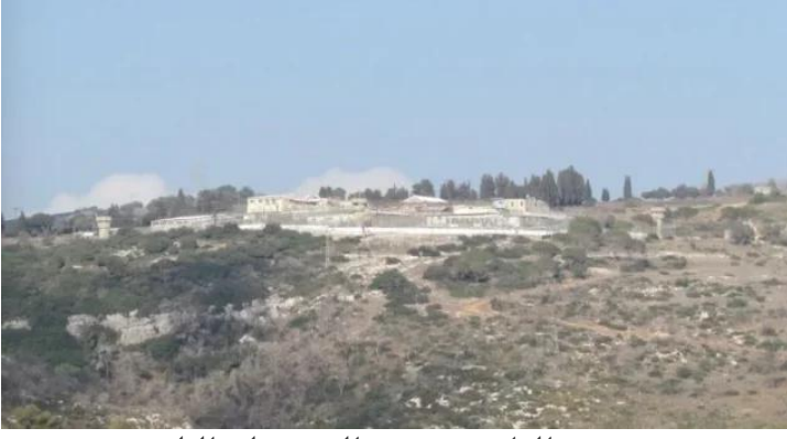
خربة الدامون: موقع القرية على التله