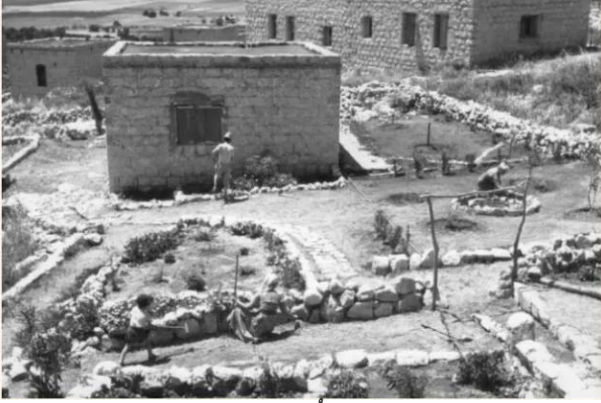
عين حوض: صورة نادرة أخذت بعد النكبة والمغتصبين يرممون القرية إستعداداً للسكن فيها. 1954