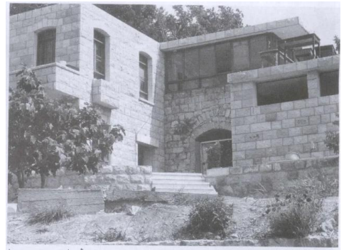
أحد منازل القرية، وقد جددته السكان اليهود ووسعوه (أيار/مايو ١٩٨٧) [عين حوض]

عين حوض: منظر عام نادر في الاتجاه الغربي أخذ بعد اغتصاب القرية تموز 1948