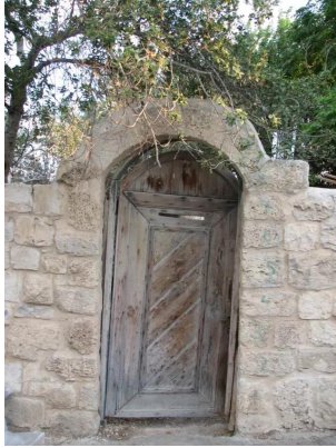
عين حوض: مدخل بيت مغتصب