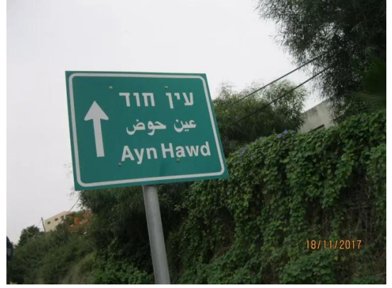
عين حوض: هنا عين حوض المهجرة والمغتصبة