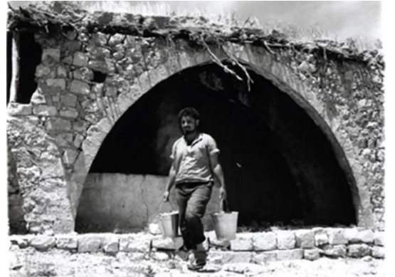
عين حوض: صورة نادرة أخذت بعد النكبة والمغتصبين يرممون القرية إستعداداً للسكن فيها. 1954