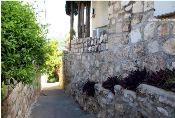
عين حوض: جولة حديثة في القرية