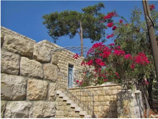
قرية عين الحوض المهجرة