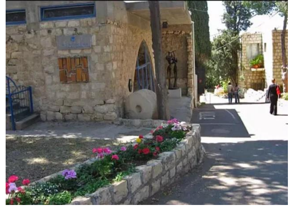
قرية عين الحوض المهجرة