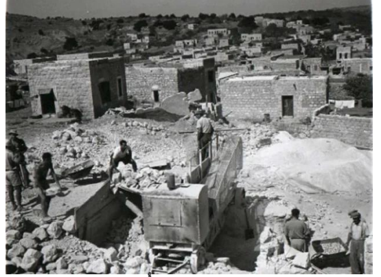
عين حوض: صورة نادرة أخذت بعد النكبة والمغتصبين يرممون القرية إستعداداً للسكن فيها. 1954