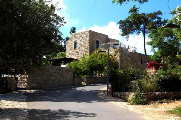
عين حوض: جولة حديثة في القرية