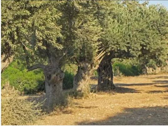
عين حوض: زيتون عين حوض