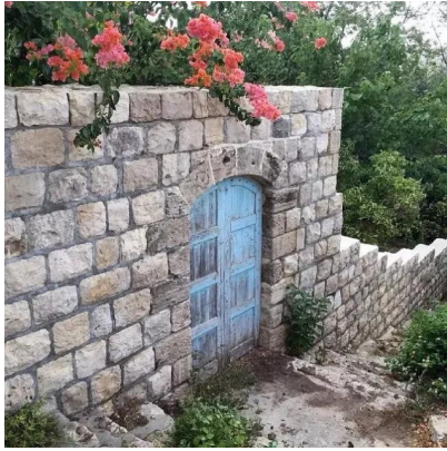
قرية عين الحوض المهجرة