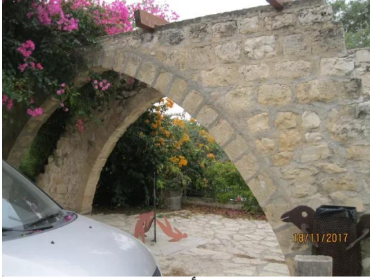
عين حوض: قناطر أحد بيوت عين حوض