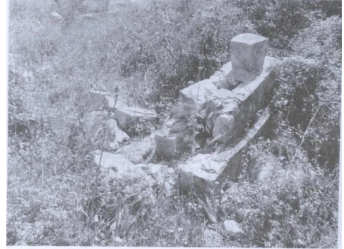
ضريح في مقبرة القرية (أيار/مايو ١٩٨٧) [عين حوض]