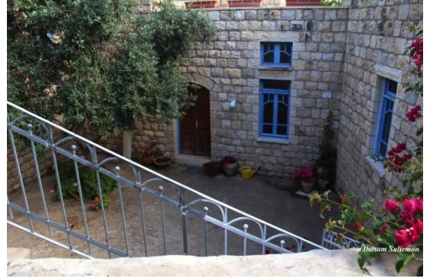
عين حوض: جولة حديثة في القرية