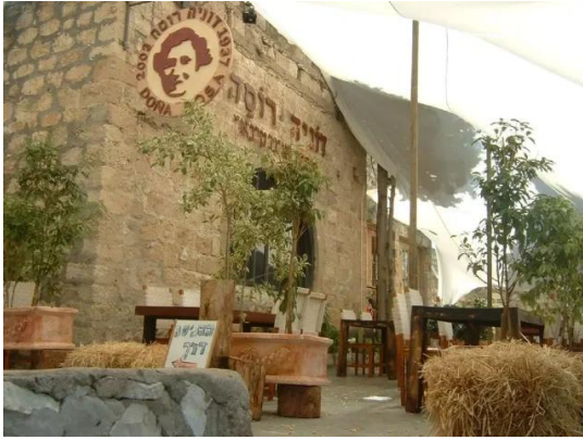
عين حوض: ساحة جامع القرية المغتصب. 2004