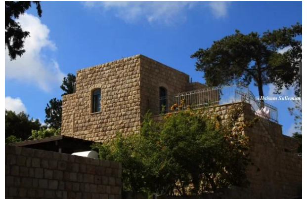
عين حوض: جولة حديثة في القرية