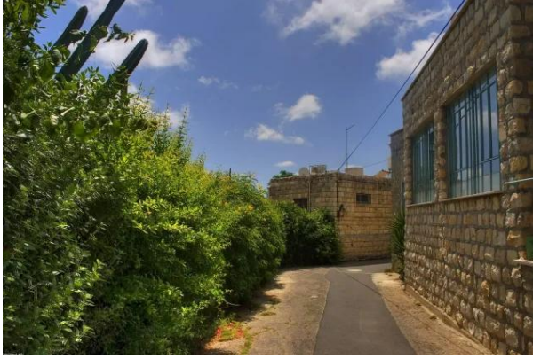
قرية عين الحوض المهجرة