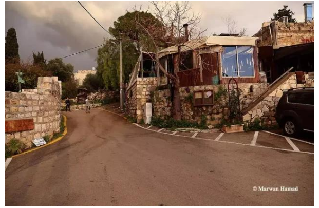
قرية عين الحوض المهجرة