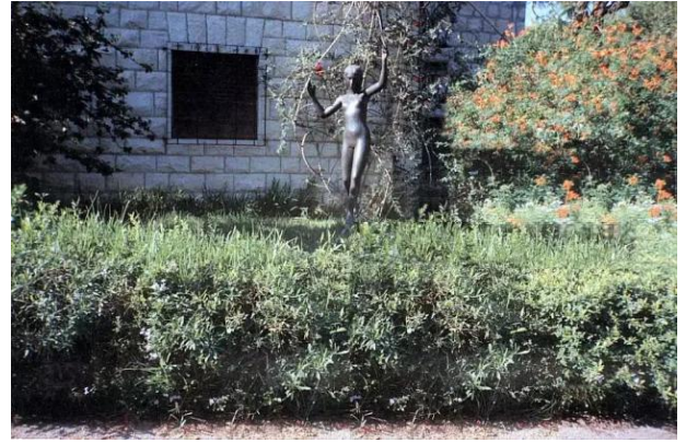
قرية عين الحوض المهجرة