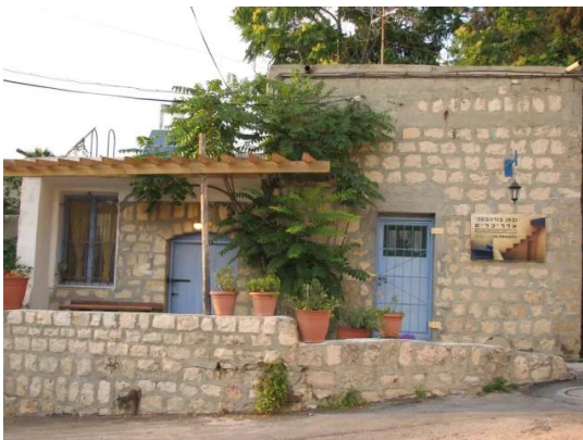
عين حوض: منظر لبيوت مغتصبة