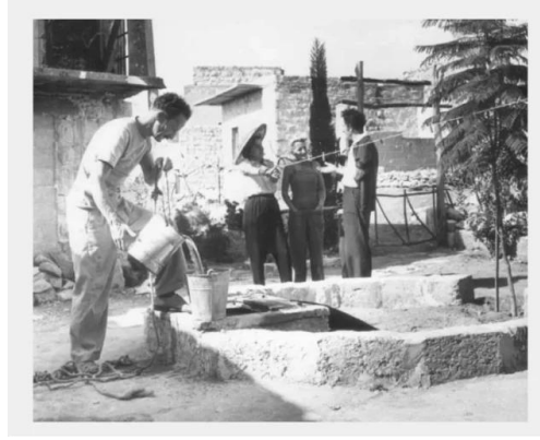
عين حوض: عين حوض بعد احتلالها