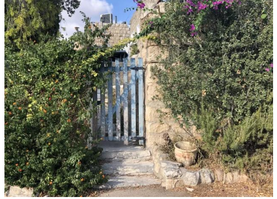
قرية عين الحوض المهجرة