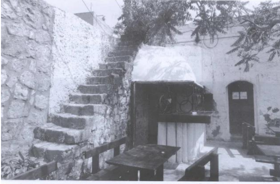
مسجد القرية، وقد بات الآن مطبخاً ومقصفاً يباع فيه بوناترا (أيار/مايو ١٩٨٧) [عين حوض]

عين حوض: جامع القرية المقتصب الذي حوله الاسرائيليون الى بار او مقهى. 1987