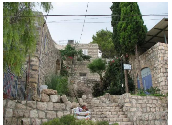
عين حوض: منظر لبيوت مغتصبة