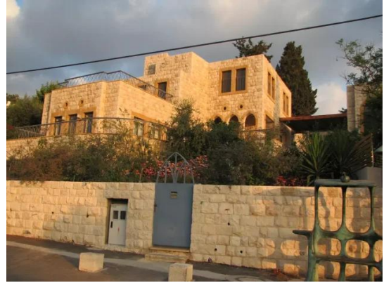
عين حوض: احدى البيوت المغتصبة