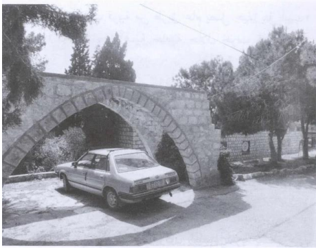
قطرة حجرية (أيار/مايو ١٩٨٧) [عين حوض]

عين حوض: صورته لعين حوض بعد الاحتلال ويظهر فيها الممستوطنون واستيلائهم على الاراضي العربية