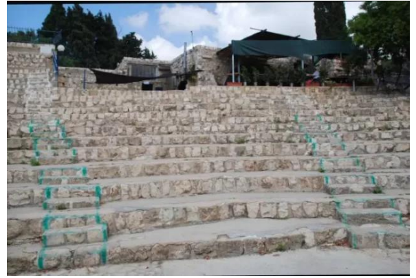
عين حوض: ادراج عين حوض