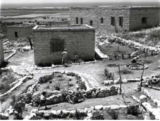
قرية عين الحوض المهجرة