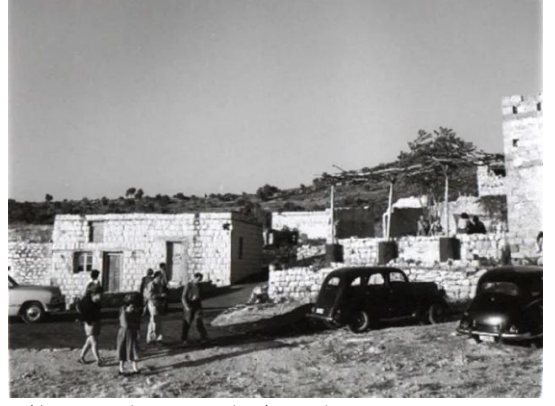
عين حوض: صورة نادرة لفنانين صهاينة في القرية سنة 1954.