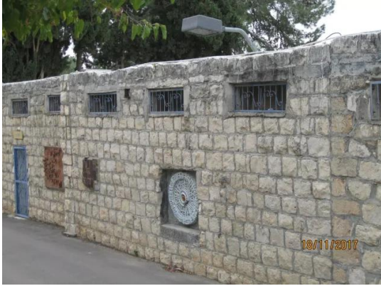
عين حوض: مدرسة قرية عين حوض المهجرة أصبحت متاجر