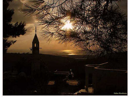
عين حوض: منظر الغروب بعين حوض 2008