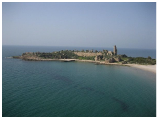
عتليت: قلعه عتليت