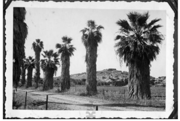
عتليت: عتليت قبل النكبه