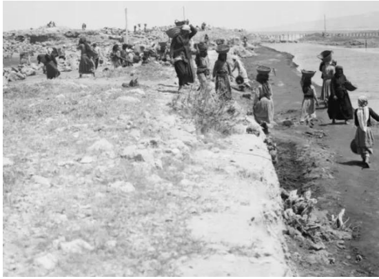
عتليت: صوره من عتليت المهجره قبل النكبه