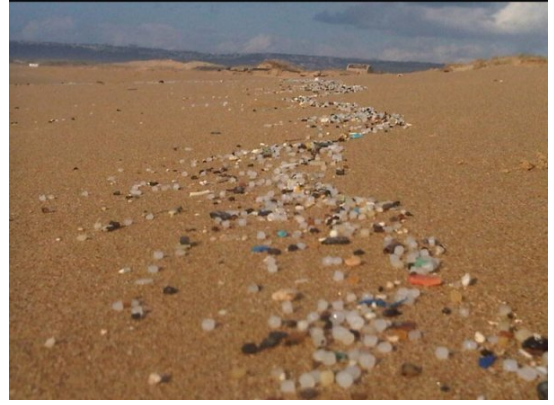
عتليت: شاطئ بحر عتليت