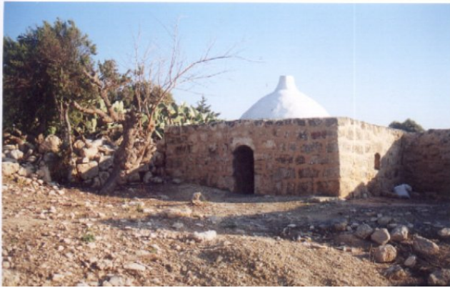
عتليت: مقام لاحدى الصالحين