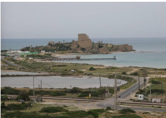
عتليت: قلعه عتليت