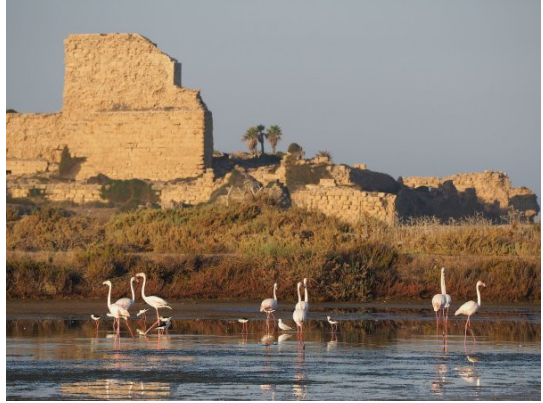
عتليت: قلعه عتليت