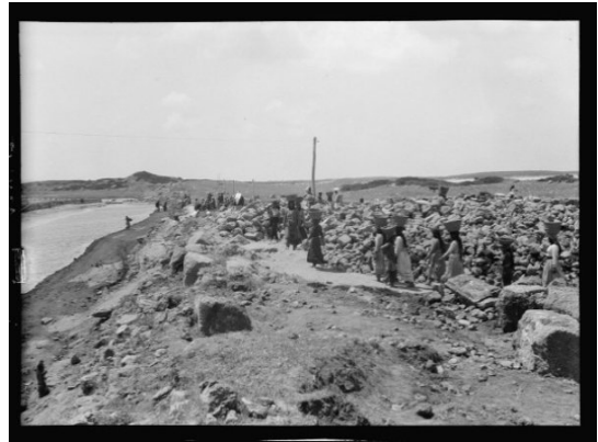
عتليت: عتليت قبل النكبه