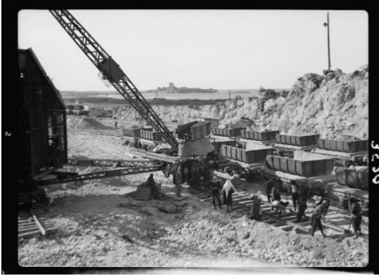
عتليت: ترميم خط سكه الحديد بالقرب من عتليت قبل النكبه