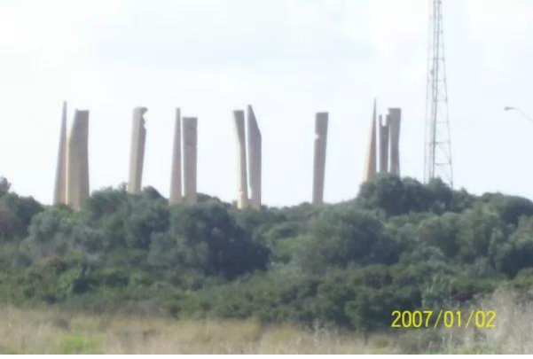
عتليت: أعمدة أسمنت بمثابة نصب تذكاري للرياضيين الصهاينة الذين قتلوا بعملية ميونخ عام 1972