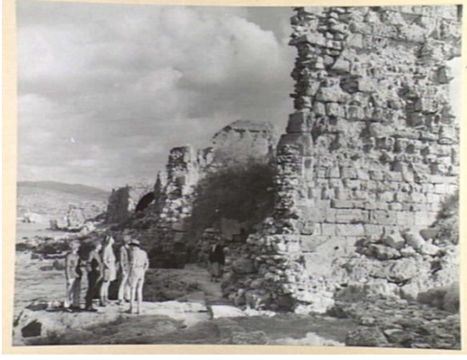
عتليت: عتليت سنه 1940