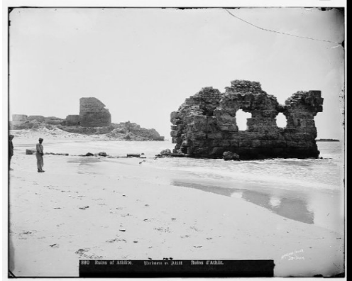
عتليت: عتليت قبل النكبه