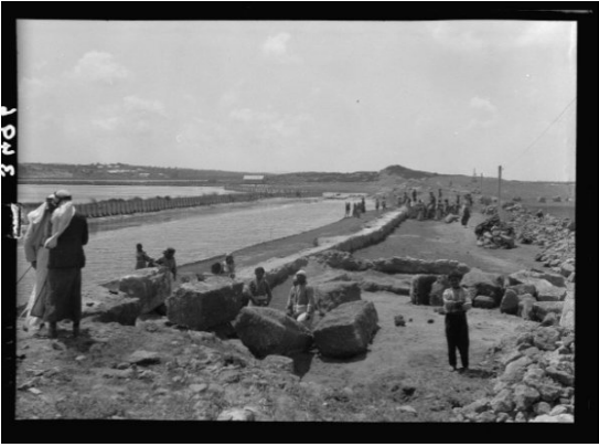
عتليت: عتليت قبل النكبه