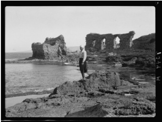
عتليت: عتليت قبل النكبه