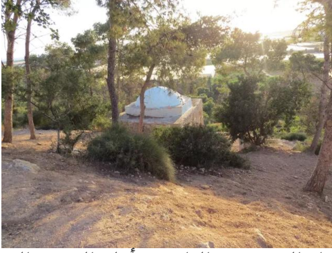
جبع: مقام الشيخ عمير الواقع في أعلى المنحدر الذي قامت عليه قرية جبع حيفا المهجرة وبجانبه خربة المنارة .