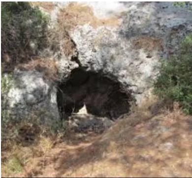
جبع: امدخل لمغاره كان يستعملها اهل جبع