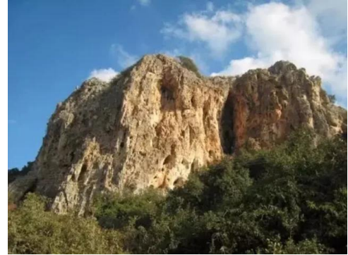
جبع: مغاره من جهه الشمال الشرقي للقرية