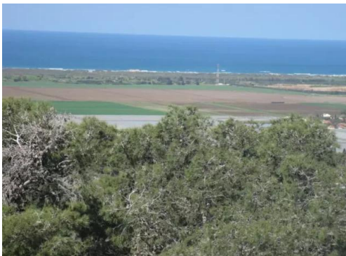
جبع: منظر من موقع القرية باتجاه الغرب