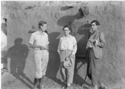
جبع: عالمه الآثار دوروتي جارود في جبع سنة 1931