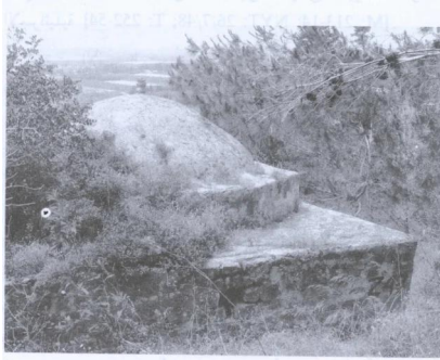
مقام ولى القريه (أيار/ مايو ١٩٨٧) [جبع] جبع: مقام مقام الشيخ (عمير)، 1987.