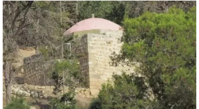
جبع: مقام الشيخ عمير