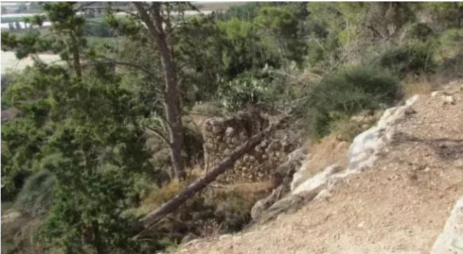
جبع: منظر من شرق القريه