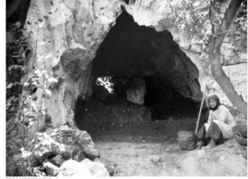
جبع: صورة من مغر قرية جبع سنه 1929