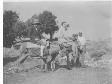
جبع: عالمه الآثار دوروتي جارود في جبع سنة 1929