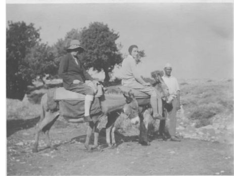
جبع: عالمه الاثار دوروتي جارود في جبع سنه 1929