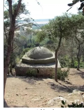
جبع: مقام الشيخ عمير