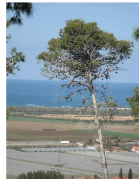
جبع: منظر من موقع قرية جبع باتجاه اراضيها والبحر المتوسط من الغرب