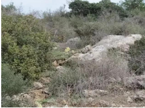
جبع: اثار باقيه لاحدى البيوت من الجبه الشماليه للقرية بالقرب من المقام