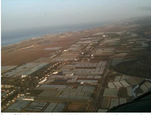
جبع: منظر عام لقرية جبع وأراضيها من جبل الكرمل حتى البحر المتوسط