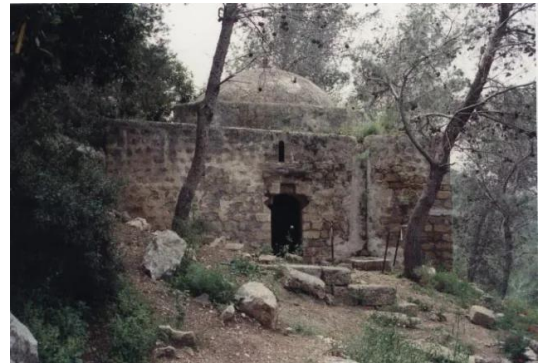
جبع: مقام الشيخ علي، 2002