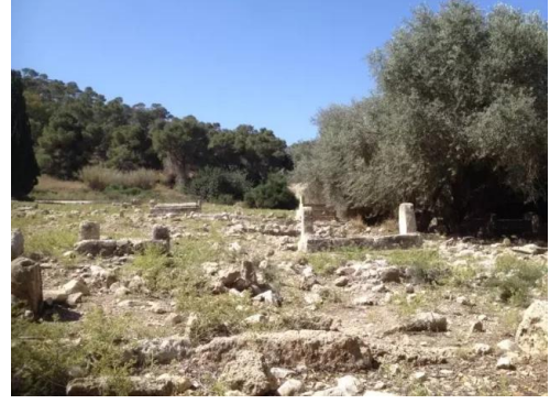
جبع: مقبره قريه جبع