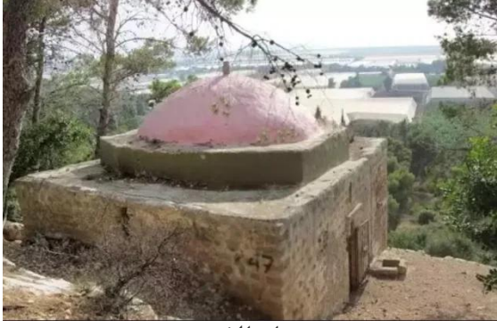
جبع: مقام الشيخ عمير