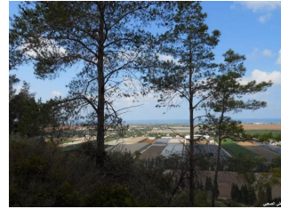
عين غزال: قرية عين غزال واطلالتها الساحرة على البحر