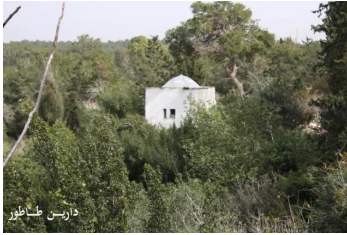
عين غزال: مقام وقبر الشيخ شحادة 2010