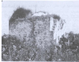
مقام الشيخ شحادة (أبو مايو ١٩٨٧) [عين غزال] عين غزال: مقام الشيخ شحادة عبد الحق، 1987