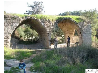
عين غزال: قرية عين غزال المهجرة عز الصعبي