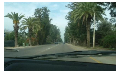
عين غزال: الطريق الى قرية عين غزال عبر قرية الفريديس