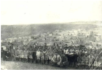
عين غزال: صورة نادره جداً لأطفال كشافة عين غزال قبل النكبة ومن خلفهم يظهر منظر عام للقرية قبل إغتصابها. 1947