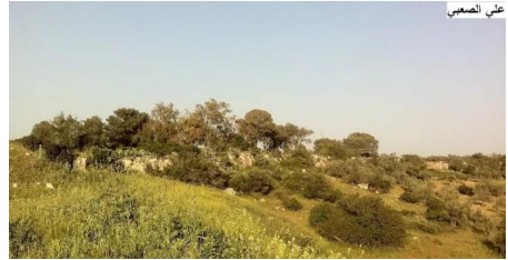
عين غزال: قرية عين غزال المهجرة ويظهر في الصورة بقايا واطلال البيوت المدمرة من قبل الصهاينة