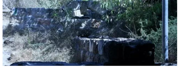
عين غزال: منظر جميل لغروب الشمس للشاطئ المقابل لقرية عين غزال