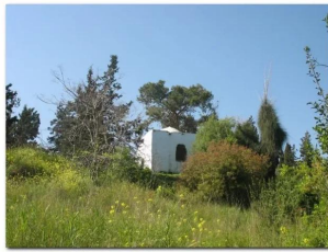
عين غزال: مقام الشيخ شحادة