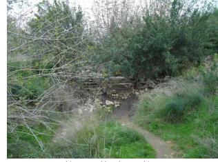
عين غزال: قرية عين غزال منظر للقرية بالقرب من حوض الماء