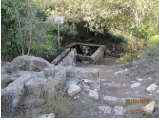
عين غزال: عين ماء قرية عين غزال جديد جدا / علي الصعبي