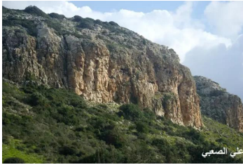
عين غزال: منظر لقمة صخرية جنوب قرية عين غزال