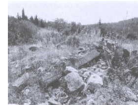
الفاص في موقع القرية (أبو مايو ١٩٨٧) [عين غزال] عين غزال: اطلال البيوت المدمرة، 1987