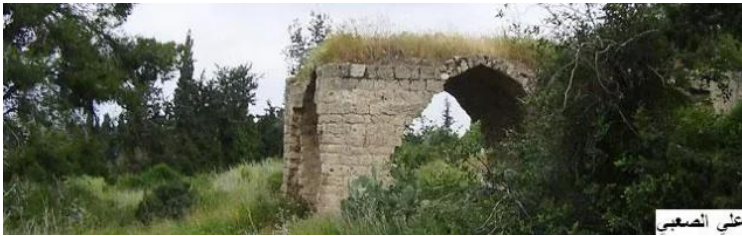
عين غزال: قرية عين غزال المهجرة 2 علي الصعبي