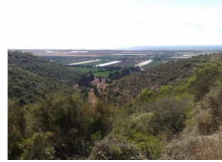
عين غزال: عين غزال