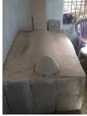
عين غزال: قام وقبر الشيخ شحادة عبد الحق تصوير ماريا ابو راس