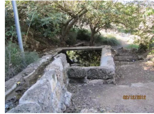
عين غزال: عين ماء قرية عين غزال جديد جدا / علي الصعبي