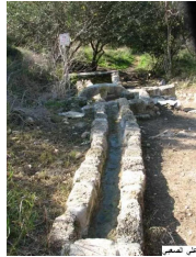
عين غزال: قناة نقل الماء في قرية عين غزال