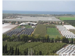
عين غزال: منظر من قرية عين غزال على مغتصبة عين ايلاه المقامة على اراضي القرية