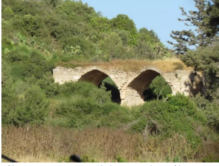
عين غزال: جانب من اراضي قرية عين غزال