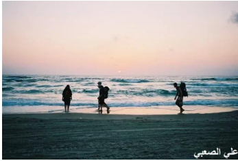
قرية عين غزال المهجرة