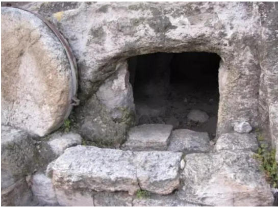
أبو شوشة: الأثار القديمة في أبو شوشه