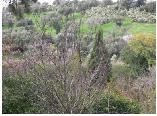
أبو شوشة: منظر عام لاراضي القرية المدمر والمطرة عرقياً.