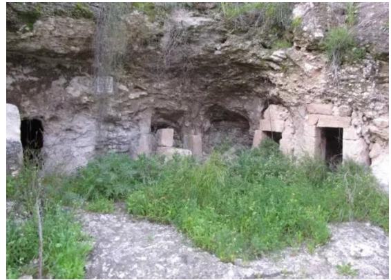
أبو شوشة: الأثار القديمة في أبو شوشه