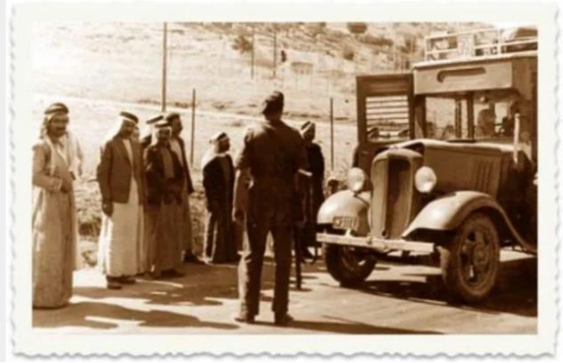
أبو شوشة: أبو شوشه قبل النكبه