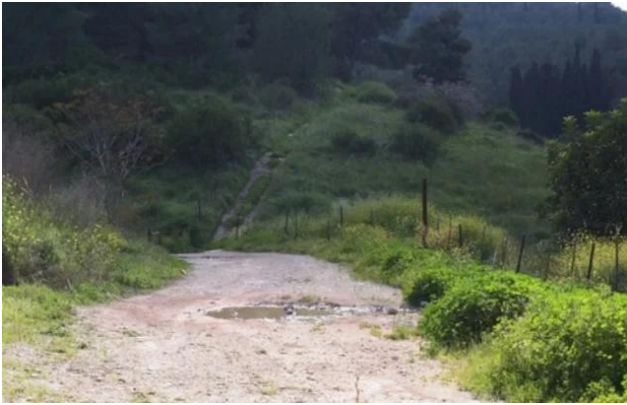
أبو شوشة: أبو شوشه