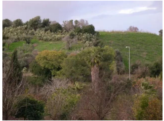
أبو شوشة: منظر عام لاراضي القرية المدمر والمطرة عرقياً.